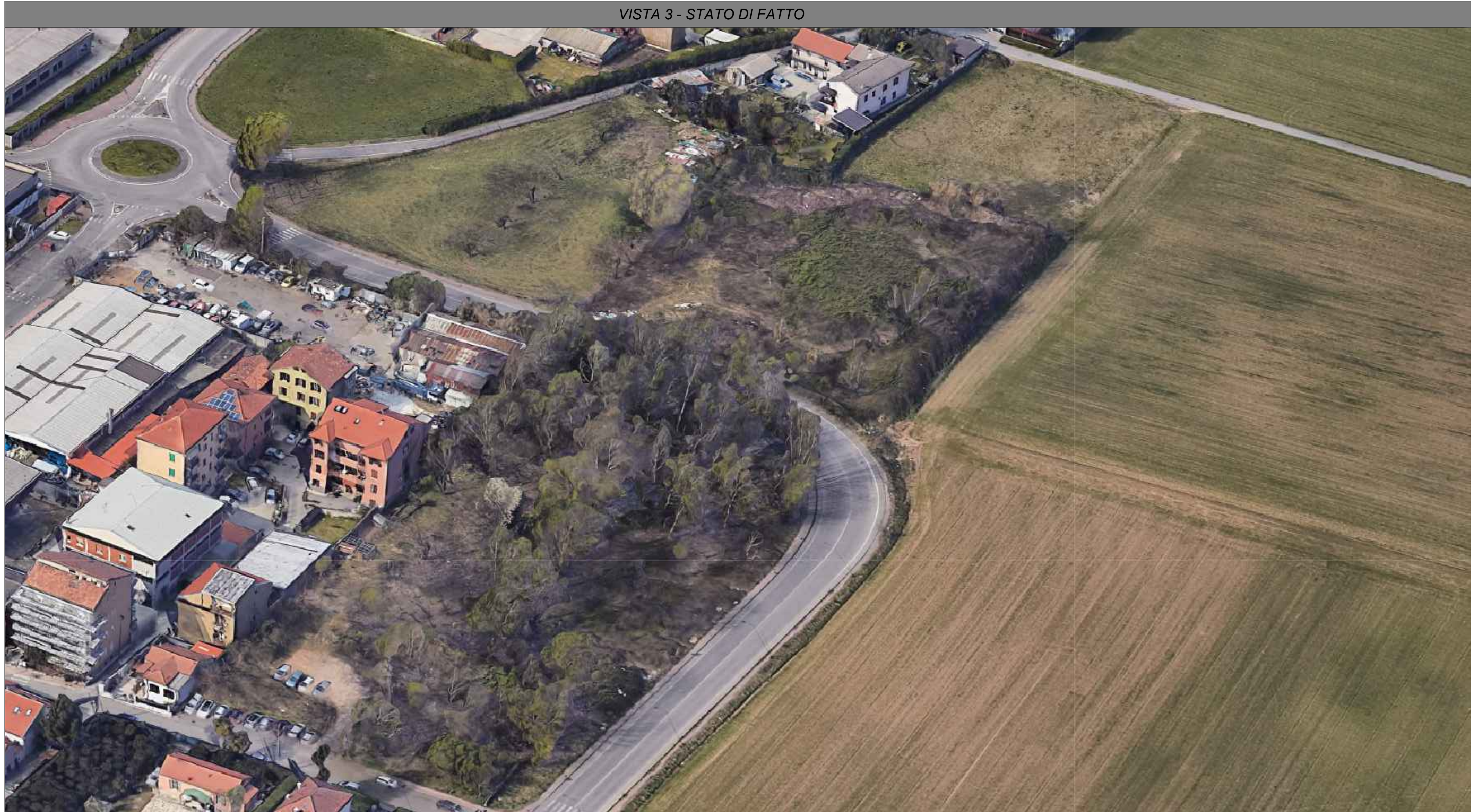
VISTA 3 - STATO DI FATTO