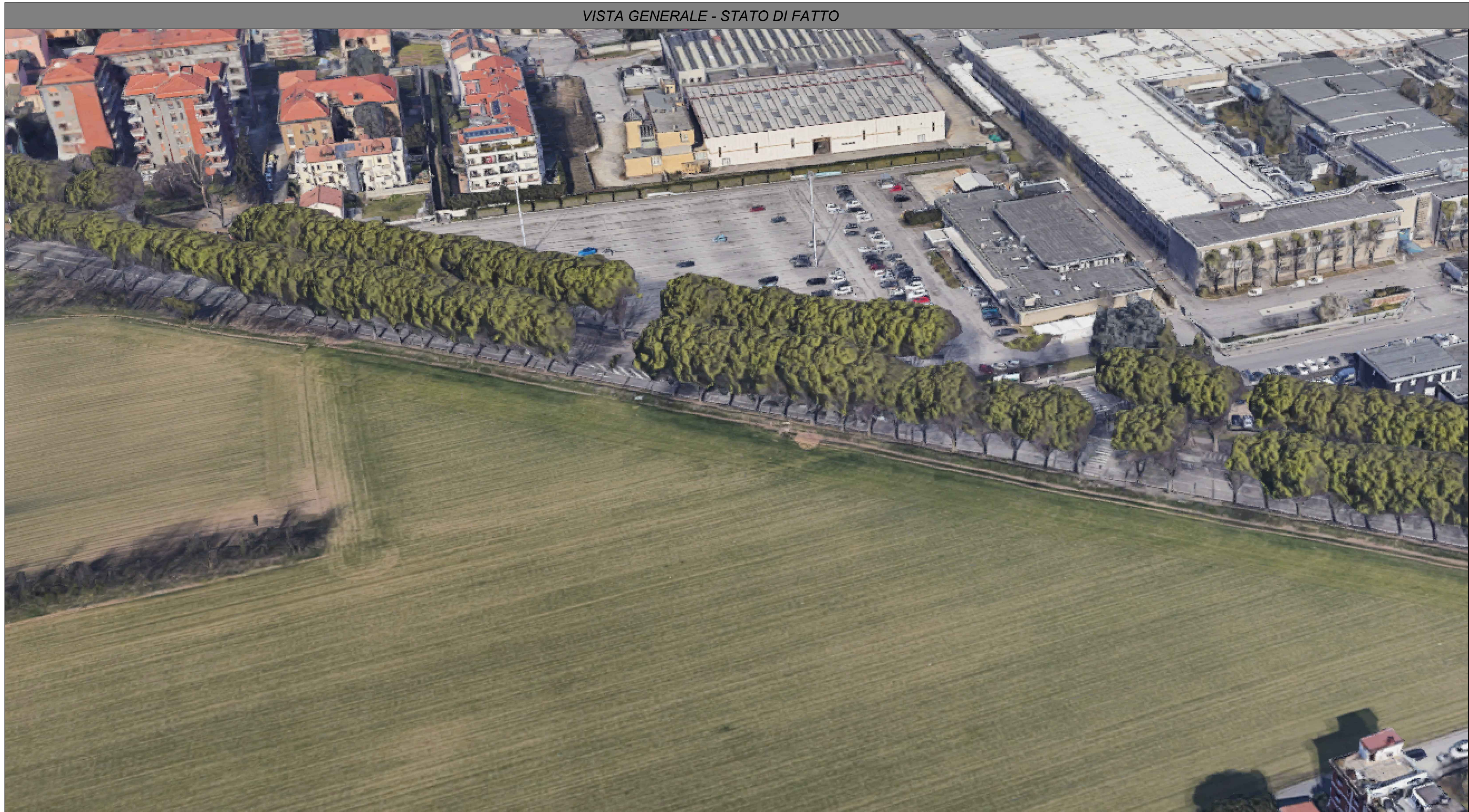
VISTA GENERALE - STATO DI FATTO