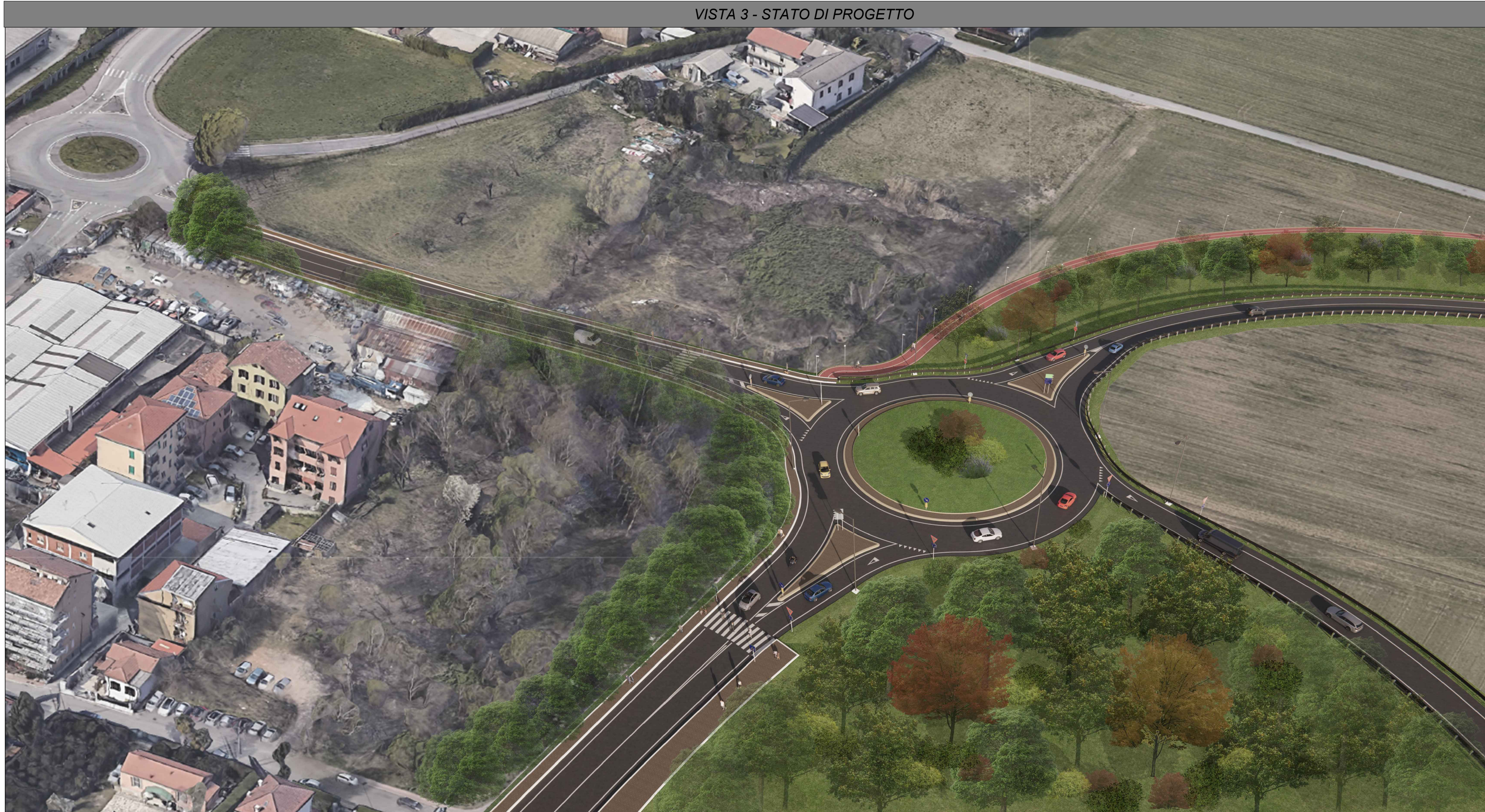
VISTA 3 - STATO DI PROGETTO