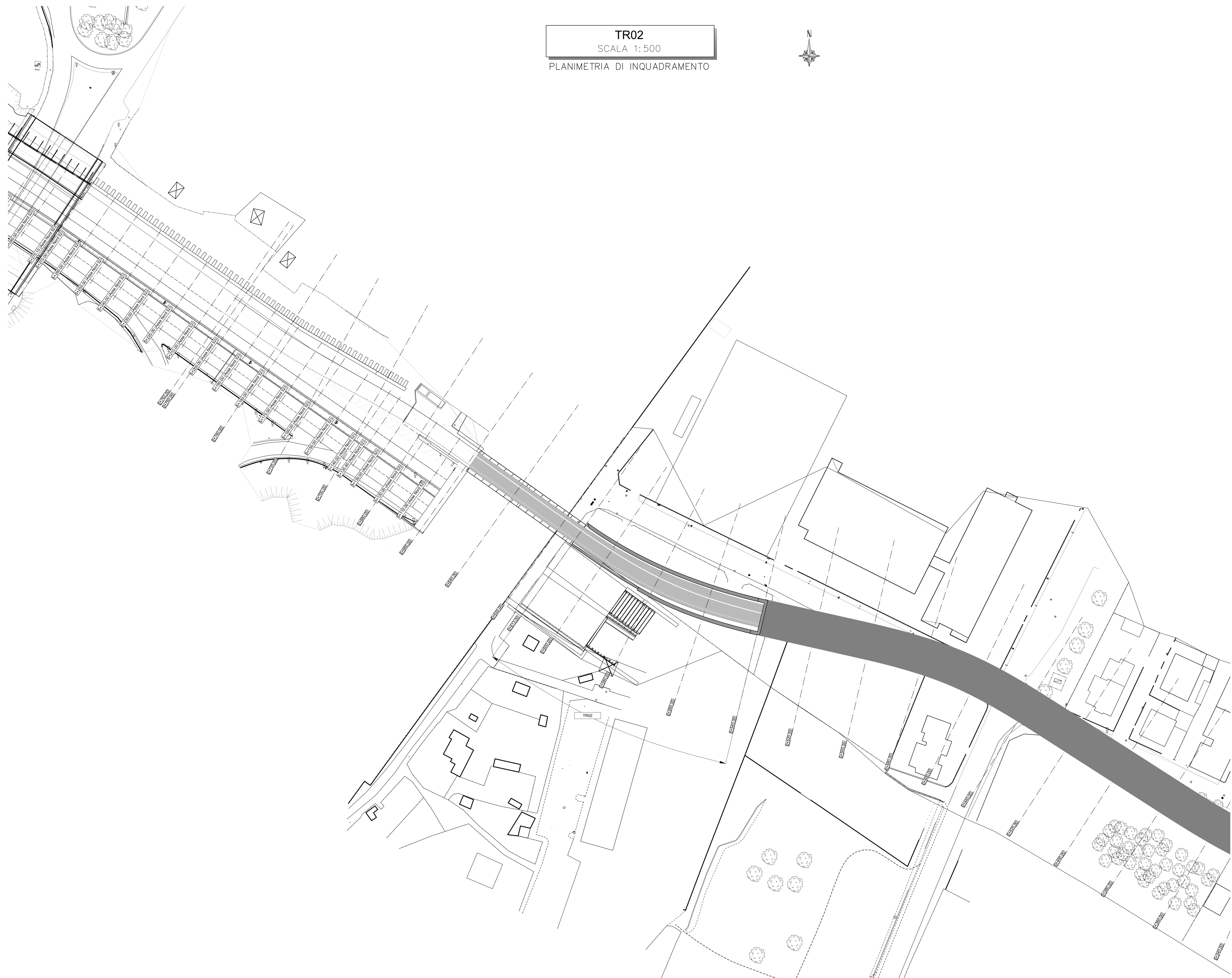
TR02 SCALA 1:500 PLANIMETRIA DI INQUADRAMENTO