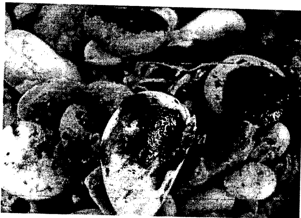
FIG. 4: Sassi lungo la spiaggia del Turchino di San Vito Marina inquinati dalla piattaforma esplorativa Ombrina Mare nel 2008. Le analisi dell'ARTA hanno successivamente confermato che si e' trattato di idrocarburi pesanti, del tutto compatibile con quanto estratto dalla piattaforma Ombrina. Non era mai successo prima."

Questi precedenti legati anche alla posizione della campo petrolifero che diffonderebbe gli idrocarburi lungo i tratti pregiatissimi della costa Iblea e Siracusana rendono assolutamente incompatibile la zona con ogni ulteriore ipotesi di sfruttamento petrolifero.