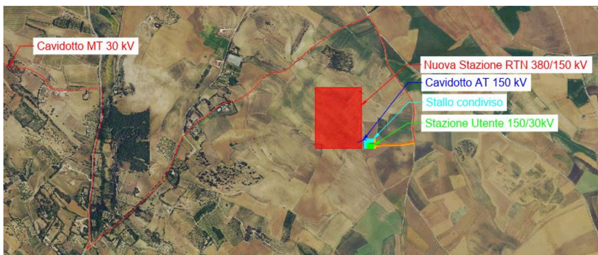
Figura 3-3 – Ubicazione opere di connessione su ortofoto

Di seguito viene illustrato il layout delle opere di connessione e delle opere di rete.