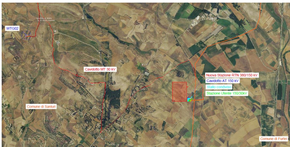
Figura 3-2 – Inquadramento generale da ortofoto – opere di connessione

La centrale di produzione, anche detta “parco eolico”, è costituita da n.7 aerogeneratori della potenza unitaria pari a 6,0 MW, interconnessi da una rete interrata di cavi MT 30 kV (in fase di realizzazione tale tensione di distribuzione potrebbe essere aumentata fino ad un massimo di 36 kV, in funzione di aspetti successivi inerenti eventuali opportunità legate alla connessione). Le opere di connessione, invece, prevedono la costruzione di una stazione elettrica di trasformazione MT/AT, anche detta “stazione utente”, di proprietà del soggetto produttore e delle infrastrutture brevemente descritte di seguito.