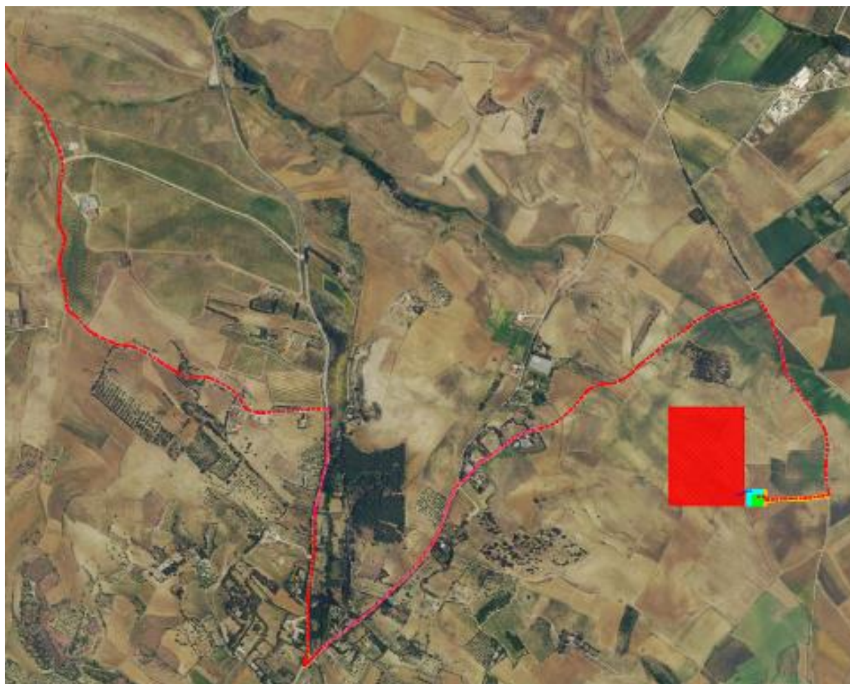
Figura 4-2 – Layout della rete MT su ortofoto – connessione alla SSE

Il percorso di dettaglio dei cavi delle dorsali è mostrato nella tavola “EOMRMD-I_Tav.23 - Planimetria del tracciato del cavidotto MT e sezioni tipo” per i dettagli grafici inerenti ai tracciati delle reti MT.