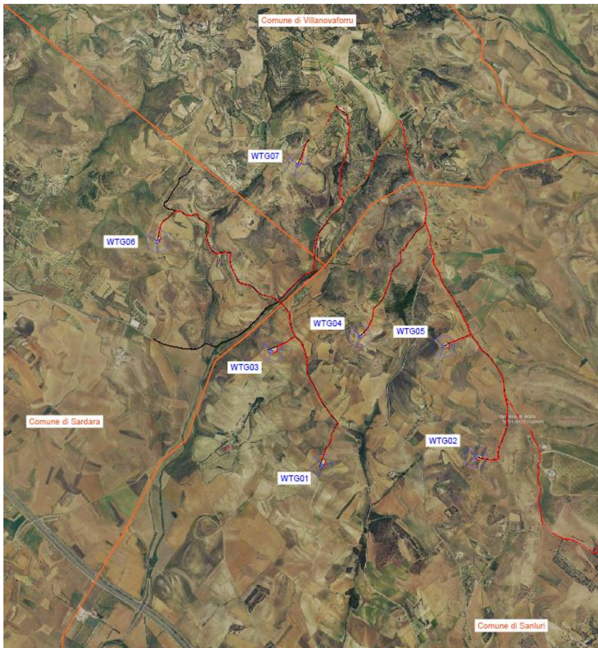
Figura 3-1 – Inquadramento generale da ortofoto – impianto eolico

Il progetto prevede la costruzione di una centrale di produzione di energia elettrica da fonte eolica nei comuni di Villanovaforru, Sardara, Sanluri e Furtei (SU) e delle opere indispensabili per la sua connessione alla RTN, nel comune di Sanluri (SU).