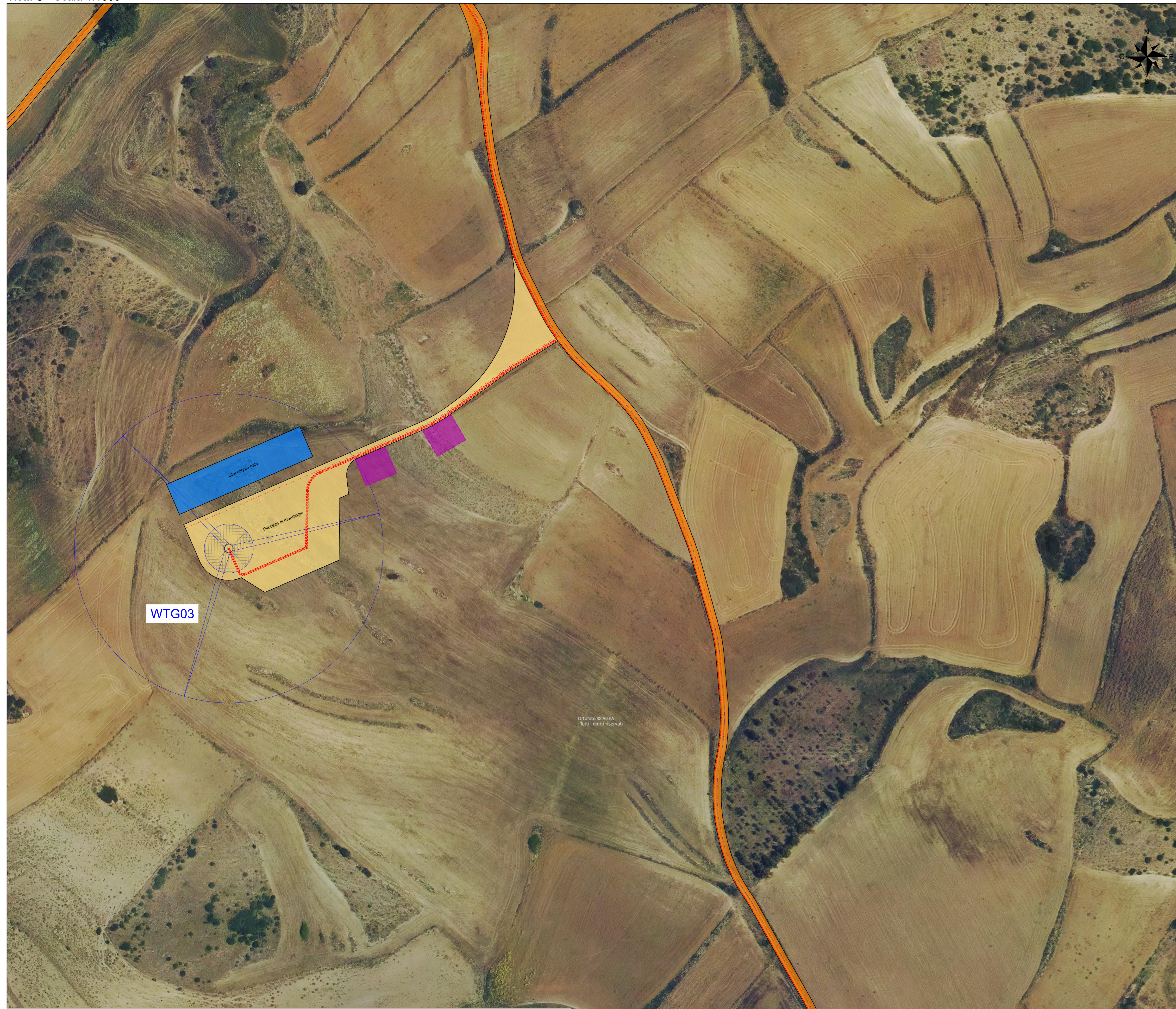
Inquadramento generale - Scala 1:25000