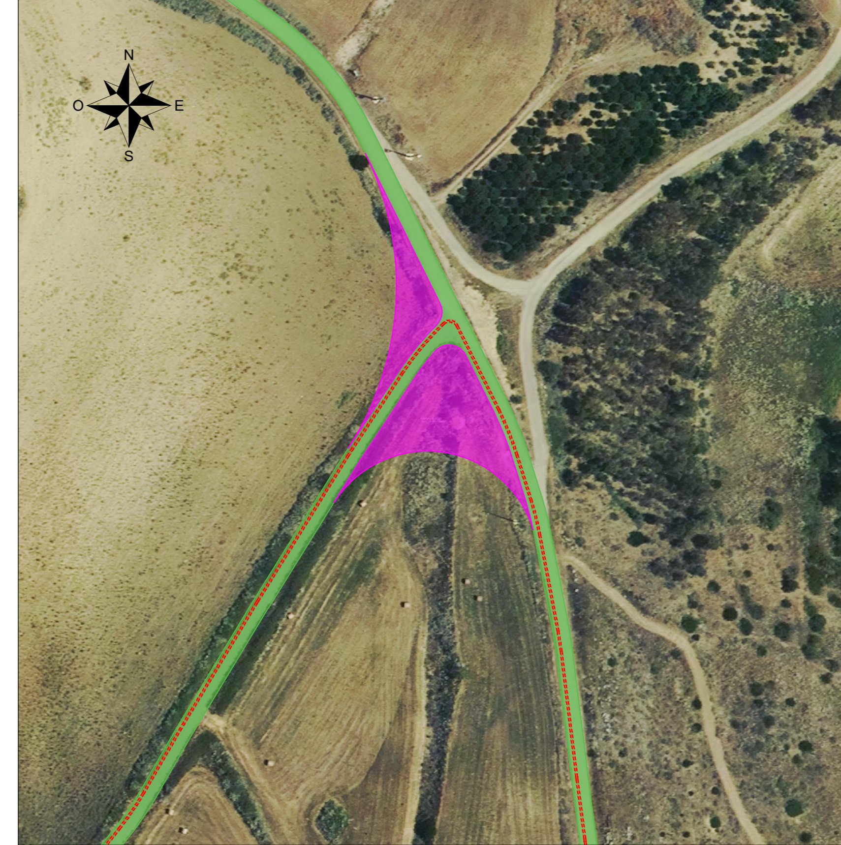
Vista H - Scala 1:1000