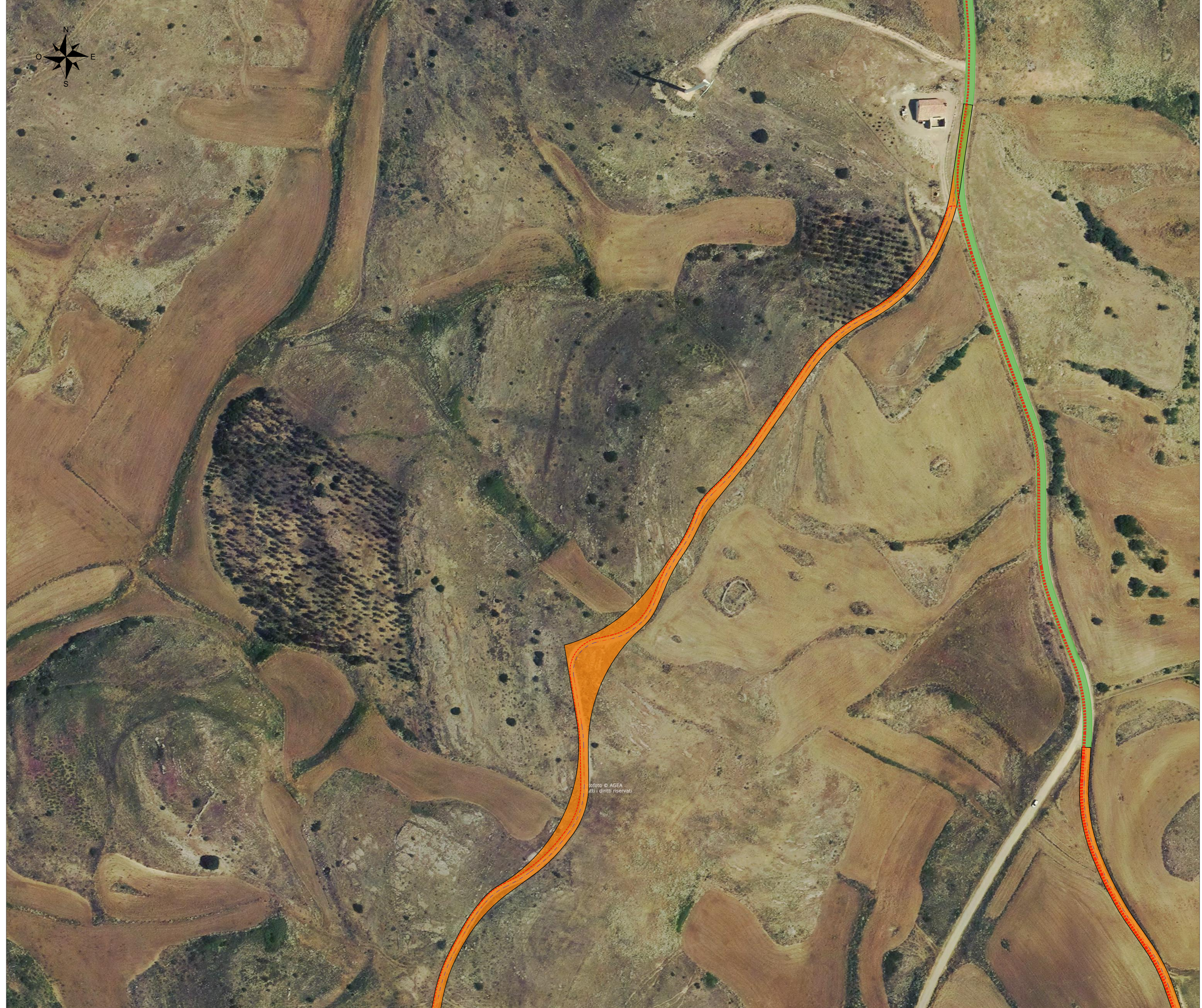
Vista I - Scala 1:1000