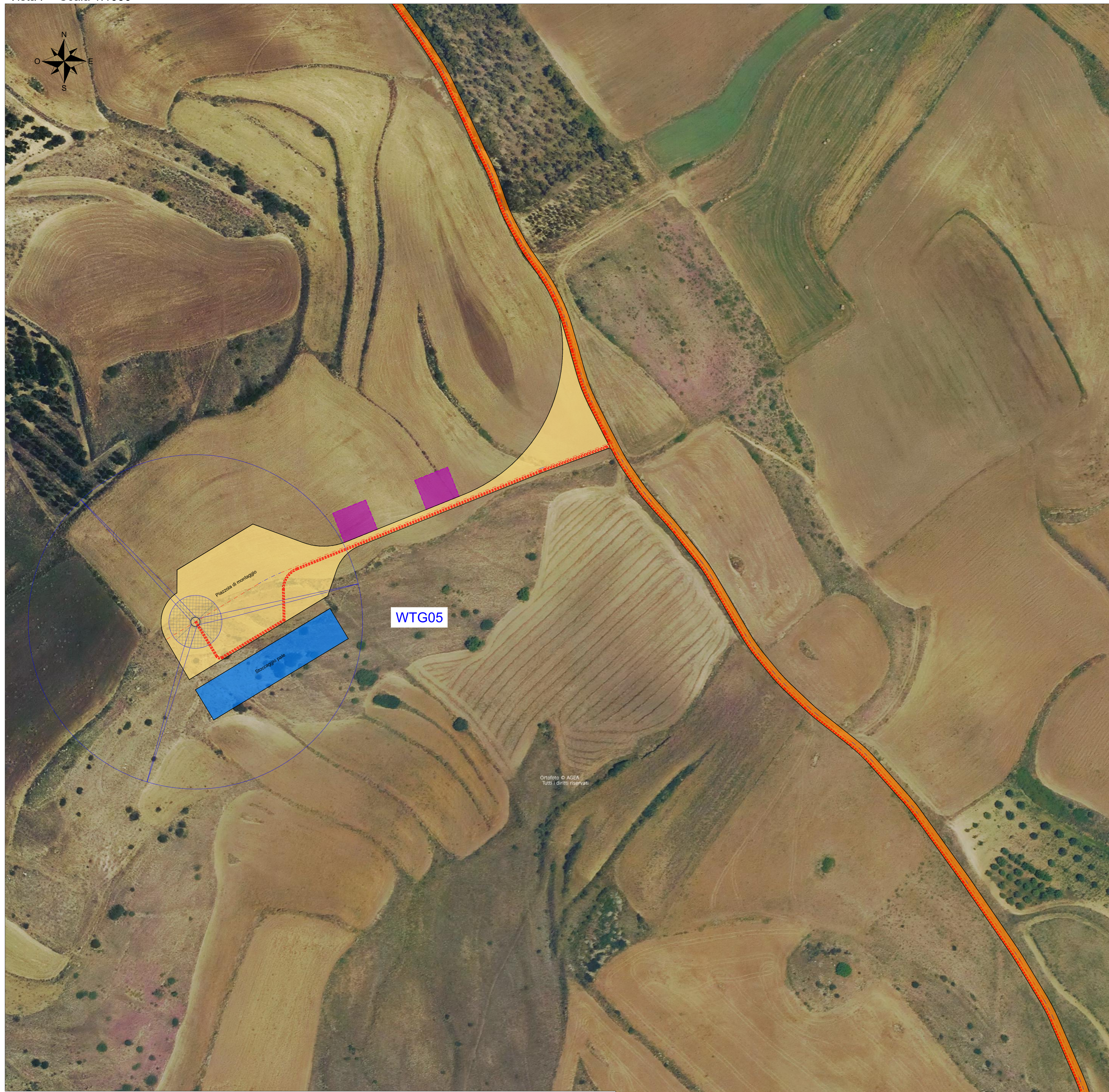
Inquadramento generale - Scala 1:25000