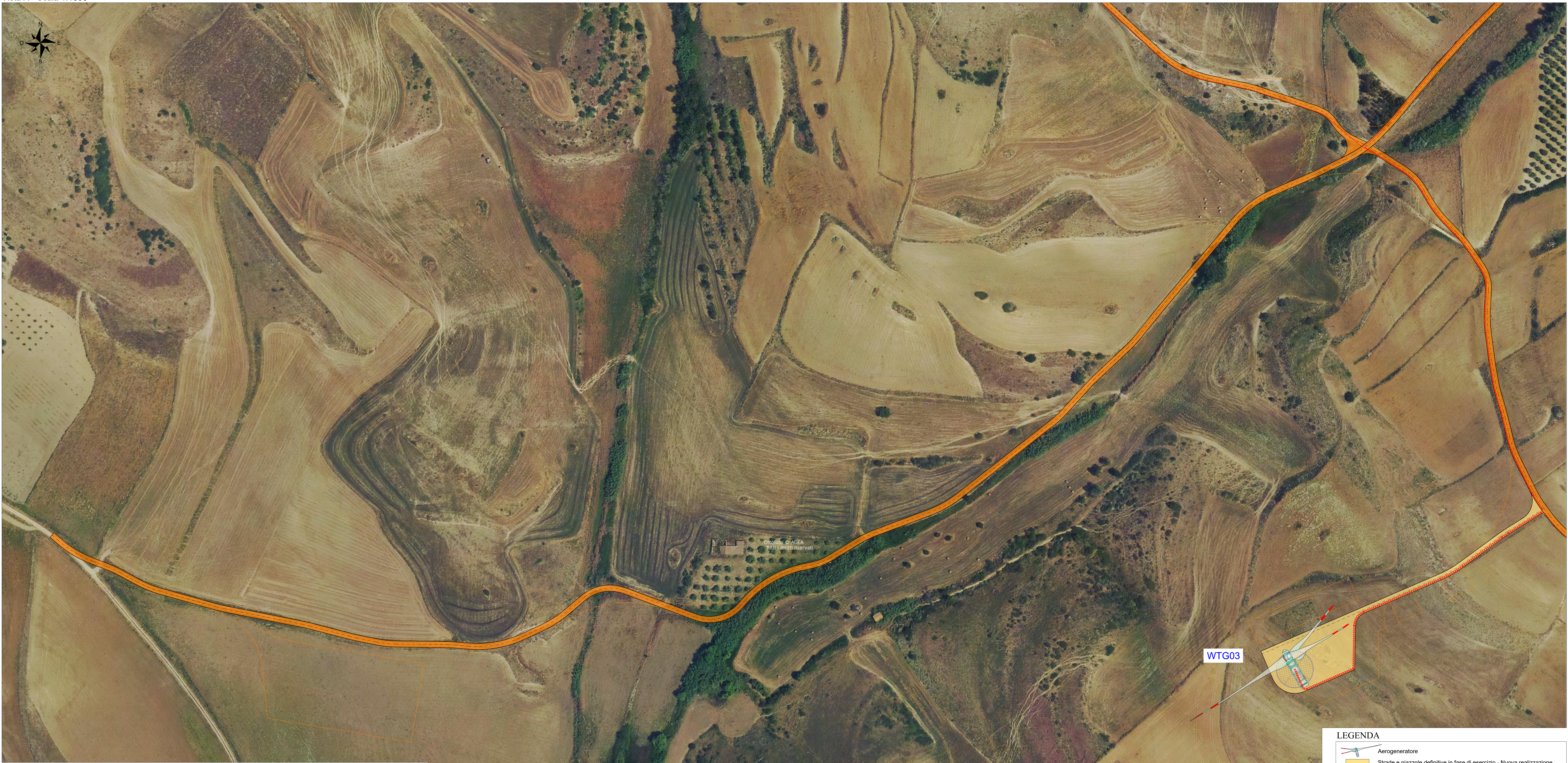
Inquadramento generale - Scala 1:25000