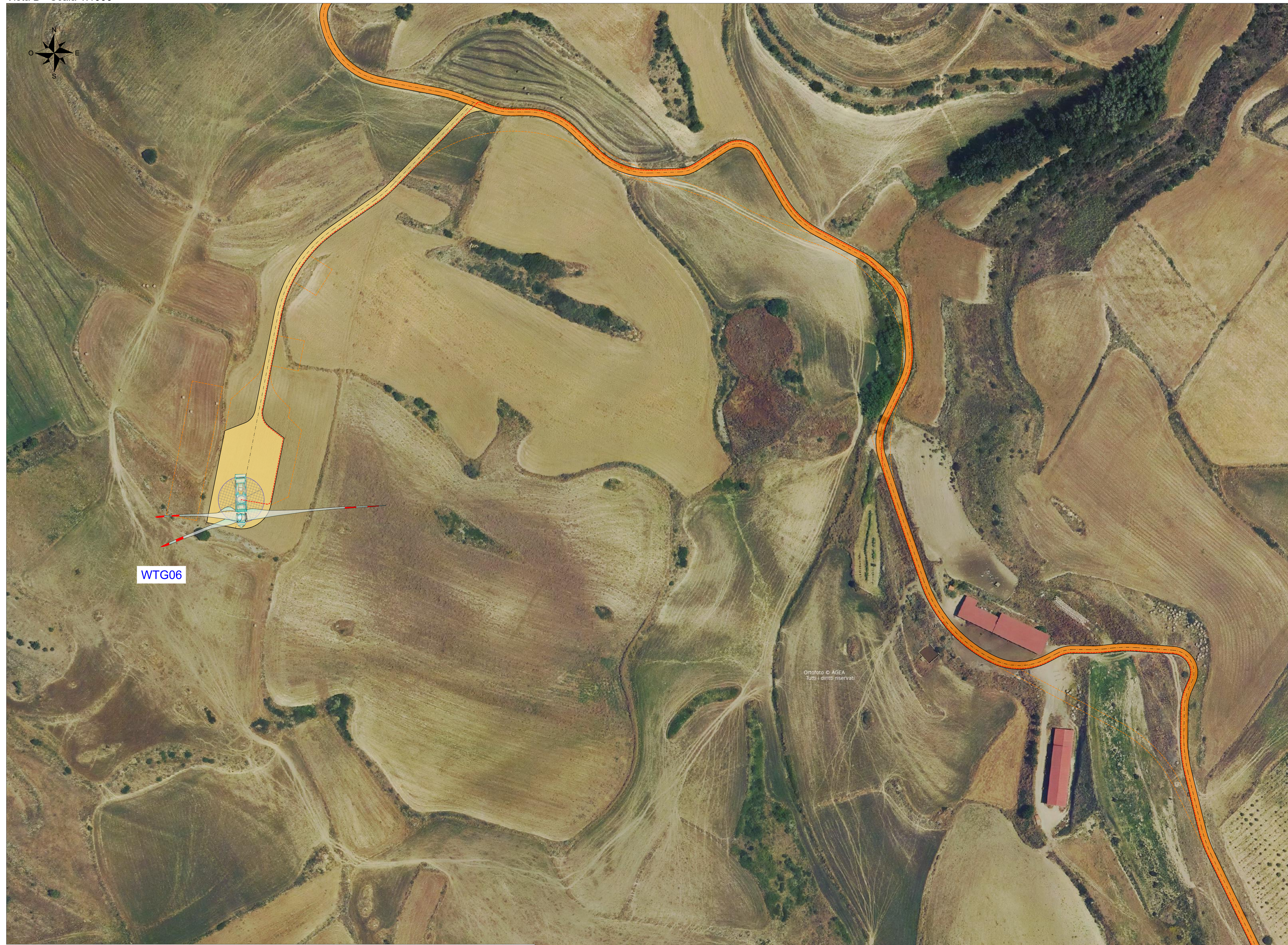
Vista B - Scala 1:1000