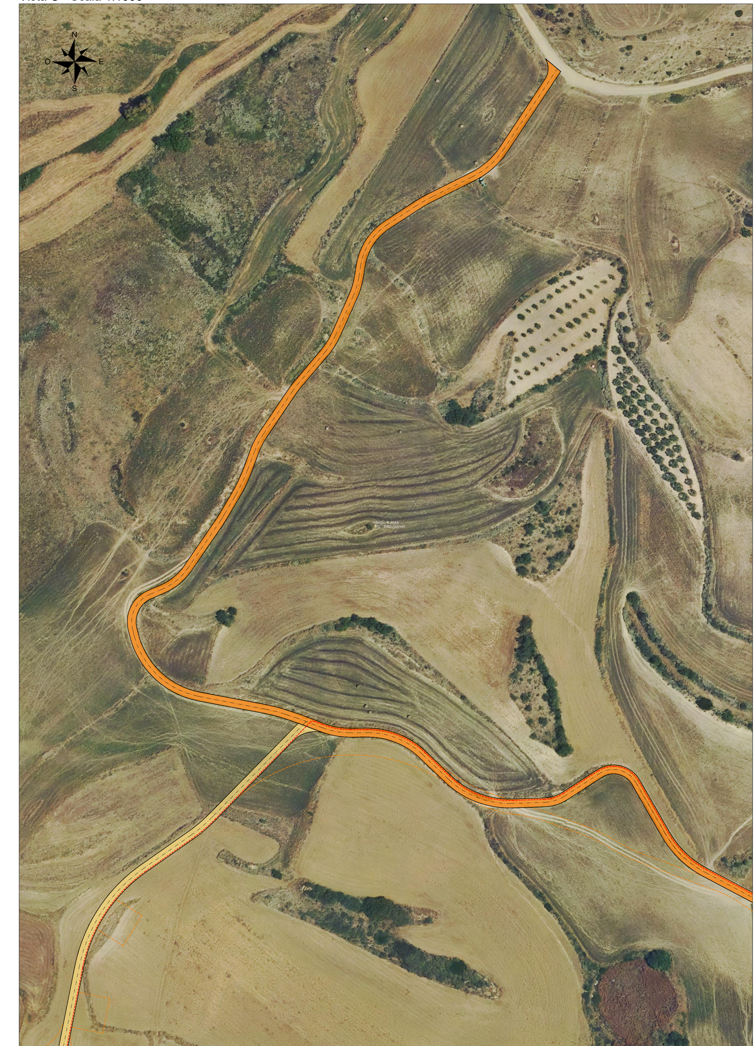
Vista C - Scala 1:1000