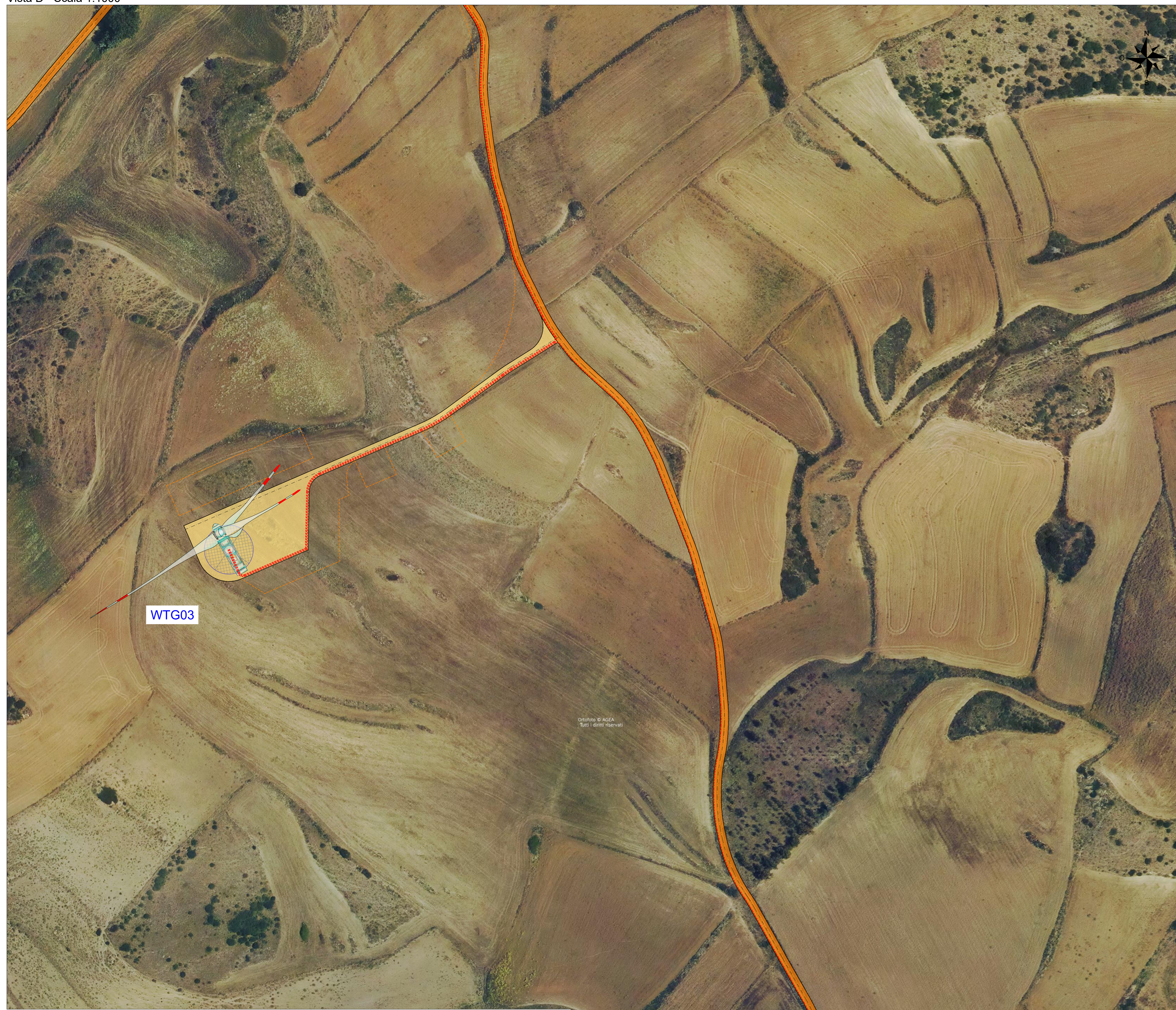
Inquadramento generale - Scala 1:25000