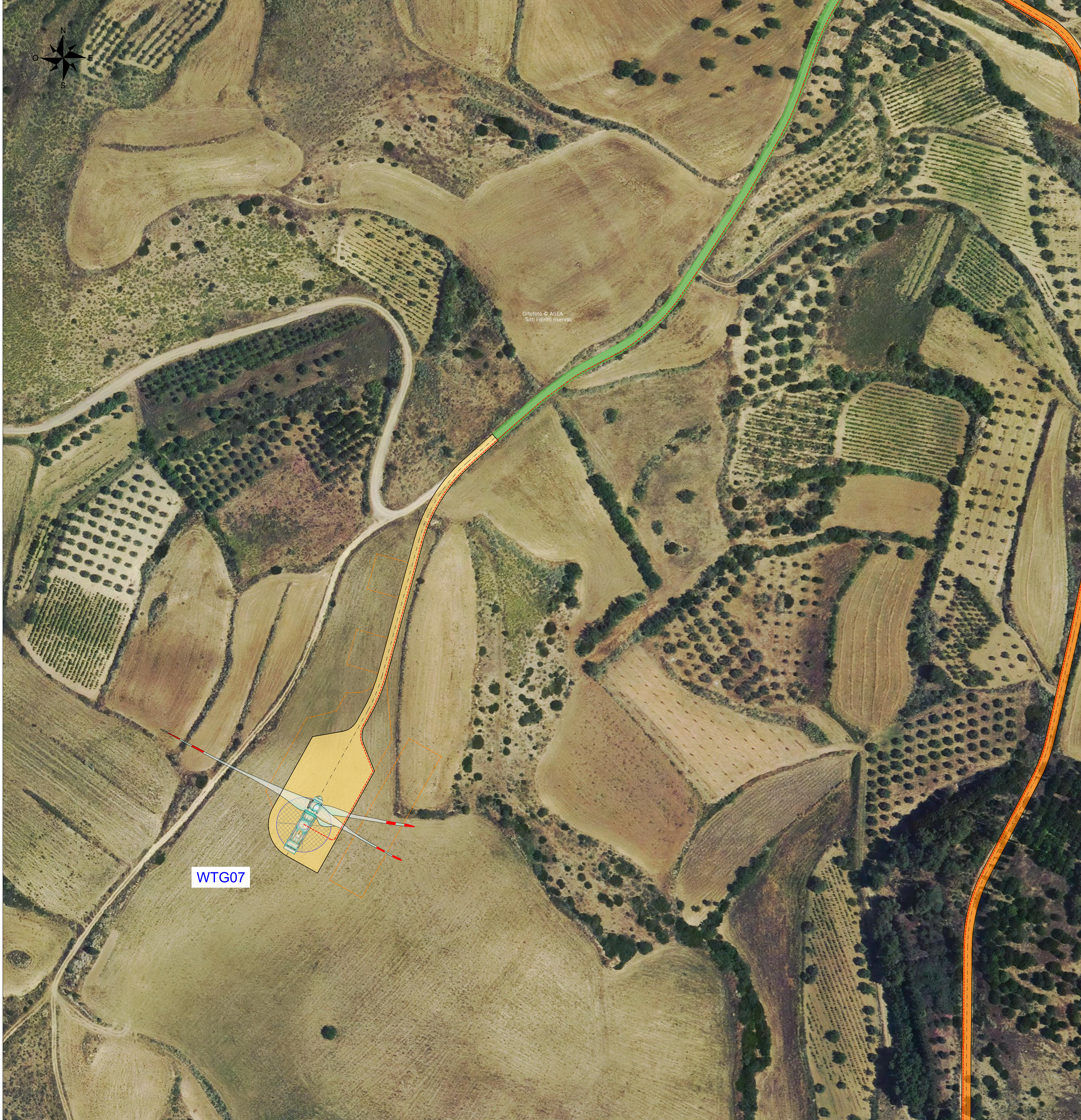
Vista H - Scala 1:1000