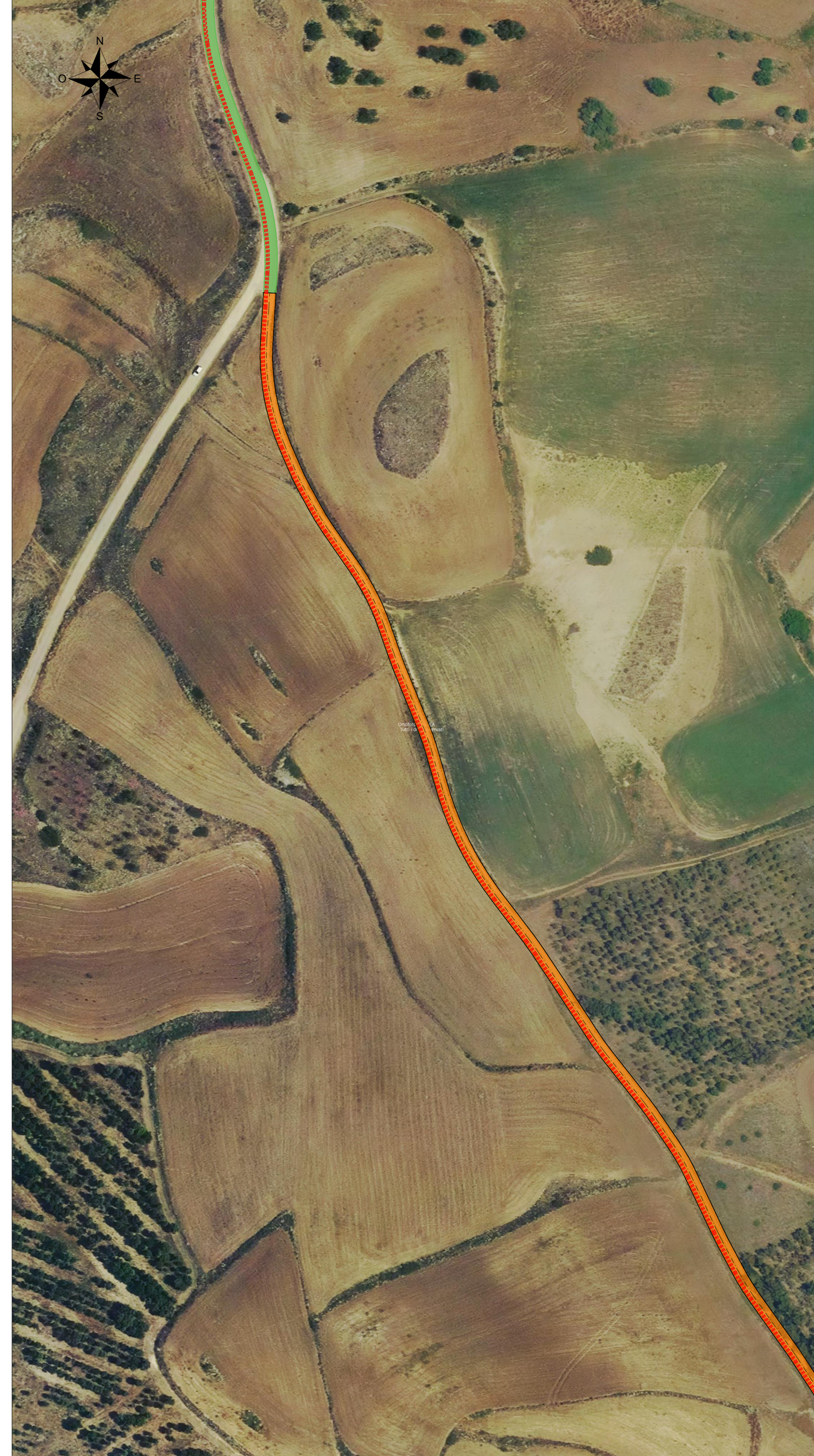
Vista M - Scala 1:1000