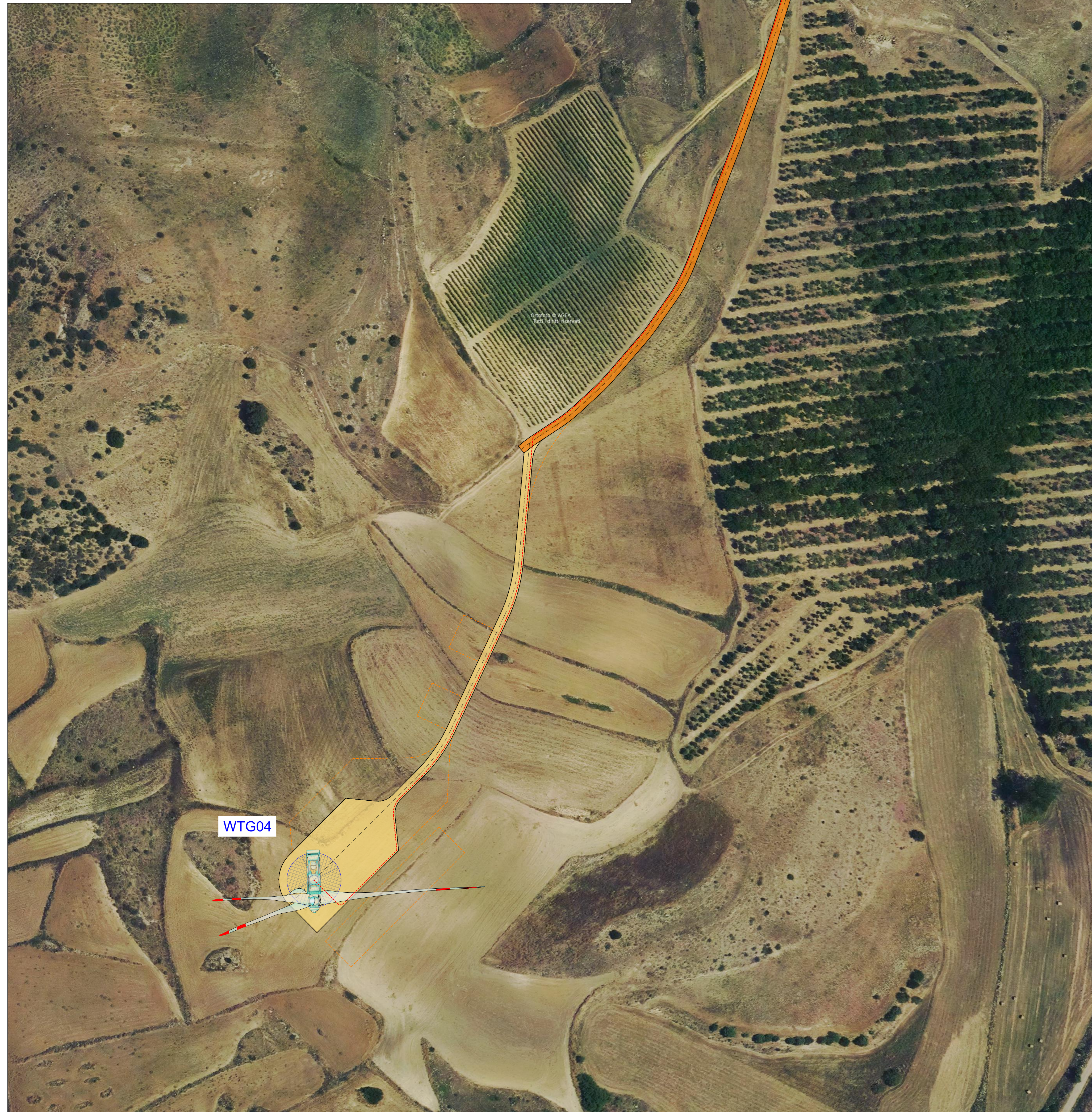
Vista O - Scala 1:1000