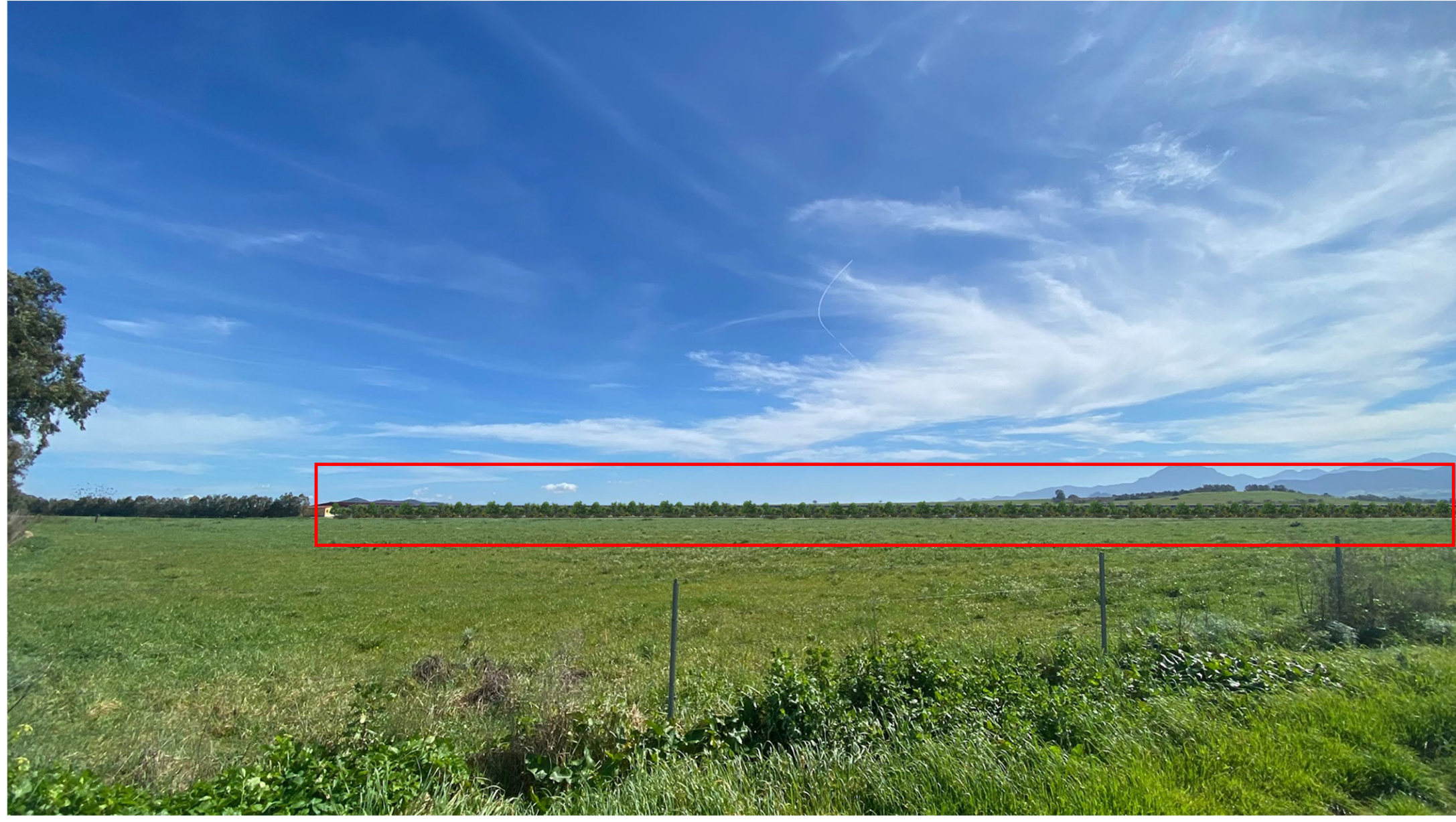
VISTA 1 - POST OPERAM (CON MITIGAZIONE)