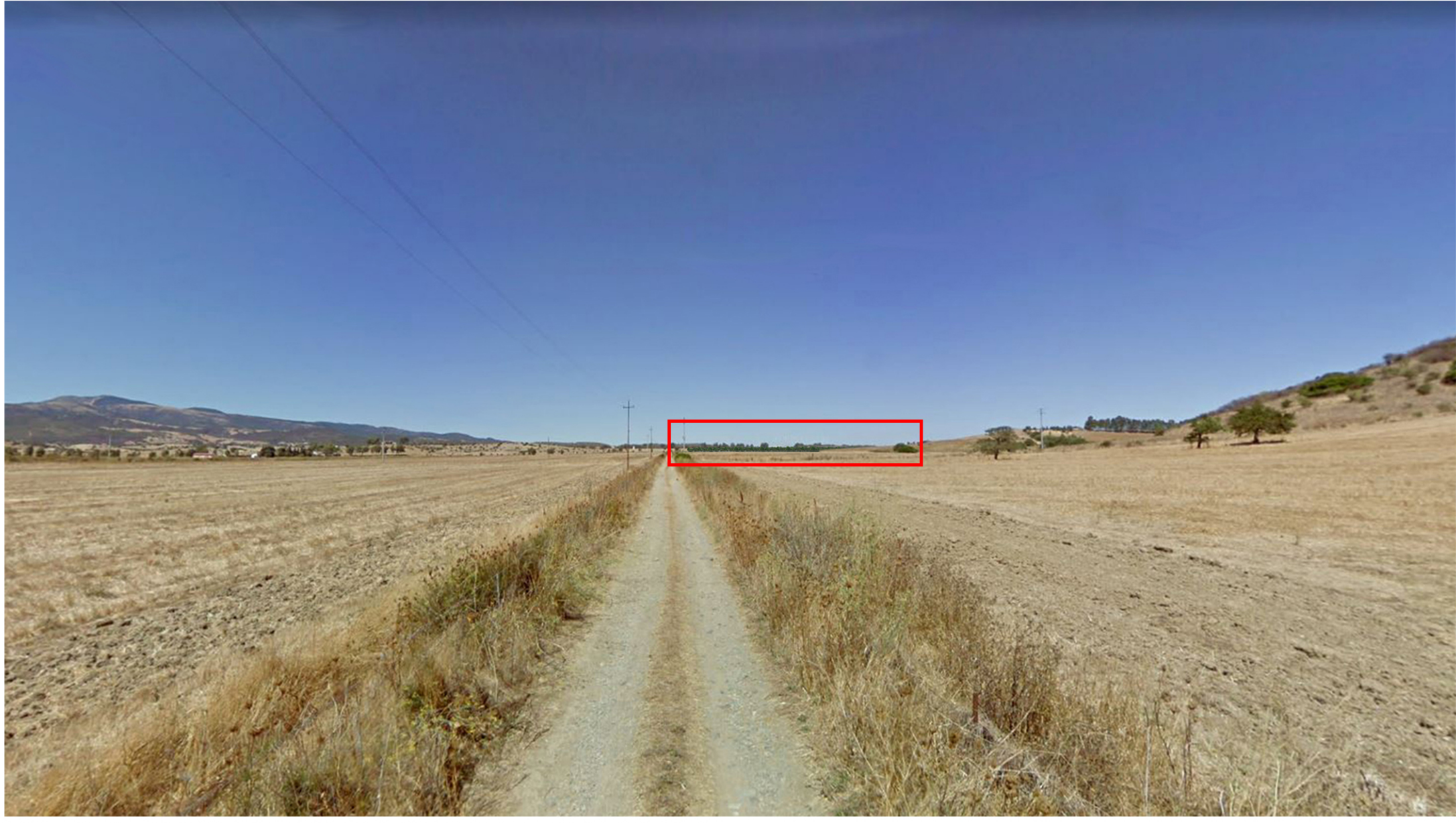
VISTA 2 - POST OPERAM (CON MITIGAZIONE)