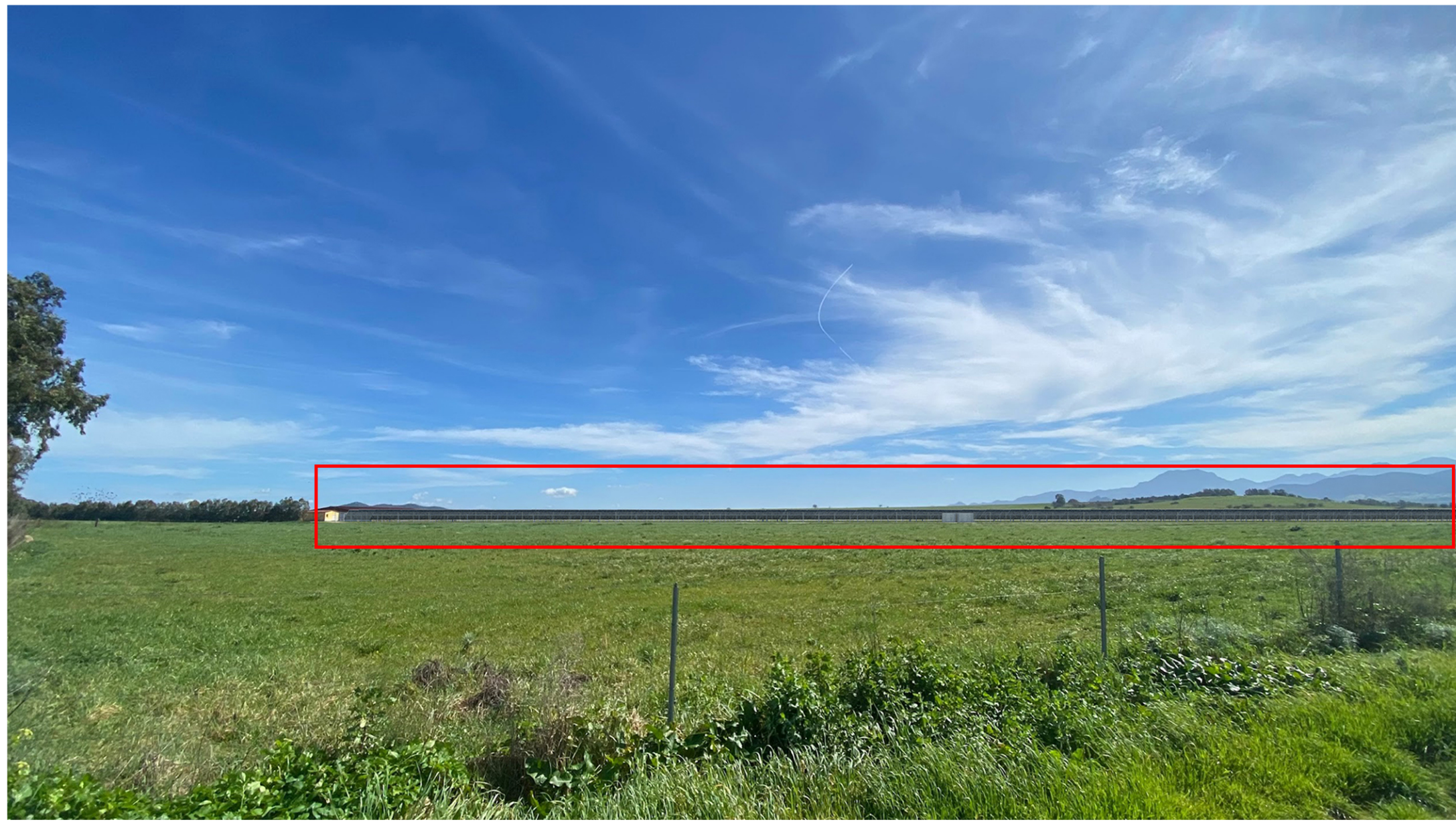
VISTA 1 - INSERIMENTO PROGETTO