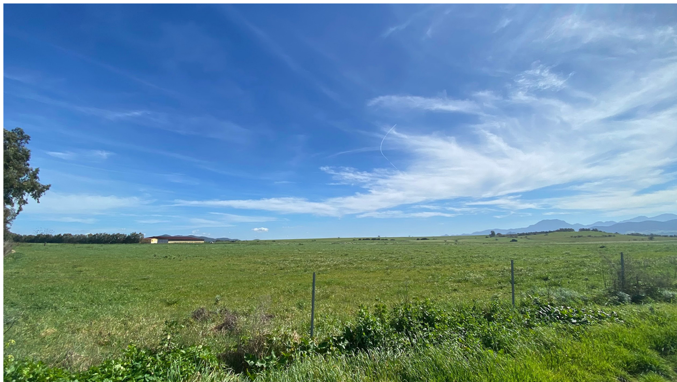
VISTA 1 - ANTE OPERAM