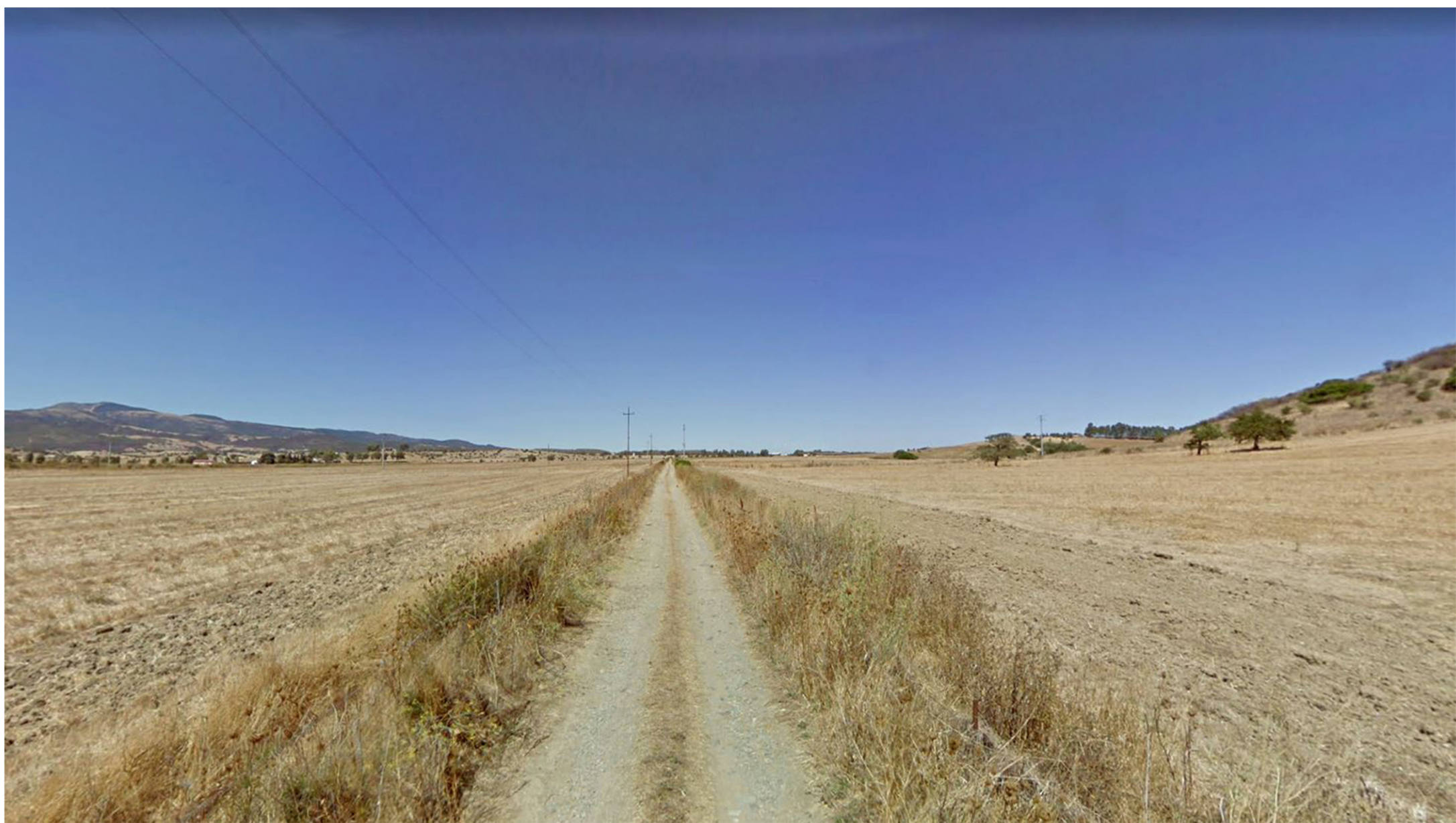
VISTA 2 - ANTE OPERAM