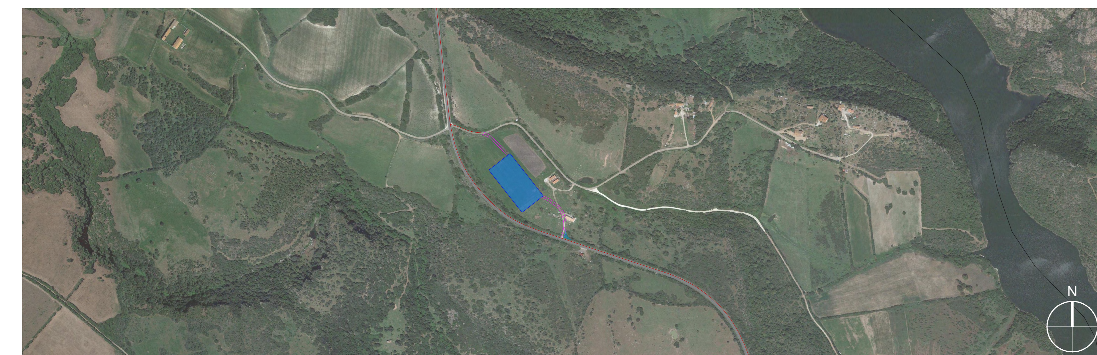
DETTAGLIO B_ DETTAGLIO PLANIMETRICO AREA DI CANTIERE_SCALA 1:5.000