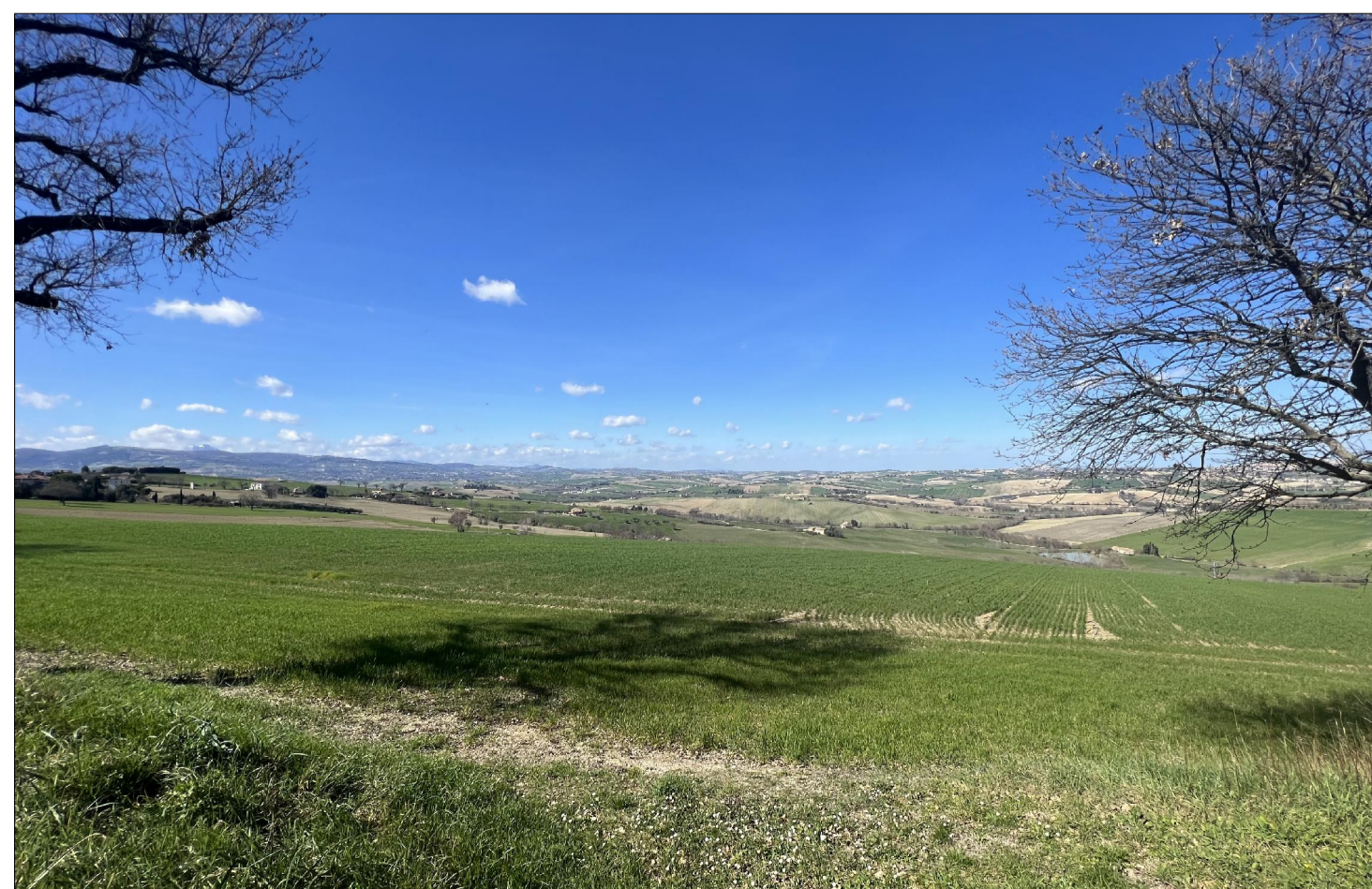
PUNTO DI VISTA 4 (senza opere di mitigazione)