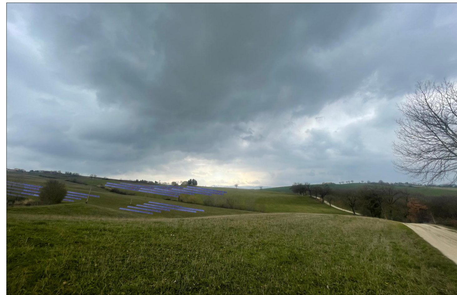
PUNTO DI VISTA 3 (senza opere di mitigazione)