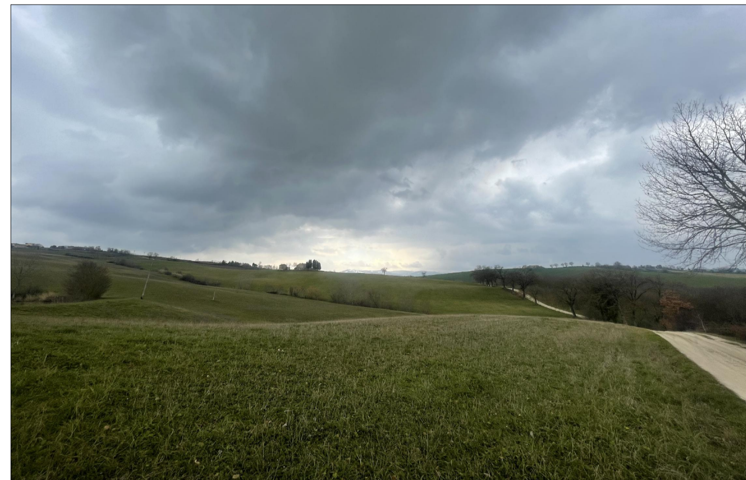
PUNTO DI VISTA 3