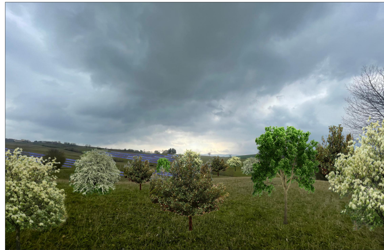
PUNTO DI VISTA 3 (con opere di mitigazione)