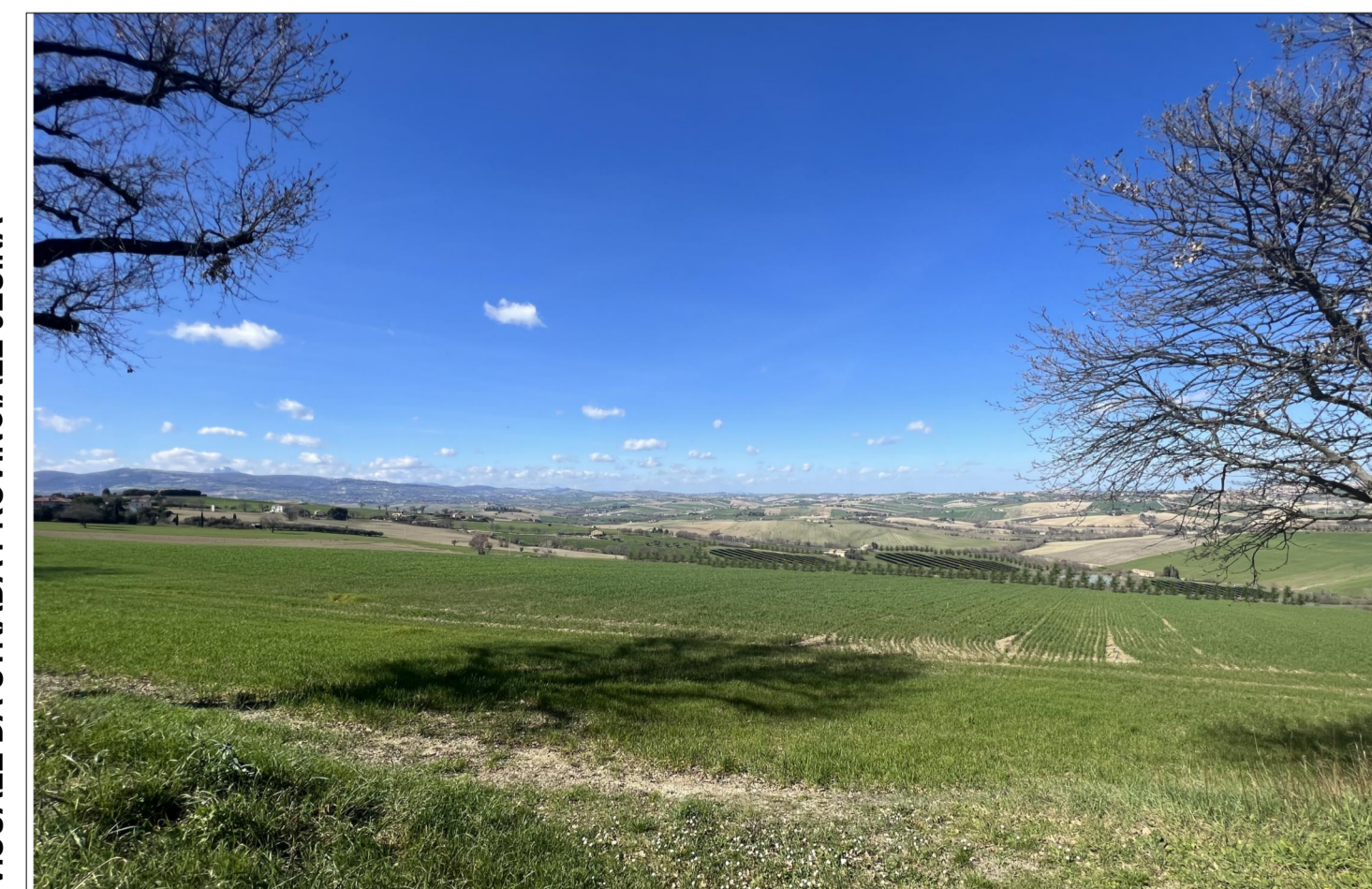
PUNTO DI VISTA 4 (con opere di mitigazione)