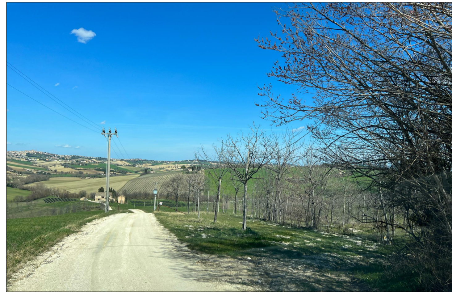
PUNTO DI VISTA 2 (senza opere di mitigazione)