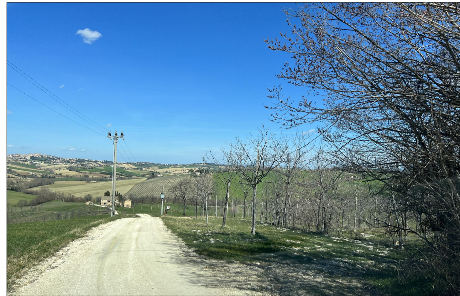
PUNTO DI VISTA 2