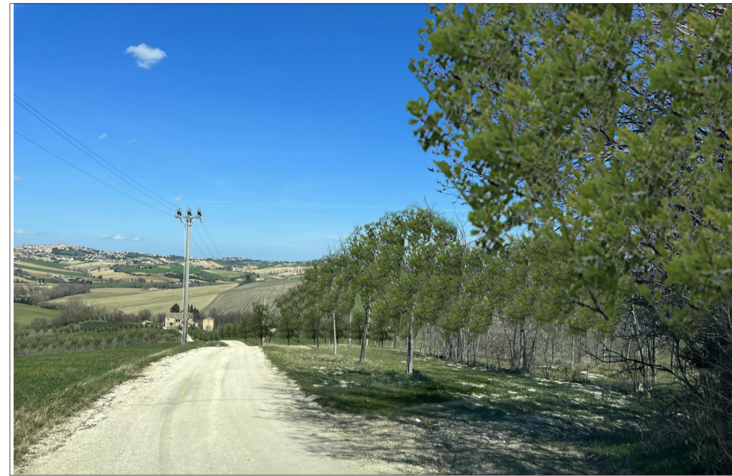
PUNTO DI VISTA 2 (con opere di mitigazione)