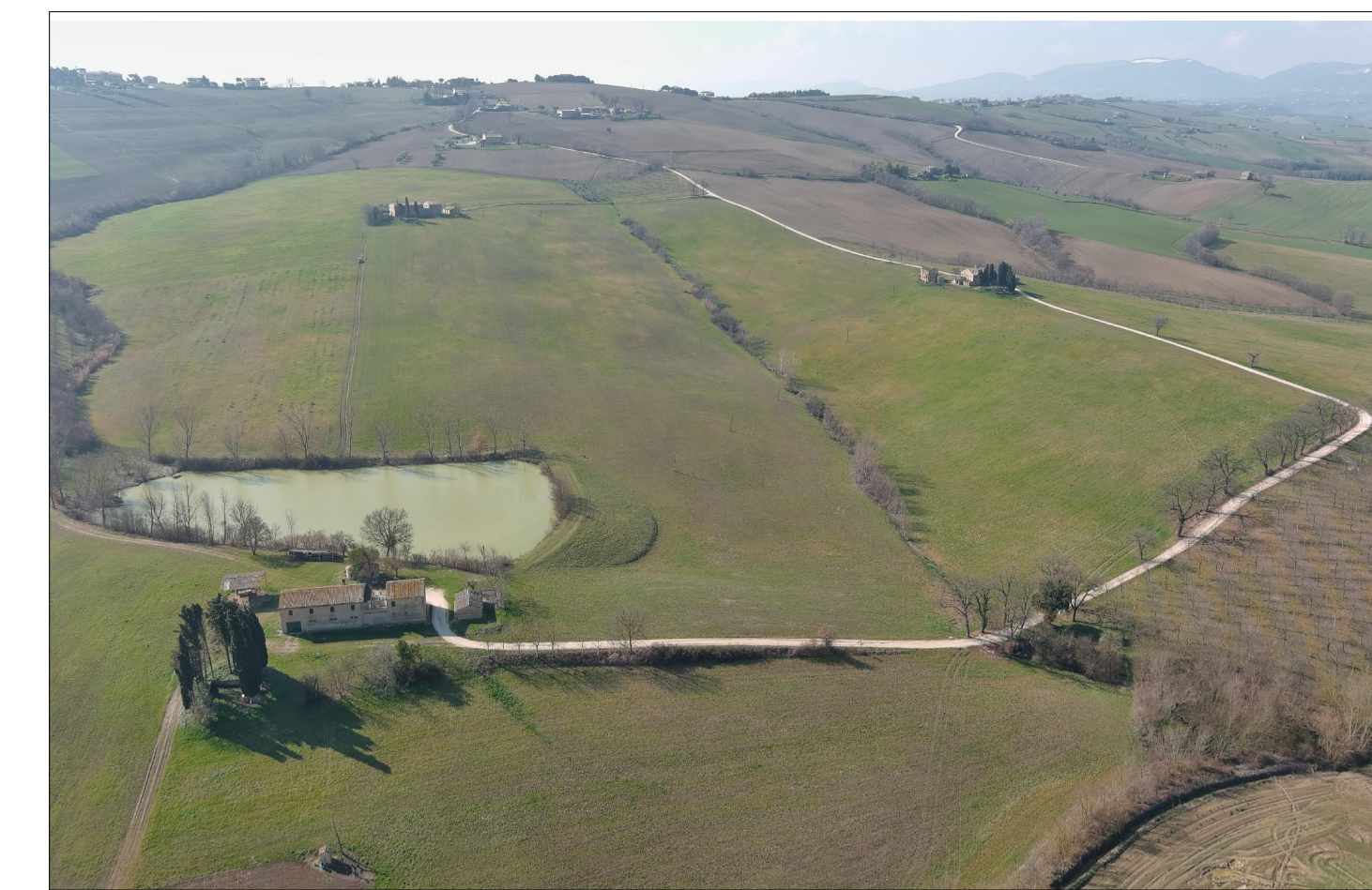
FOTO 5 - AREA DEL SITO STATO ATTUALE