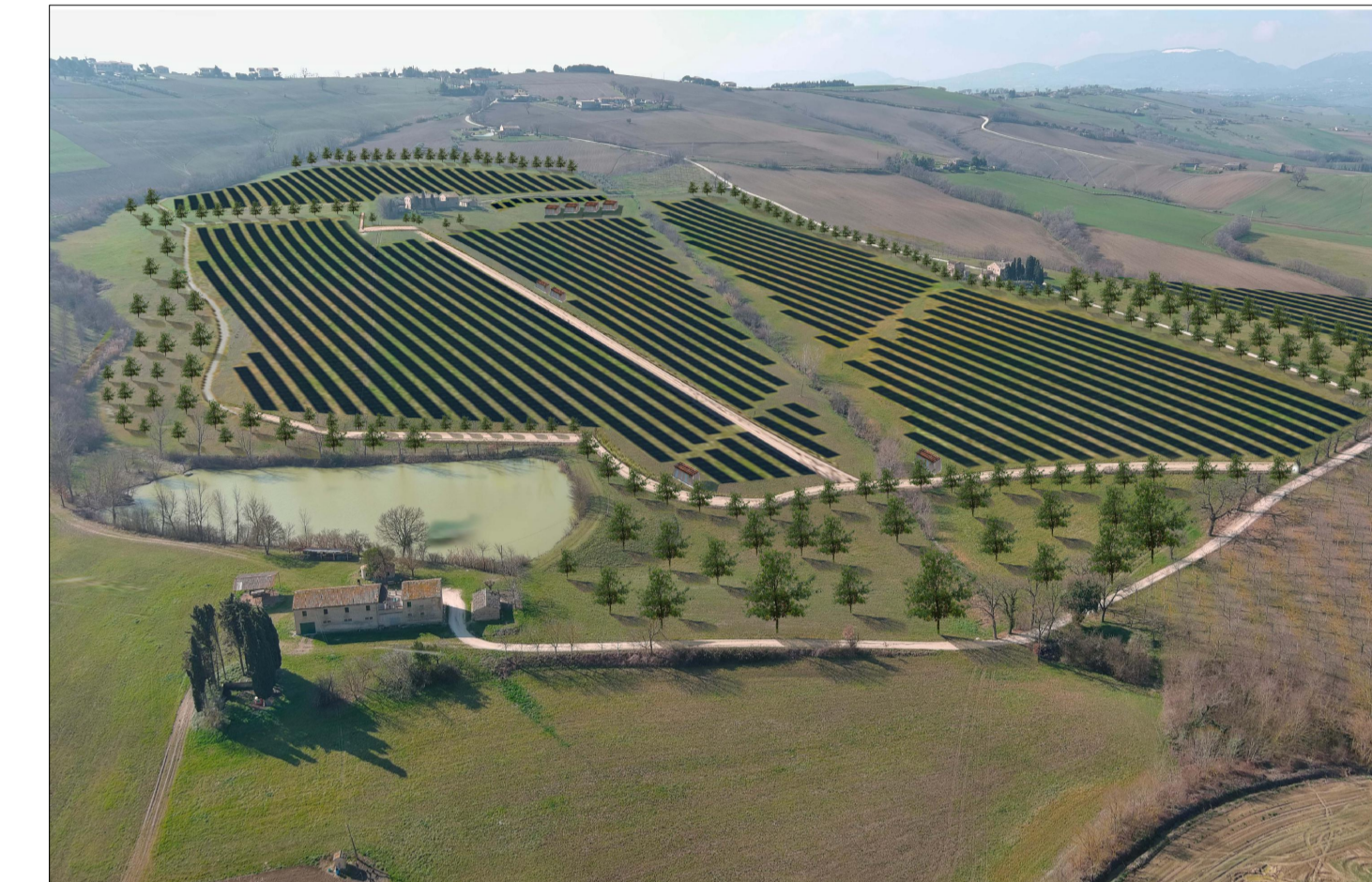
FOTO 5 - SIMULAZIONE AEREA DEL SITO STATO FUTURO