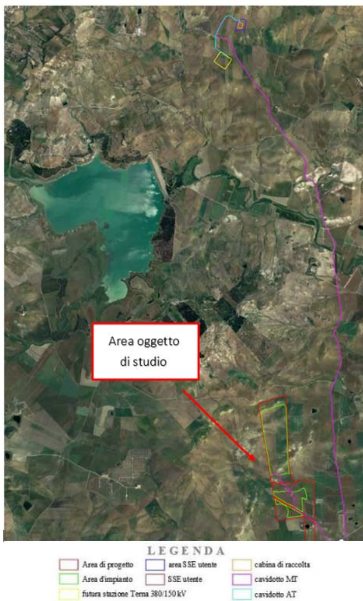
Figura 1. Inquadramento territoriale su ortofoto

L'area di progetto, la cui superficie è pari a circa 70 ha, è caratterizzata da un andamento collinare con variazioni di pendenza e da campi destinati prevalentemente a seminativo. Essa è censita all'interno del Nuovo Catasto Terreni (N.C.T.) del comune di Ramacca (CT), e ricade nei seguenti fogli catastali 129 e 130.