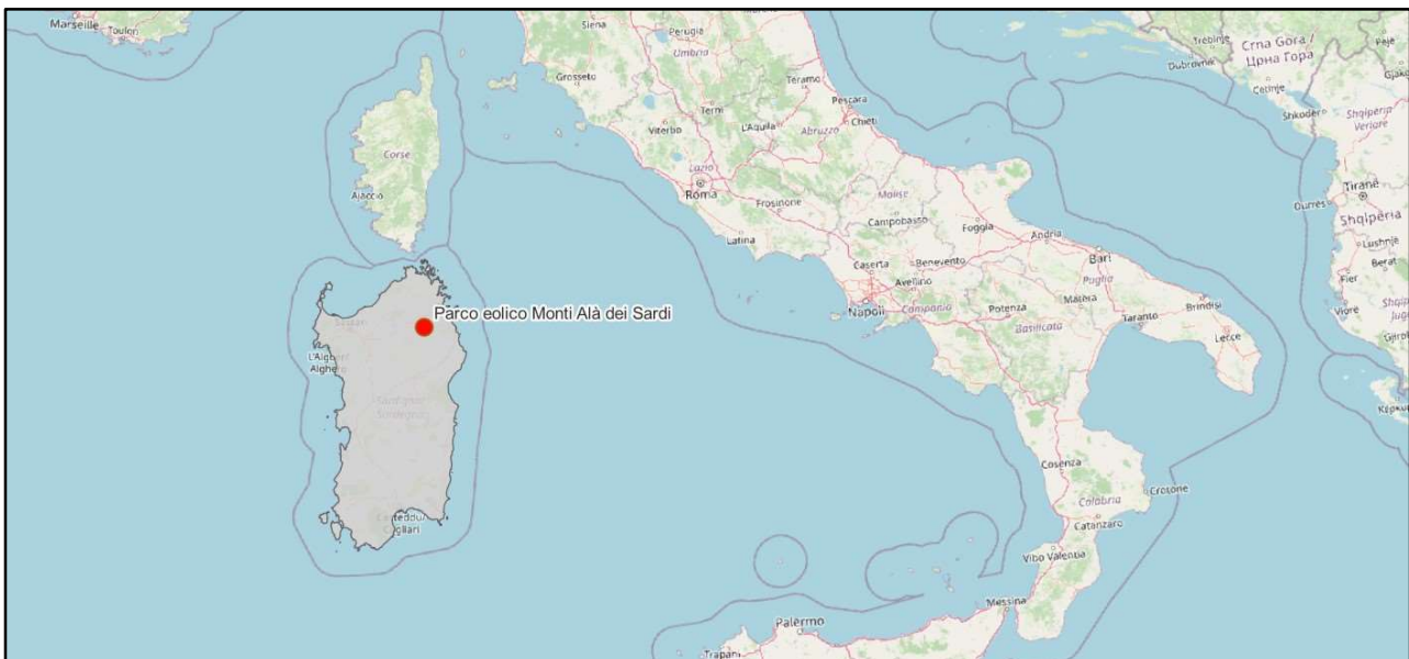
Figura 1.1: Localizzazione Parco Eolico Monti Alà dei Sardi

A tale scopo la Ge.co.D’Or. s.r.l., società italiana impegnata nello sviluppo di impianti per la produzione di energia da fonti rinnovabili con particolare focus nel settore dell’eolico e proprietaria della suddetta società, si è occupata della progettazione definitiva per la richiesta di Autorizzazione Unica (AU) alla costruzione e l’esercizio del suddetto impianto eolico e della relativa Valutazione d’Impatto Ambientale (VIA).