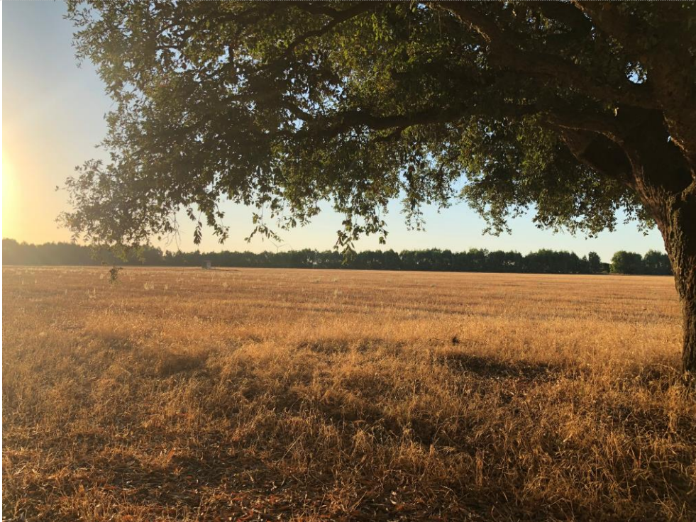
Fotografia n° 1