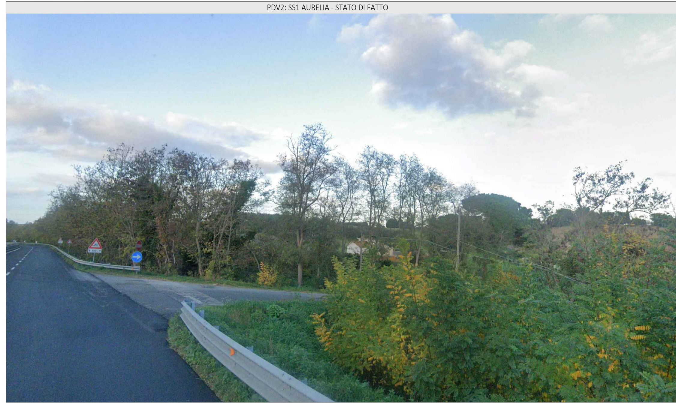
PDV2: SS1 AURELIA - STATO DI FATTO