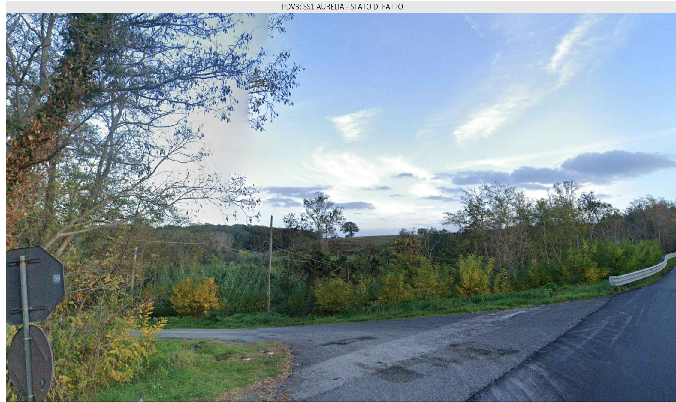
PDV3: SS1 AURELIA - STATO DI FATTO