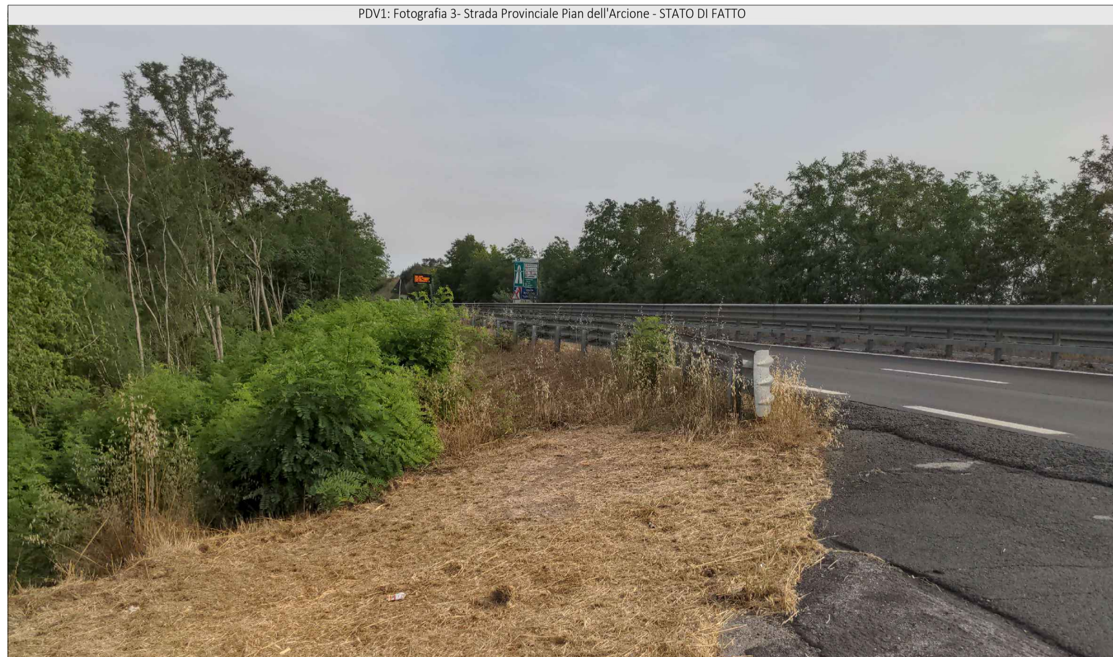
PDV1: Fotografia 3- Strada Provinciale Pian dell'Arcione - STATO DI FATTO