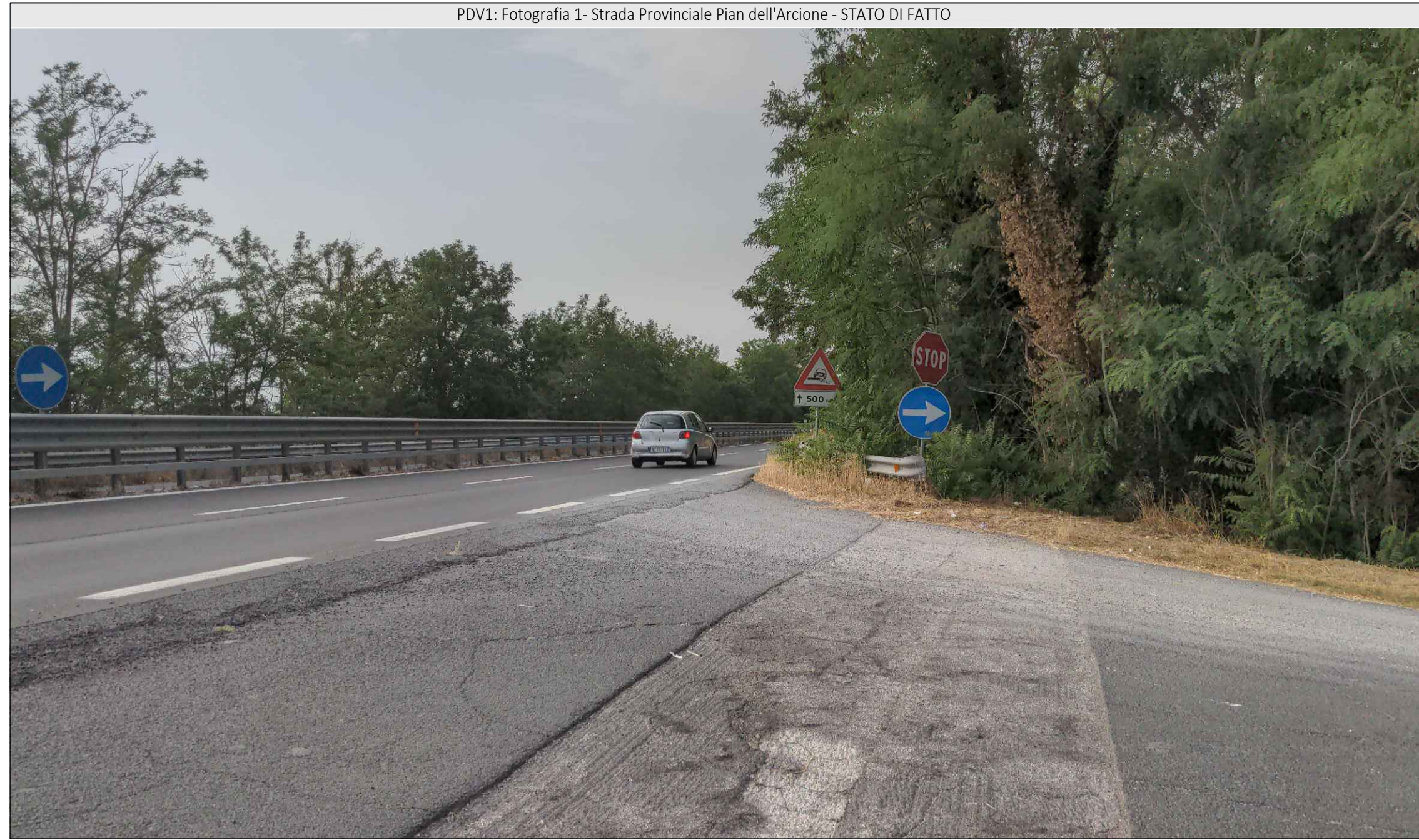
PDV1: Fotografia 1- Strada Provinciale Pian dell'Arcione - STATO DI FATTO