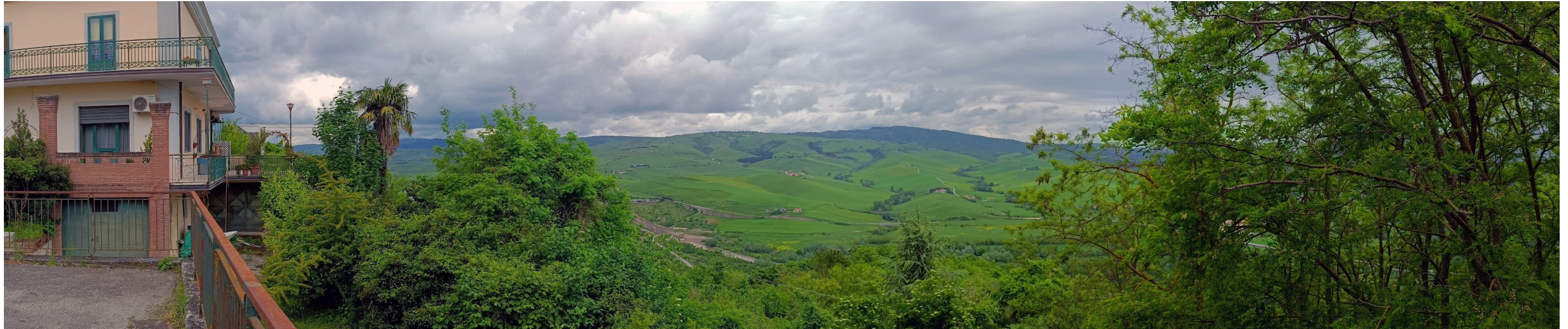
P.to panoramico presso centro storico di Conza della Campania vista verso Nord

VISTA ANTE OPERAM STATO ATTUALE (Maggio 2023)