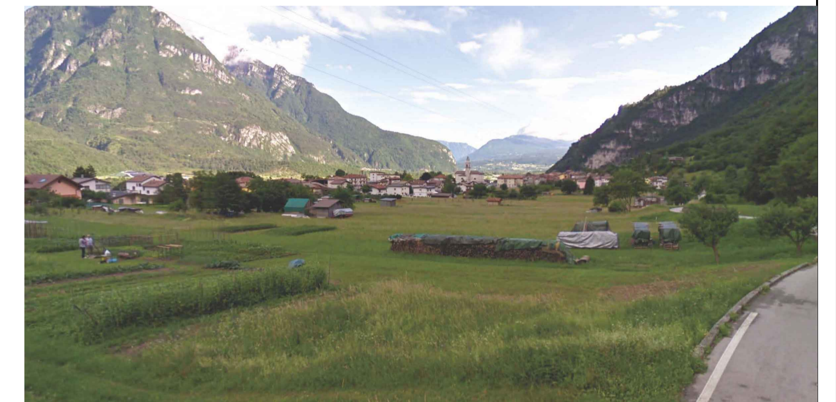
VISTA DELL'AREA DA VIA DELLA SCESURA

STATO DI FATTO: Area ubicata in Comune di Fortogna. UTILIZZO IN FASE DI CANTIERE: Area destinata ad ospitare il Campo Base denominato CB01, ubicato a inizio intervento, con accesso da Via San Martin accedendo dal parcheggio esistente. Ha una superficie pari a 18.900mq. ; Area destinata ad ospitare gli allestimenti logistici, attrezzature e lo stoccaggio dei materiali; Area principale di riferimento per i Subcantieri ubicati a Sud dell'intervento in progetto. MODALITA' DI RECUPERO AMBIENTALE: Il ripristino dovrà avvenire tramite la verifica preliminare dello stato di eventuale contaminazione del suolo e successivo risanamento dei luoghi, il ricollocamento del terreno vegetale accantonato in precedenza, la ricostituzione del reticolo idrografico minore allo scopo di favorire lo scorrimento e l'allontanamento delle acque meteoriche.