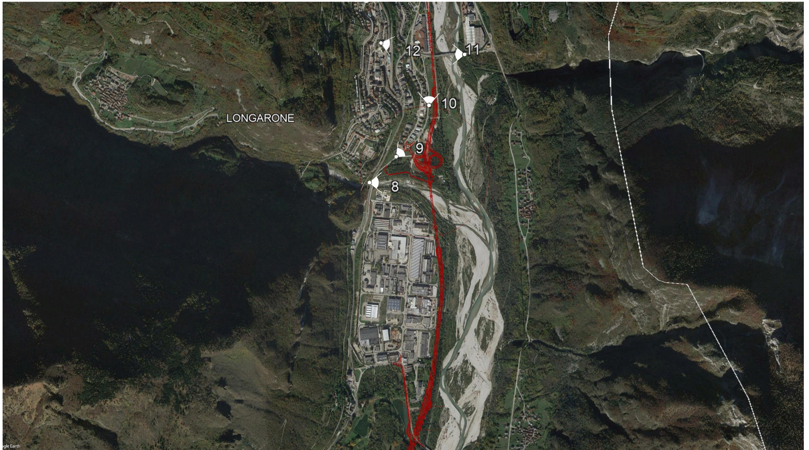
Planimetria di progetto su ortofoto nel Comune di Longarone e individuazione dei punti di ripresa fotografici nel tratto compreso tra le pk 5+600 – 8+000