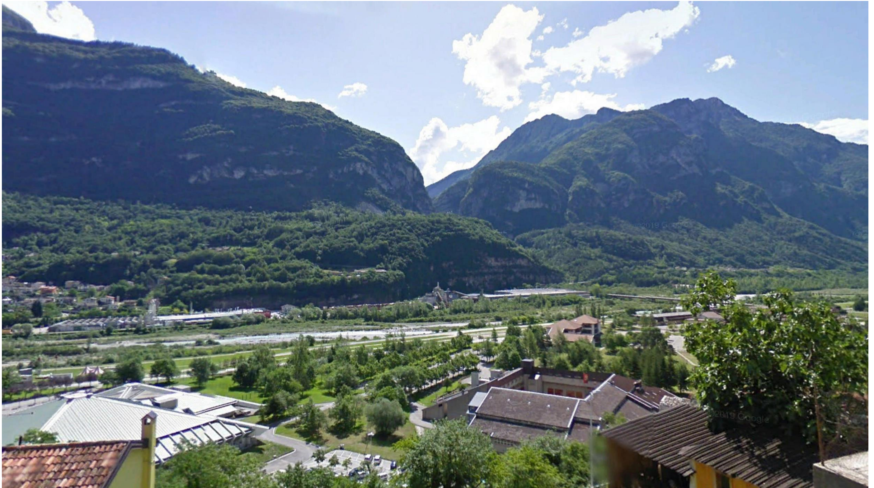
Figura 14: in corrispondenza della pk 8+300 - La vista è determinata lungo la Via dei Bagni di Lucca in direzione est. Da questo punto di vista si determinerà una visuale ampia sul tratto di intervento, compreso tra la chilometrica 8+000 e 8+500, che si sviluppa in rilevato.