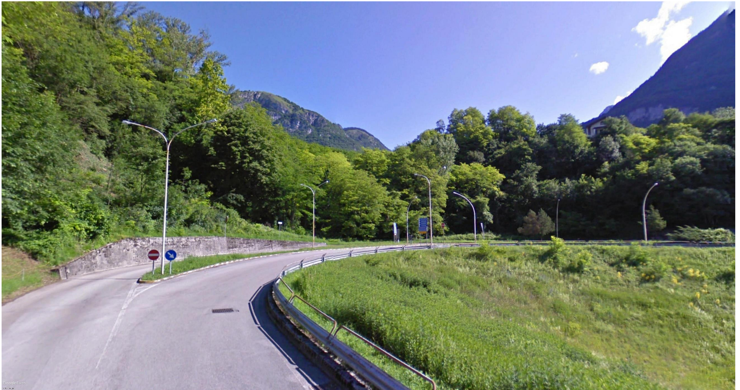
Figura 18: pk:9+240 - La visuale è determinata da Via Malcom in direzione Nord. Da tale punto di vista si avrà una visuale ravvicinata della rotatoria Malcom (ROT_04) e dell'imbocco della galleria, che si svilupperà per circa 1,5 km.