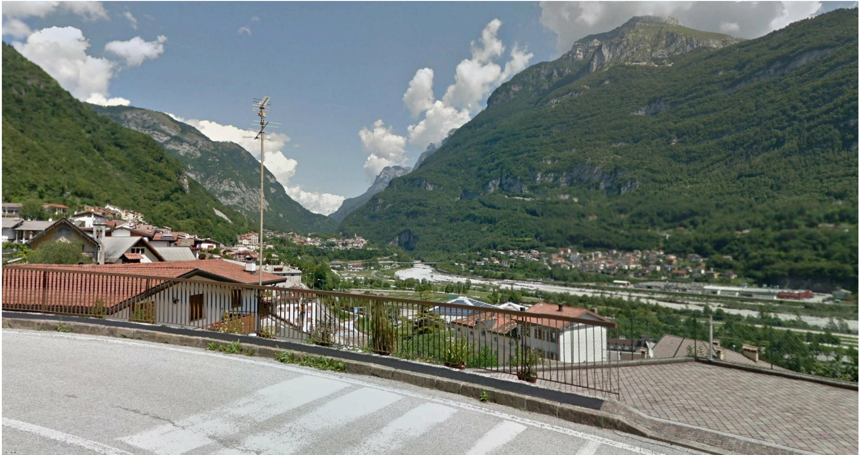
Figura 13: in corrispondenza della pk 8+150 - La vista è determinata lungo la Via Alessandro Manzoni in direzione NEE. Dal punto di osservazione si determinerà una visuale ampia del tratto di progetto compreso tra le chilometriche 8+500 e 9+300. Nella foto è riconoscibile in primo piano l'abitato di Longarone e sullo sfondo la frazione di Castellavazzo mentre sulla destra la frazione di Codissago.