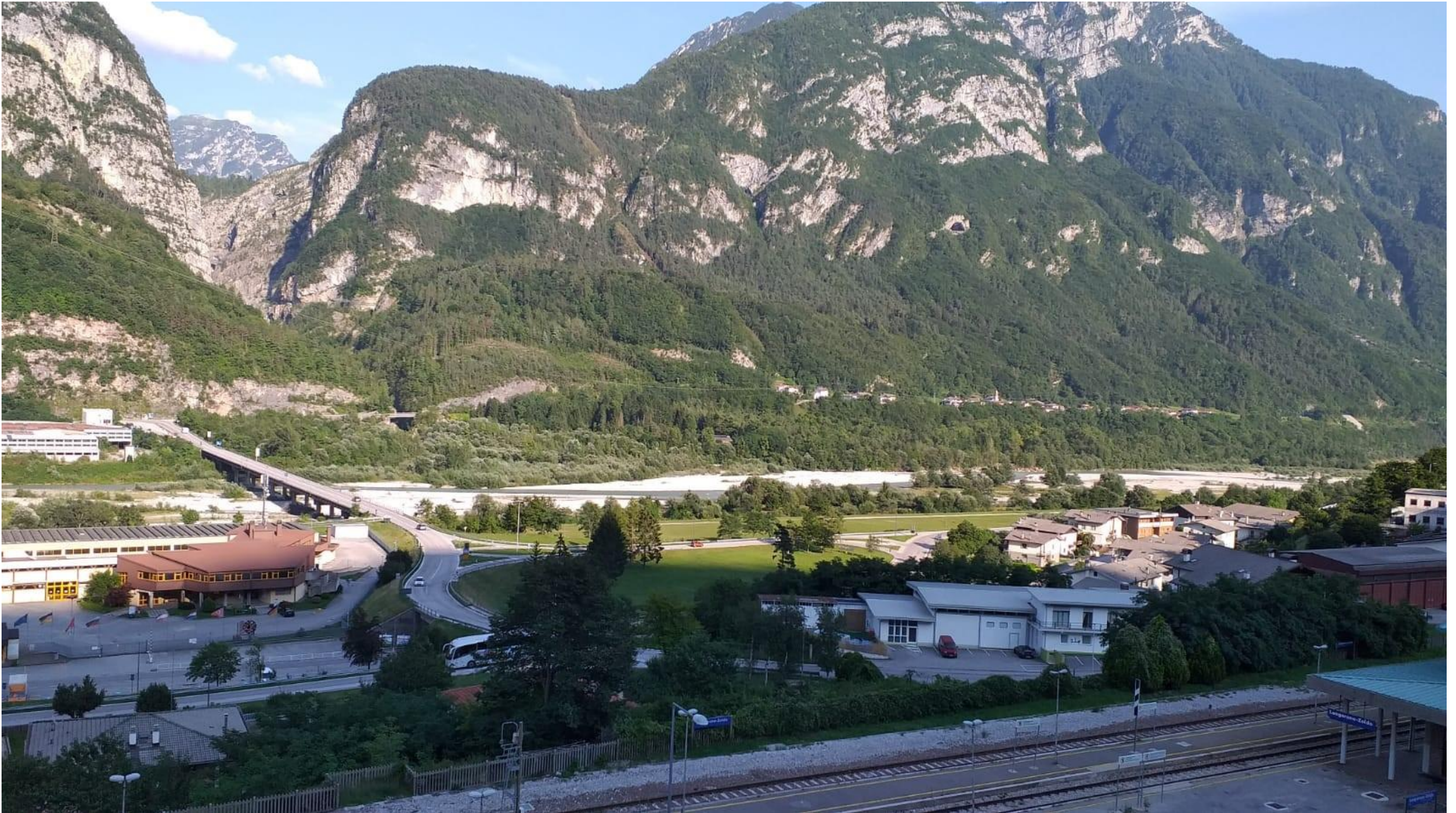
Figura 12: in corrispondenza della pk 7+850 circa - Il punto di vista è individuato dalla Chiesa di Santa Maria Immacolata di Longarone in direzione Est. La visuale è rivolta verso il Viadotto Fiera, dalla quale sono riconoscibili gli elementi del sistema insediativo, come l'abitato, la linea ferroviaria, la fiera e parte dell'area industriale di Longarone .