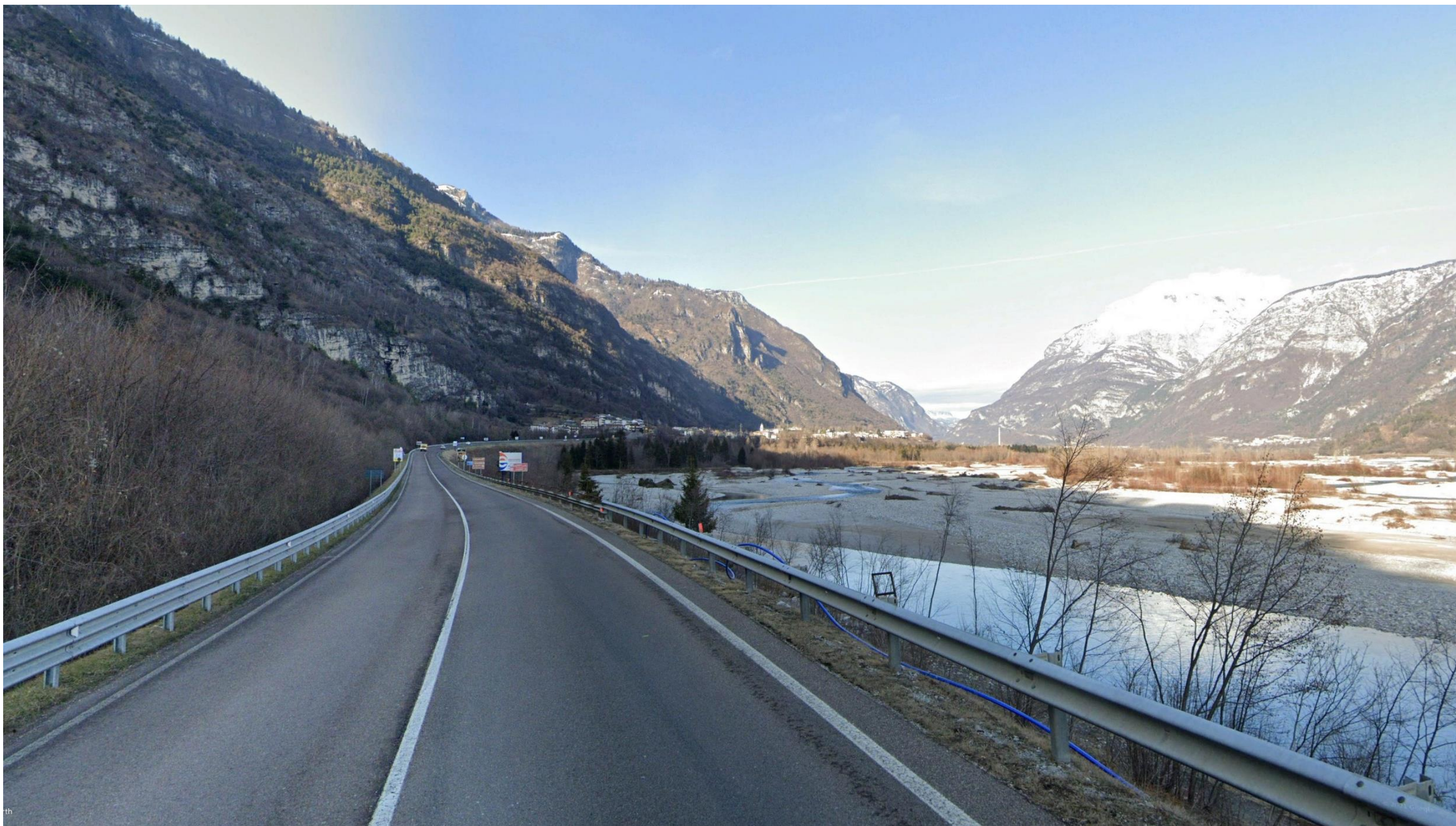
Figura 3: dalla pk 1+600 - Vista dalla strada dAlemagna in direzione NNO, rivolta verso il tratto che si sviluppa ad est e in variante rispetto al tracciato attuale. Dalla vista è possibile osservare sulla destra il paesaggio durante la stagione invernale.