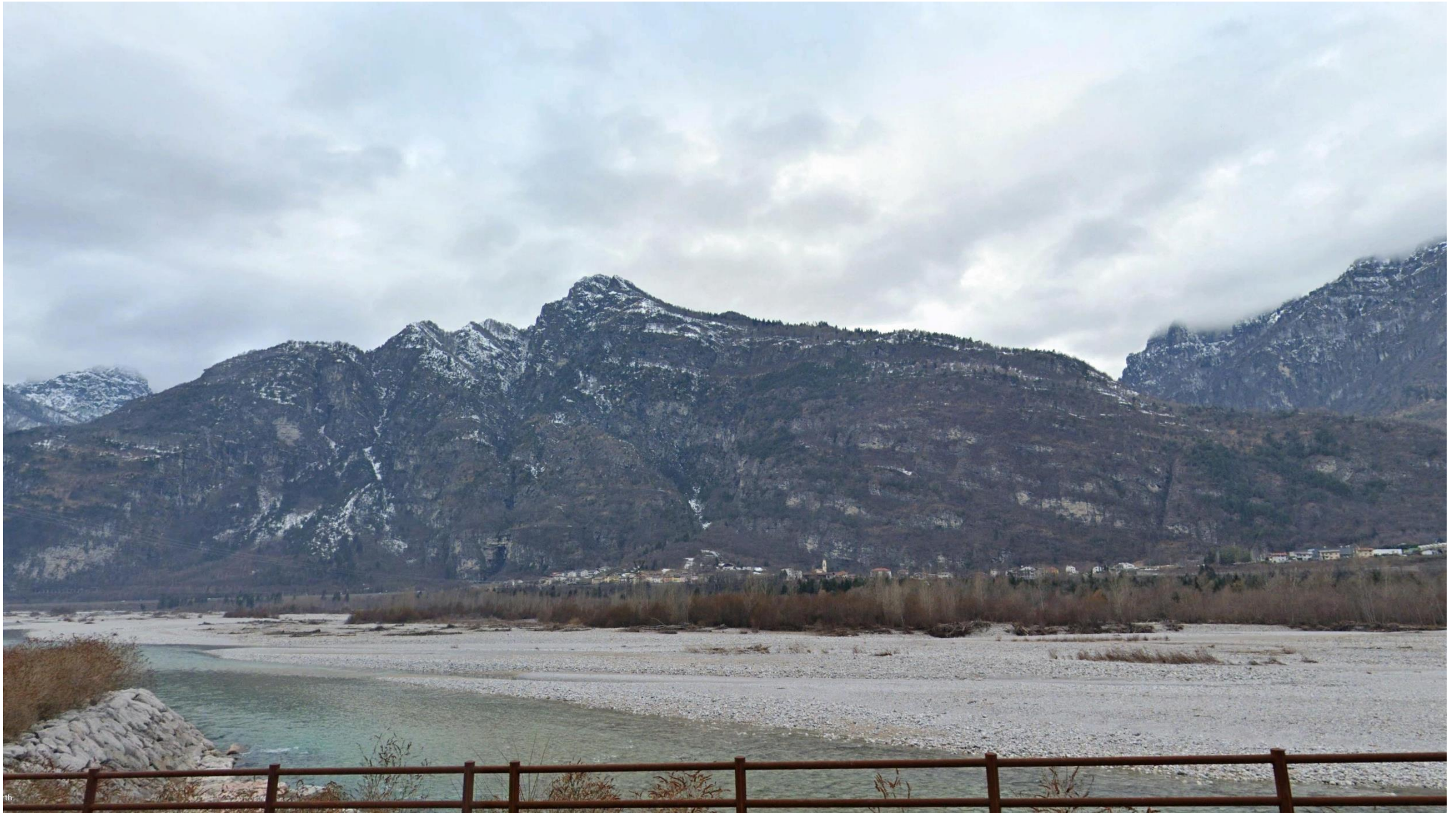
Figura 5: in corrispondenza della pk 3+500 circa - Vista da strada locale in sinistra idrografica del Piave in direzione Ovest. La visuale è rivolta in direzione del Viadotto Desedan, che si sviluppa per un tratto di circa 1,2 chilometri. In primo piano è individuabile il Fiume Piave con la vegetazione, invece in secondo piano si è riconoscibile l'abitato di Fortogna.