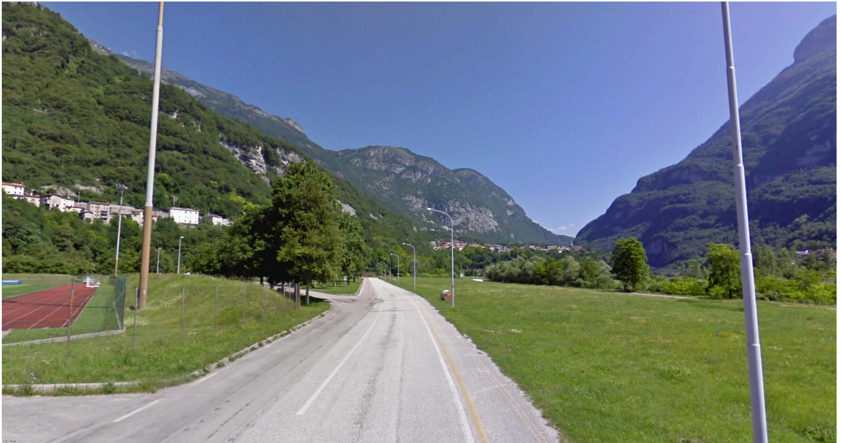
Figura 15: in corrispondenza della pk 8+500 - La vista è determinata lungo la Via del Parco in direzione nord. Da questo punto di vista sarà visibile l'asse deviato della Via del Parco e il tratto del tracciato che prosegue in rilevato per circa 200 metri da questo punto.