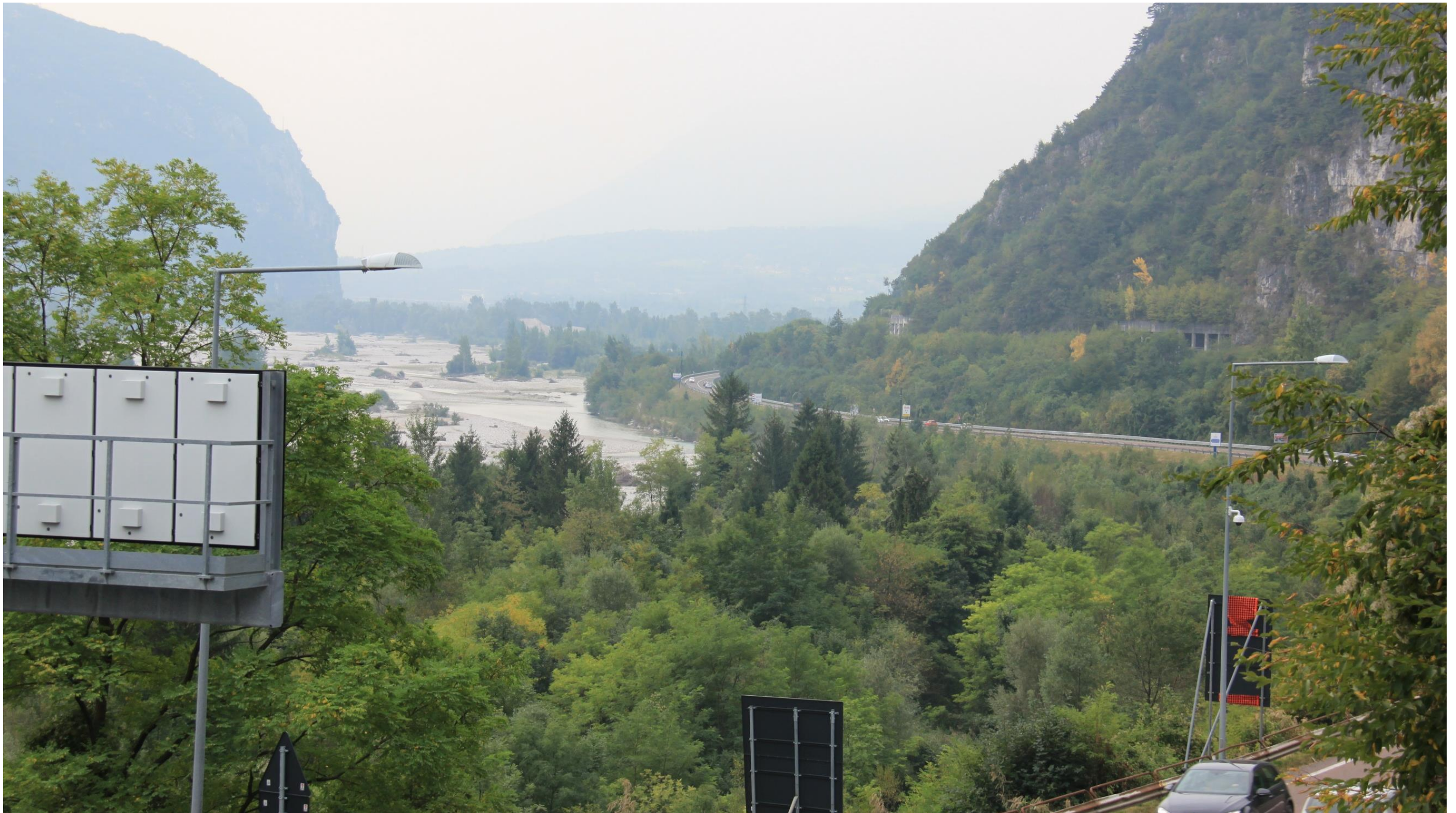
Figura 4: Pk 2+500 - vista dalla strada che raccorda la SS 51 al Viale Vittime del Vajont in direzione Sud. Da questo punto sopraelevato è possibile avere una visuale ampia e rivolta verso l'area d'intervento, dove è previsto un tratto del tracciato in rilevato e a destra del sedime stradale attuale. Sono in primo piano la vegetazione e il Fiume Piave, corso d'acqua vincolato ai sensi dell'articolo 142 del D.Lgs. 42/2004.