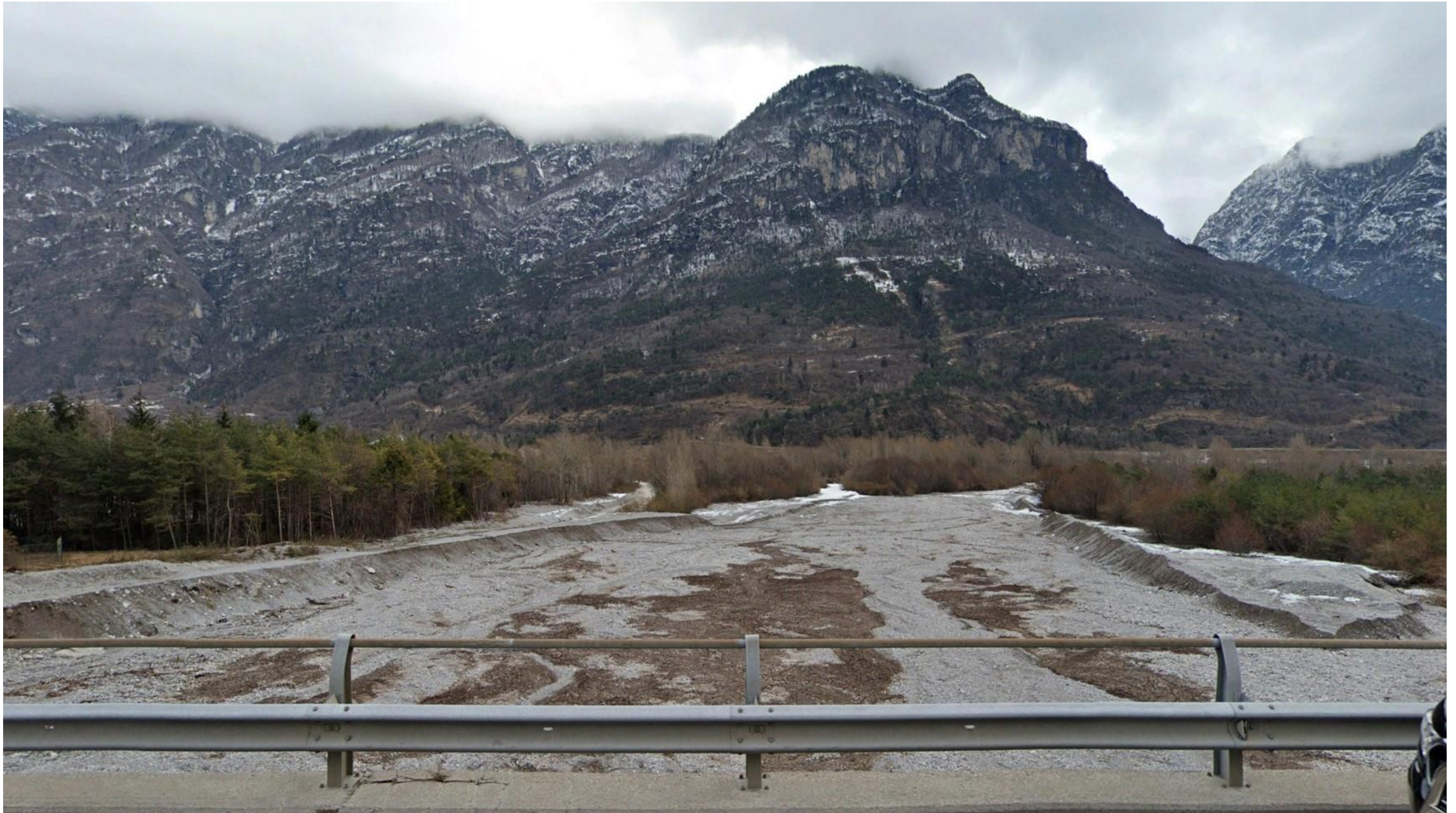
Figura 6: in corrispondenza della pk 4+000 - Vista dall'attuale strada dAlemagna in direzione del Viadotto Desedan, che si sviluppa per circa un chilometro. Dalla vista è possibile osservare il greto del fiume in corrispondenza del punto in cui il Torrente Desedan confluisce nel Fiume Piave e sullo sfondo i rilievi montuosi. (Fonte: Google Earth).