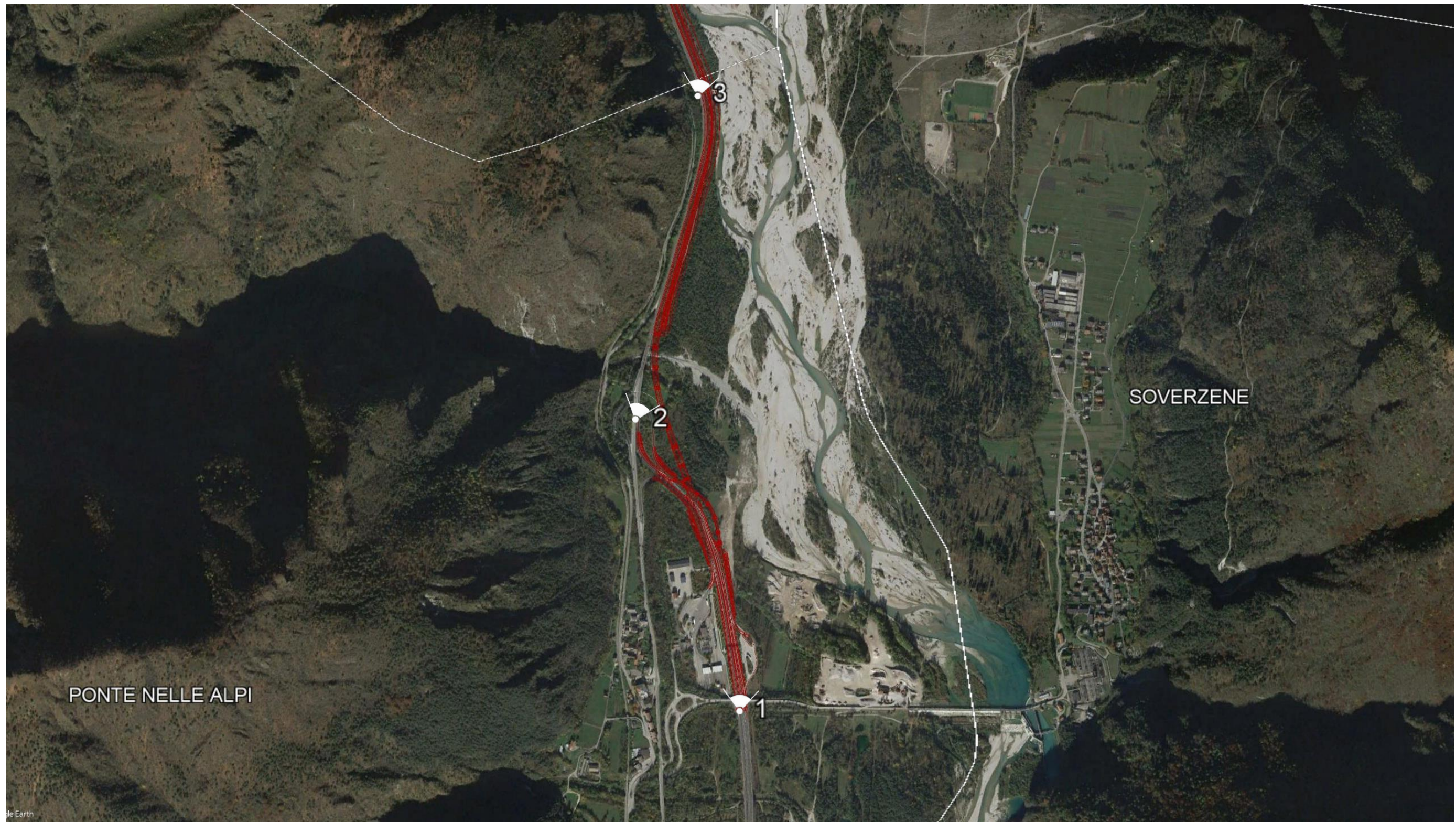
Planimetria di progetto su ortofoto nel Comune di Ponte Nelle Alpi e individuazione dei punti di ripresa fotografici nel tratto compreso tra le pk 0+000 – 1+710