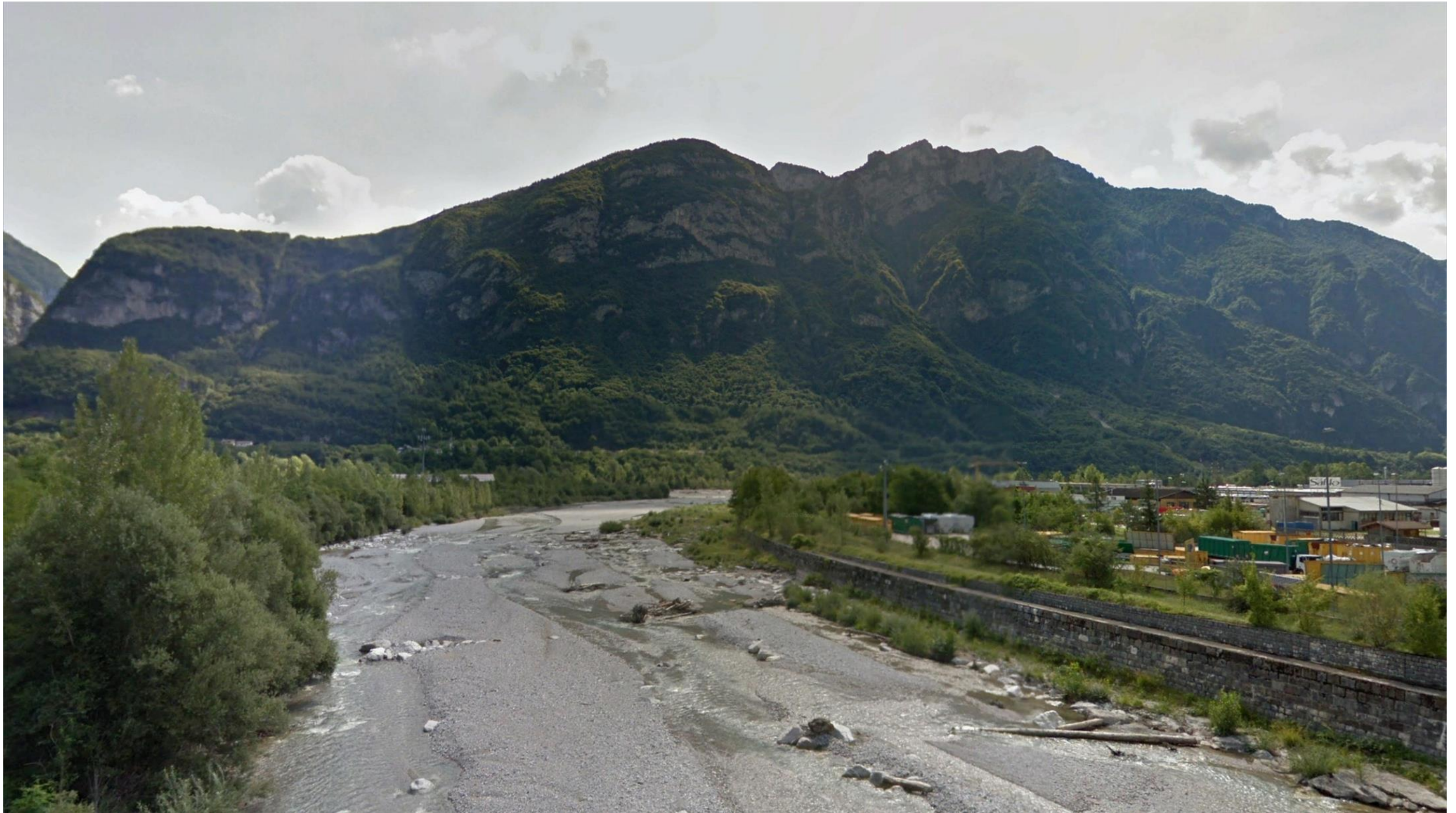
Figura 8: in corrispondenza della pk 6+850. circa – Vista individuata dalla Via Gianfranco Trevisan, parallela all'attuale SS 51. La visuale è rivolta in direzione del Viadotto Maè, che si sviluppa per circa 480 metri. Nella foto a destra è visibile l'insediamento industriale Villanova.