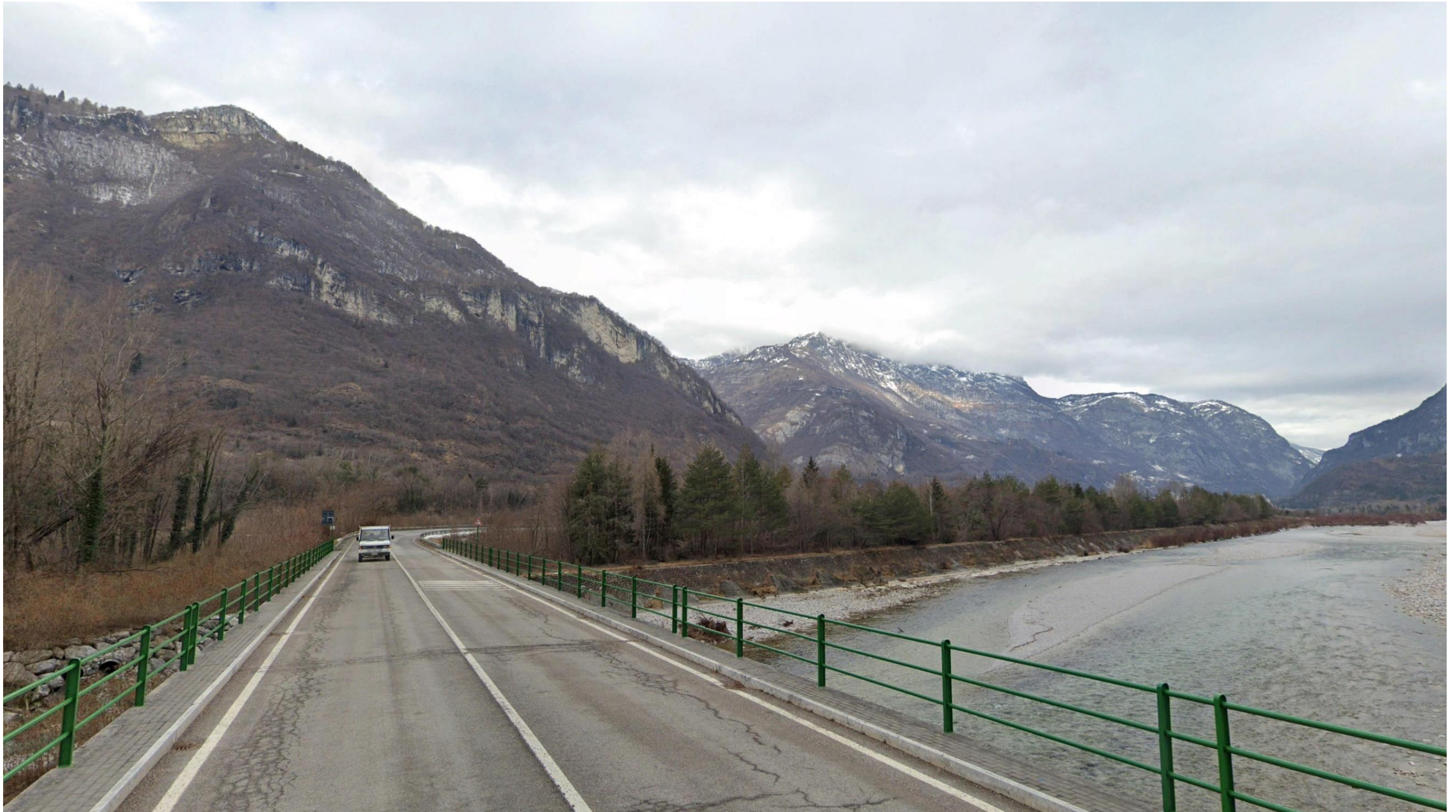
Figura 7: pk 5+150 circa - Vista da strada locale che collega la frazione di Provagna in direzione della SS51. La visuale è rivolta alla statale oggetto di intervento in direzione dello Svincolo (SV_02) che consente il collegamento con l'area industriale Villanova.