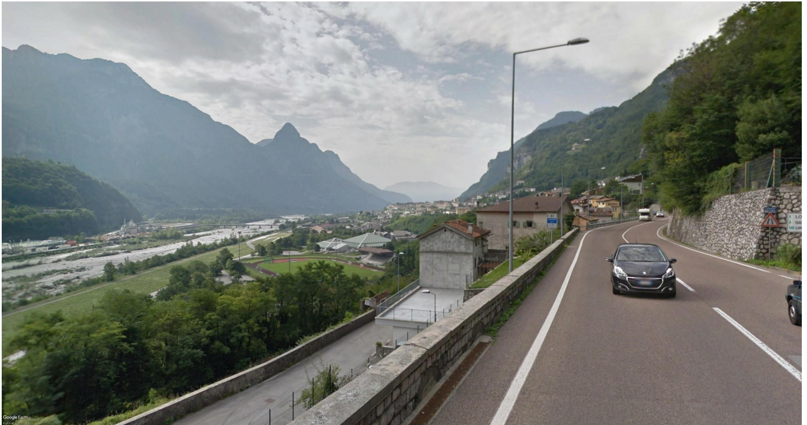
Figura 16: pk 9+000 circa - La visuale è determinata lungo l'attuale SS 51 in direzione SSE. Da questo punto di osservazione si avrà una visuale piuttosto ampia dell'intervento in esame, nello specifico del Viadotto Malcom.