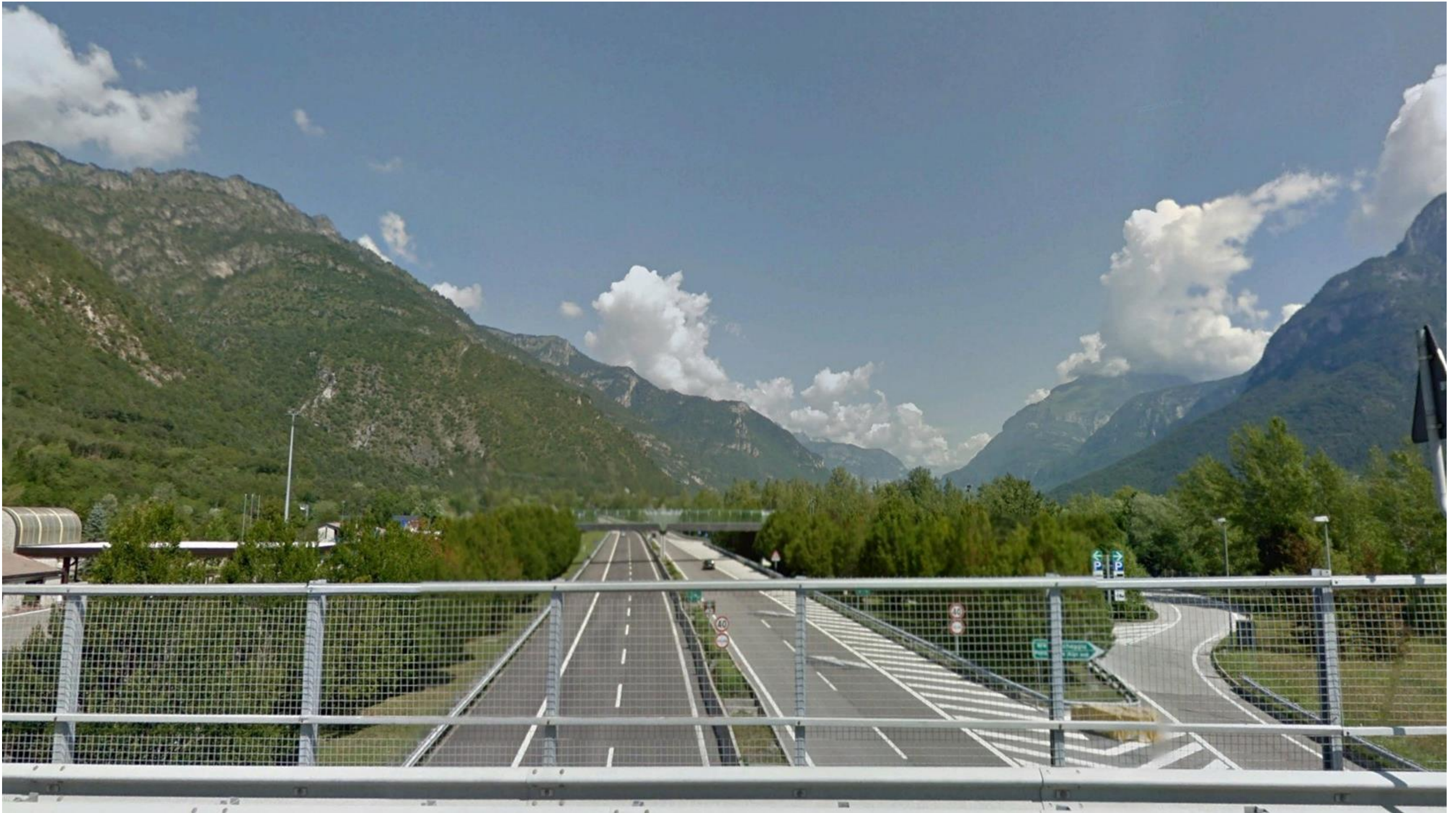
Figura 1: Progressiva 0+000 - Vista dalla SP11 in direzione della tratta di intervento. La visuale è determinata sul viadotto di attraversamento della SS51 di Alemagna, in corrispondenza del tratto iniziale di progetto, che si sviluppa in adeguamento sul tracciato esistente. (Fonte: GoogleEarth).