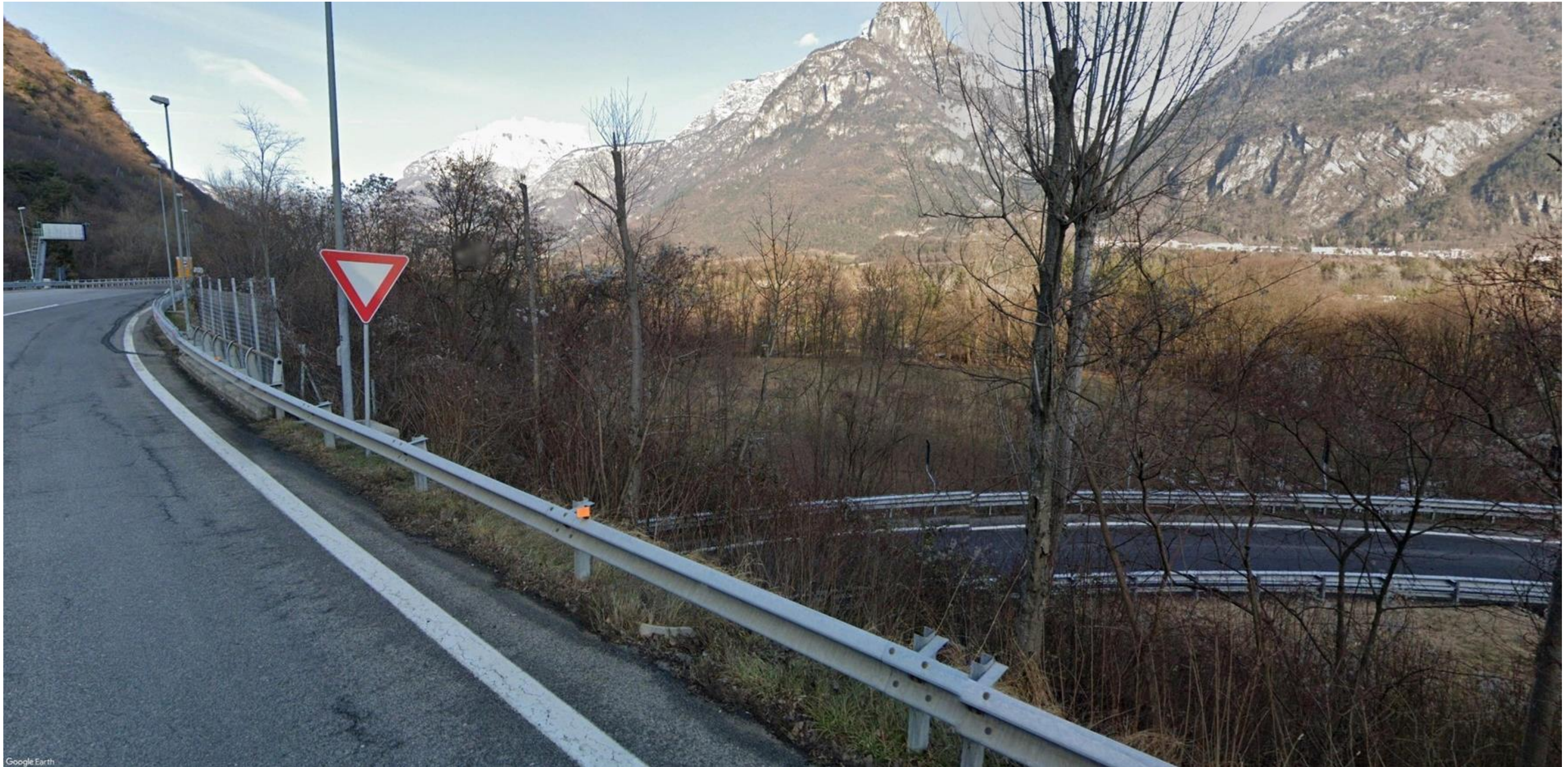
Figura 2: Progressiva 0+600.00 - Vista dall'attuale SS51 oggetto di intervento in direzione NNE. La visuale è rivolta in direzione del Viadotto Frari, che sviluppandosi per circa 440 metri attraversa un'area occupata da una fitta vegetazione.