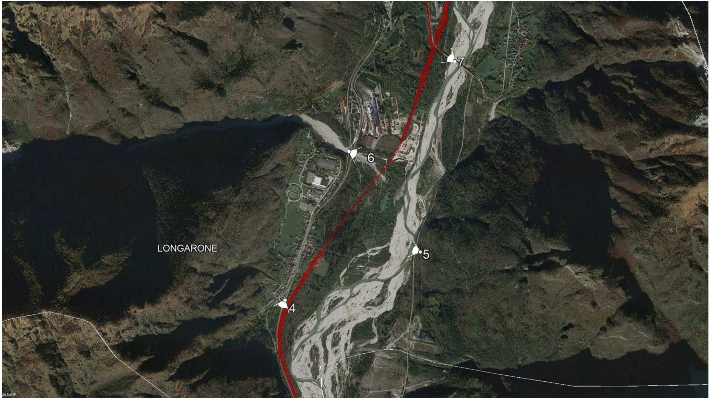
Planimetria di progetto su ortofoto nel Comune di Longarone e individuazione dei punti di ripresa fotografici nel tratto compreso tra le pk 1+710 – 5+600