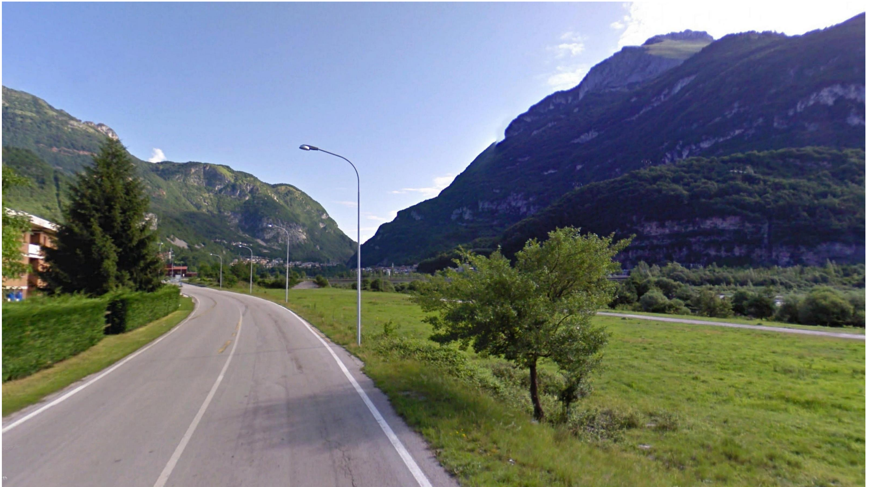
Figura 10: in corrispondenza della pk 7+450 ca.- Vista individuata in corrispondenza della Via Gianfranco Trevisan in direzione N. La visuale è rivolta verso il tratto iniziale del Viadotto Fiera, che si sviluppa per circa 470 metri. Il tratto in viadotto occuperà il terreno erboso posto al margine destro della Via Trevisan