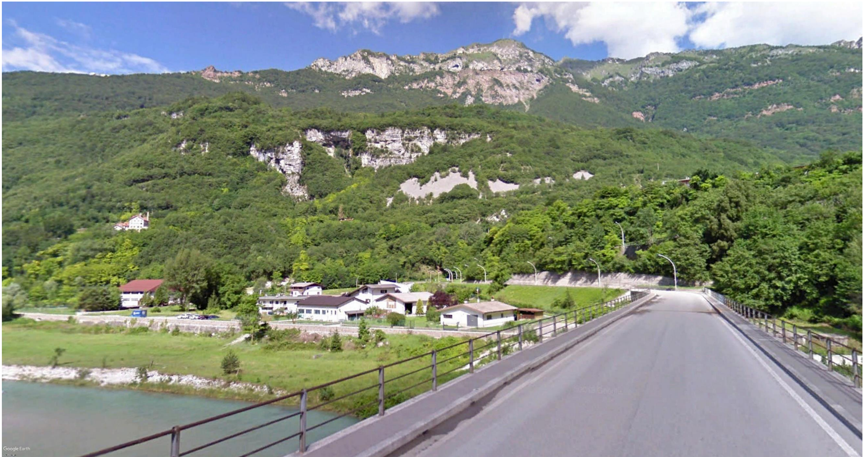
Figura 17: pk: 9+300 circa - La visuale è determinata dalla Via XX Settembre, in direzione NNO. In corrispondenza di tale punto di osservazione sarà visibile un tratto stradale in rilevato e di seguito un tratto in galleria, che si svilupperà in corrispondenza del muro di sostegno esistente sulla destra della foto.