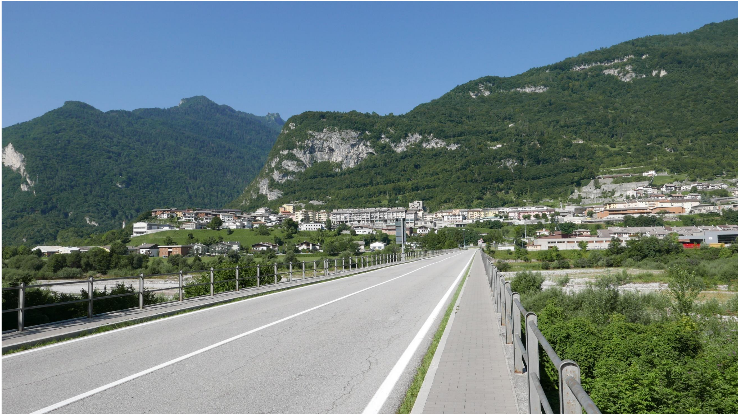
Figura 11: in corrispondenza della pk 7+750 circa. Il punto di vista si colloca in corrispondenza del ponte che attraversando il Piave e collega la strada SS251 all'abitato di Longarone. La visuale è rivolta in direzione Ovest verso il Viadotto Fiera, che si sviluppa nel tratto in corrispondenza al centro di Longarone.