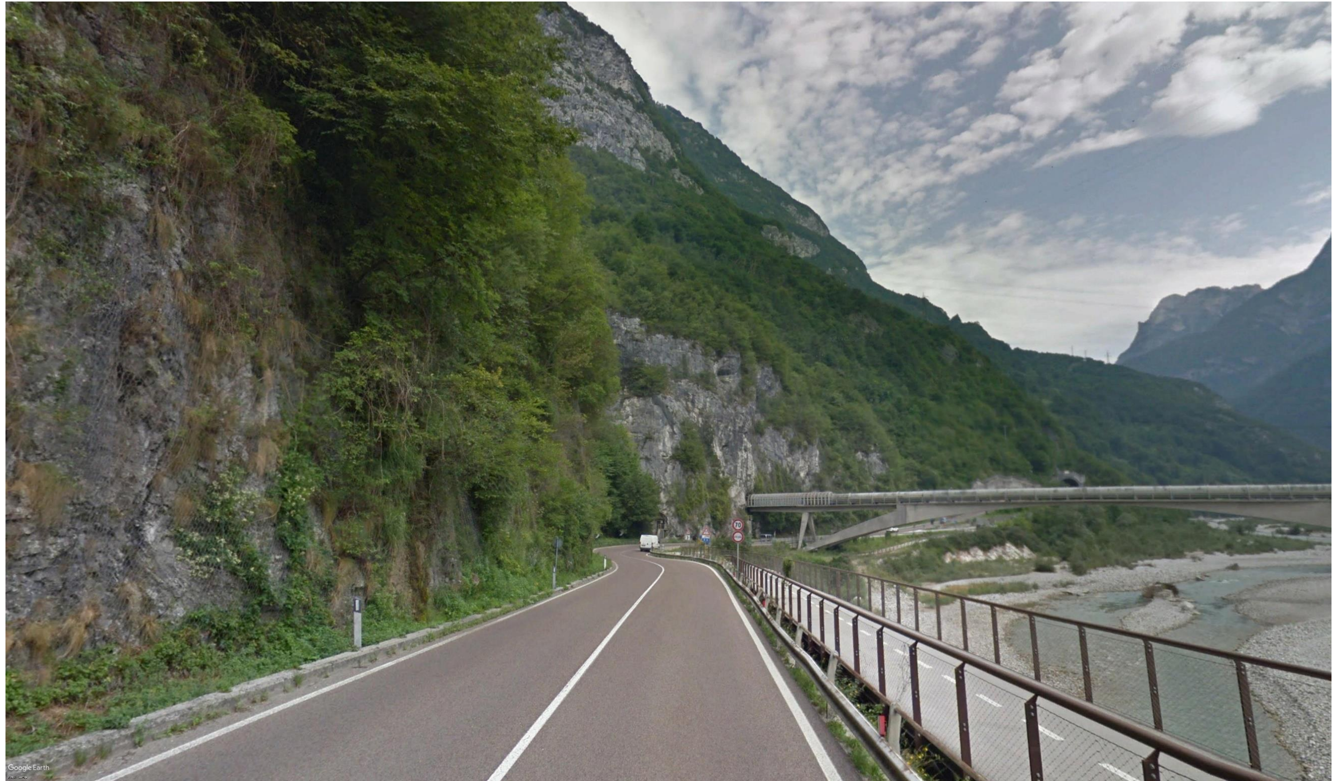
Figura 19: pk 10+800 - La visuale è determinata lungo il sedime dell'attuale SS 51 d'Alemagna rivolta in direzione NNE. Da tale punto di osservazione sarà visibile il Viadotto Fason, che si sviluppa per circa 200 metri.