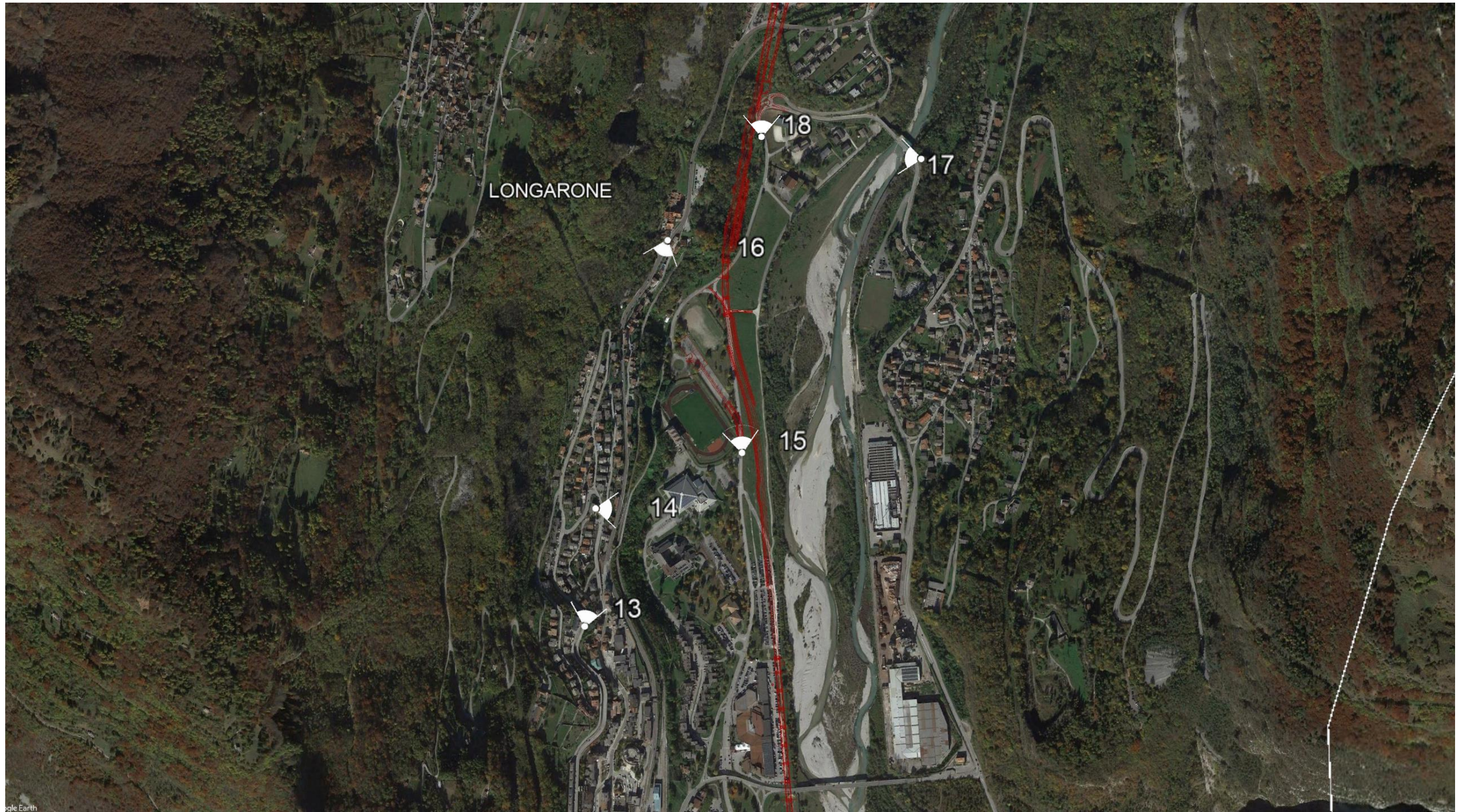
Planimetria di progetto su ortofoto nel Comune di Longarone e individuazione dei punti di ripresa fotografici nel tratto compreso tra le pk 8+000-9+310