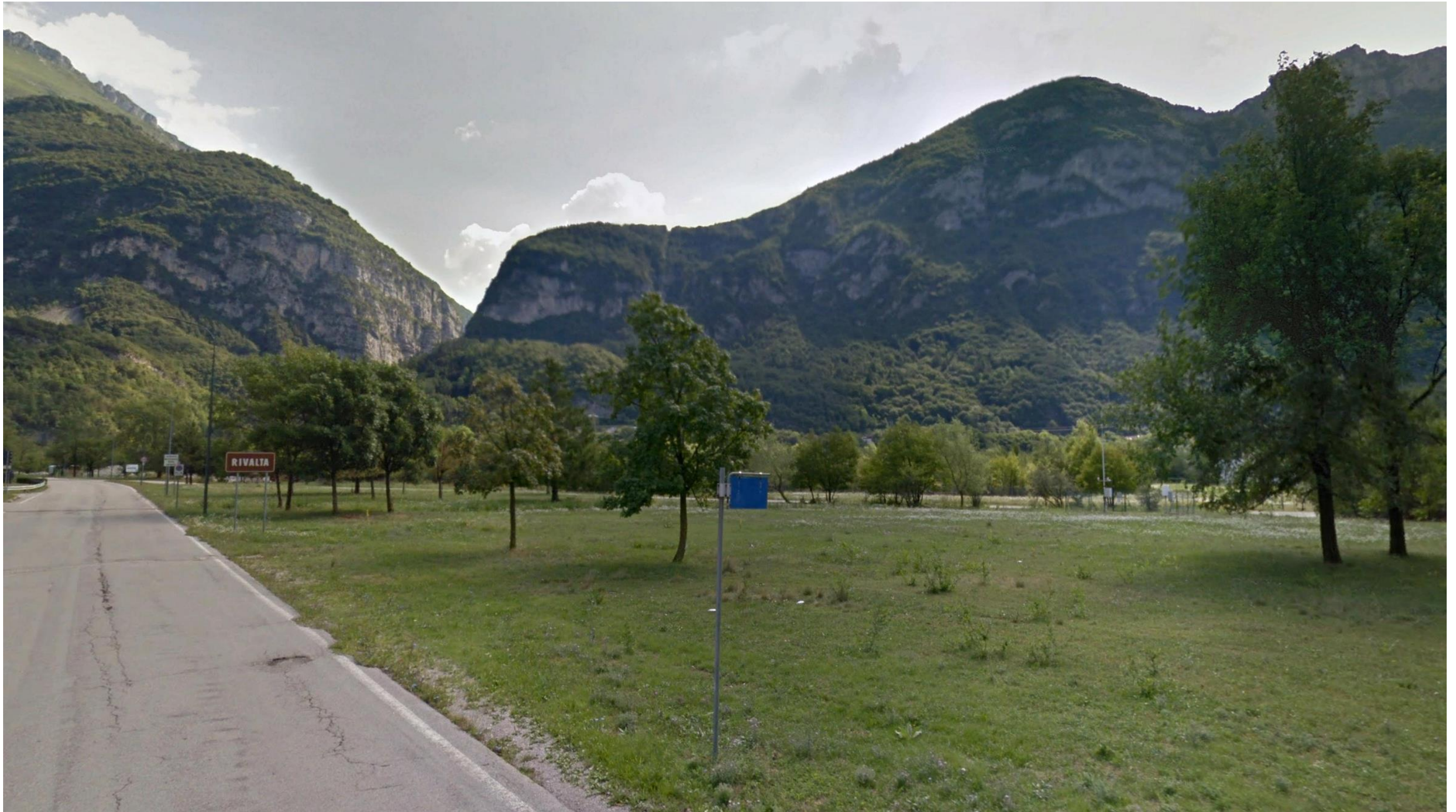
Figura 9: in corrispondenza della pk 7+100 ca - Visuale individuata lungo la Via Gianfranco Trevisan in direzione NE e rivolta in direzione dello Svincolo di Longarone (SV_03). Sul lato sinistro della foto è visibile l'area dove verrà realizzato il collegamento con la viabilità esistente avverrà per mezzo di una rotatoria in corrispondenza dell'attuale incrocio tra via G. Trevisan e via G. Protti.