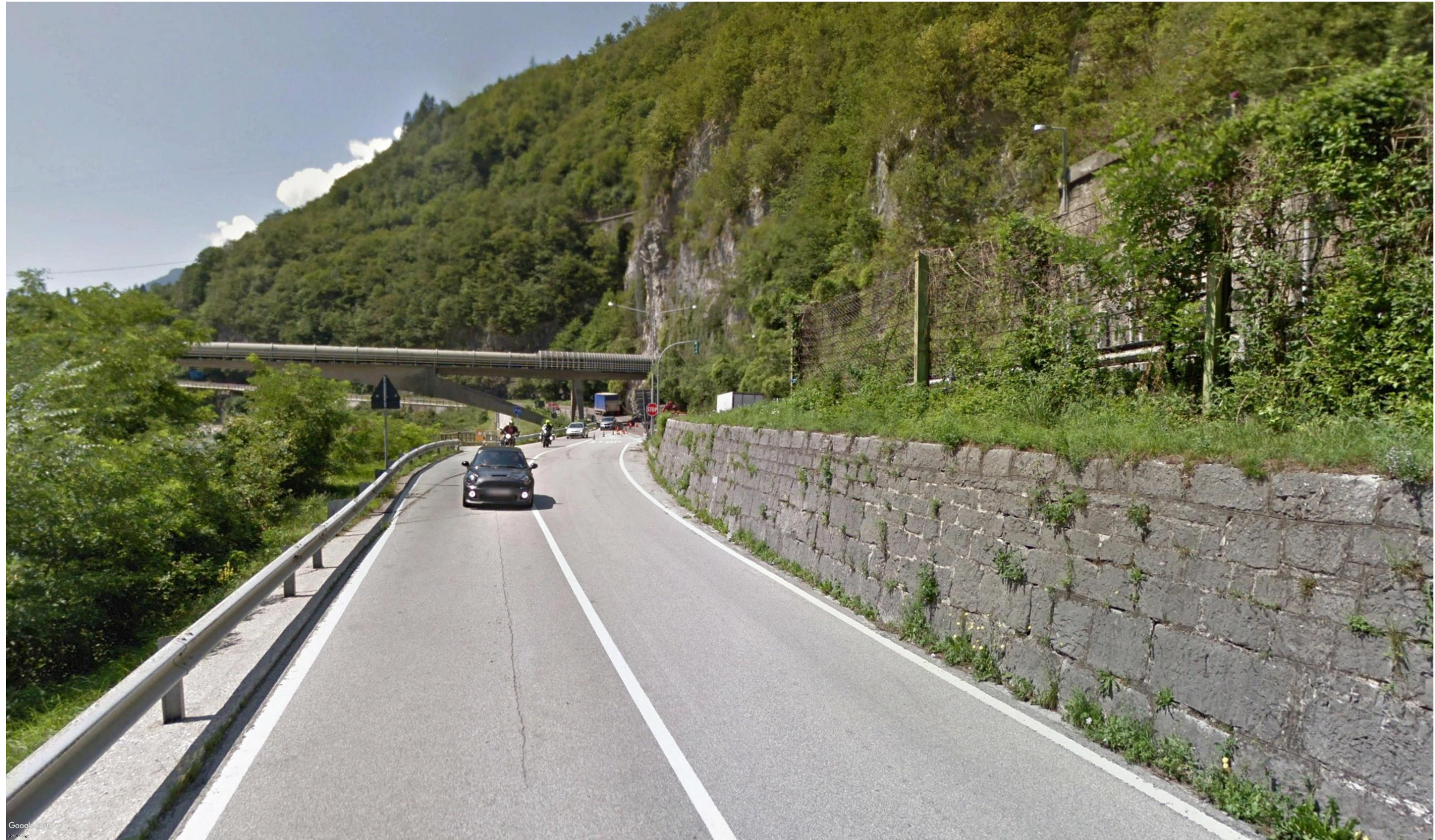
Figura 20: pk 11+140 - La visuale è determinata lungo l'attuale strada SS 51 ed è rivolta verso il Ponte Canale nella frazione Castellavazzo di Longarone. Da questa visuale, orientata in direzione SSE sarà visibile il Viadotto Fason.