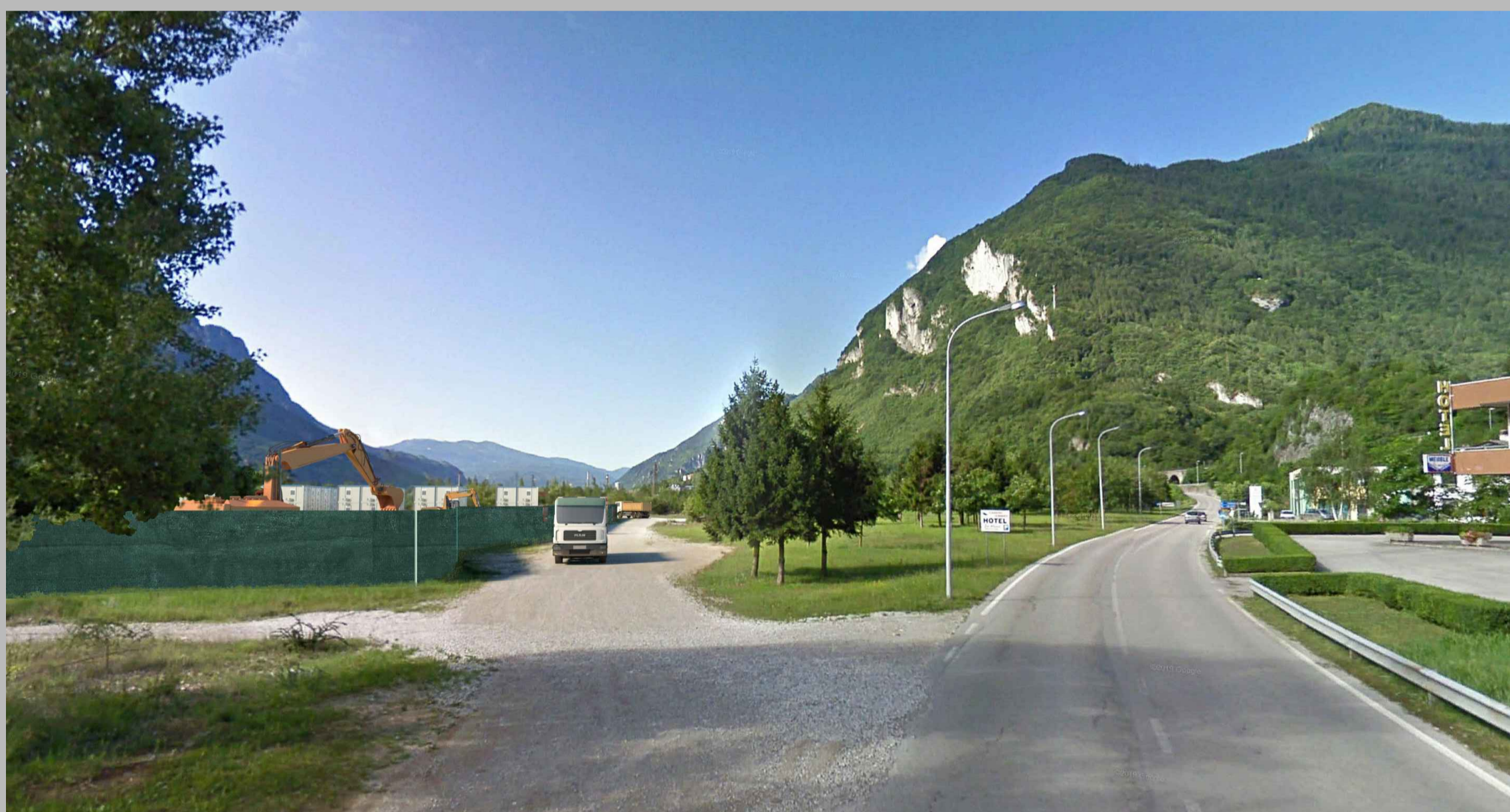
Fase CO:rete schermante