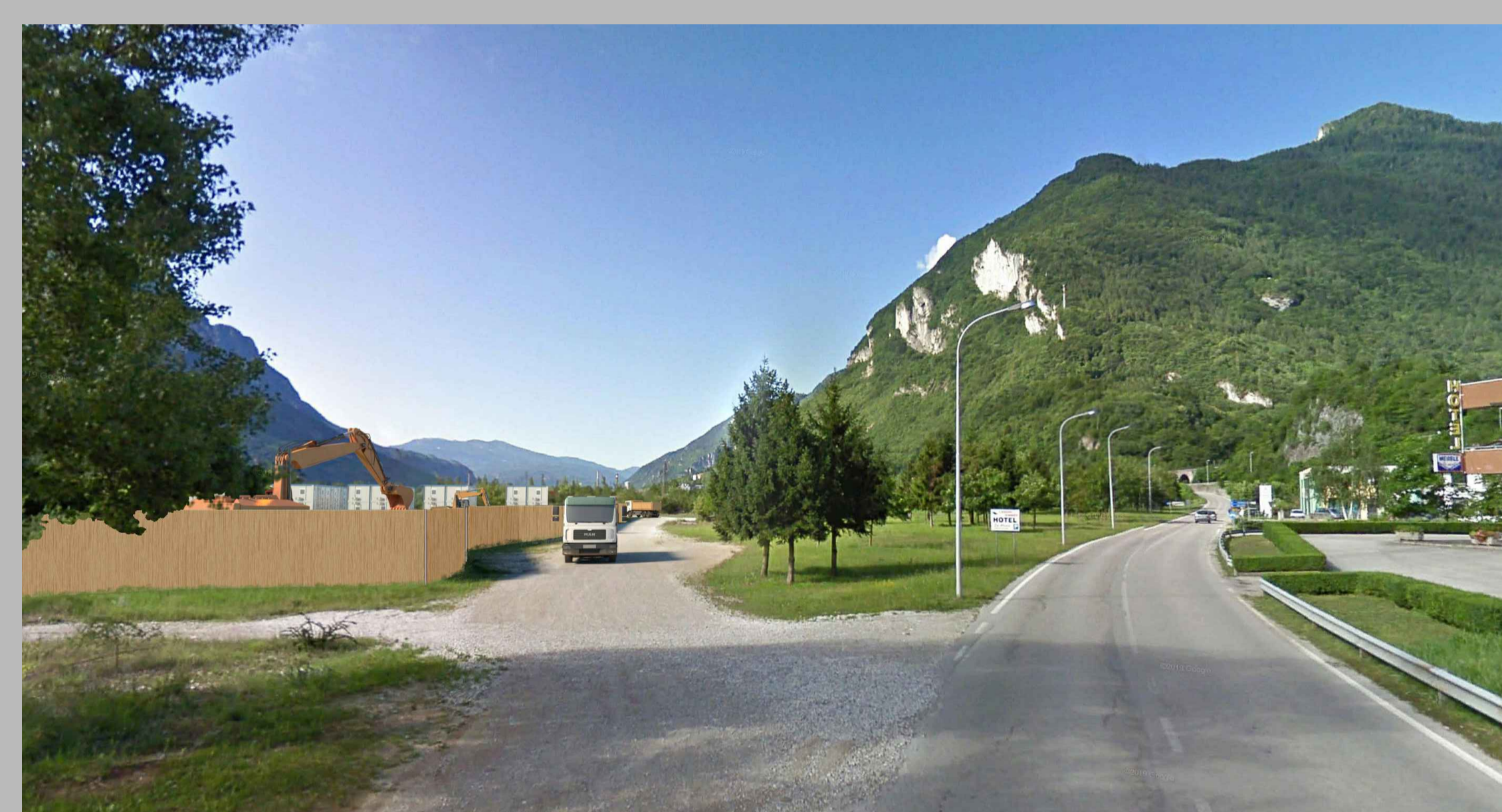
Fase CO:pannello in legno