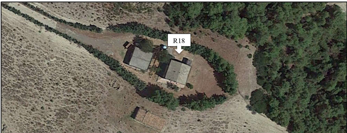
Foto 13a: R18-Durante il sopralluogo non è stato possibile raggiungere tale ricettore perché distante dalla strada pubblica e non raggiungibile con auto 4x4. Pertanto, è stata inserita una foto da Google Earth ed è stato considerato Abitazione