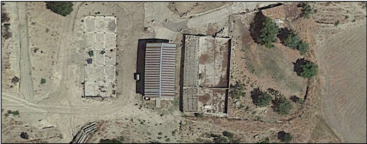
Foto 12a: R17-Durante il sopralluogo non è stato possibile raggiungere tale ricettore perché distante dalla strada pubblica e non raggiungibile con auto 4x4. Pertanto, è stata inserita una foto da Google Earth ed è stato considerato Non Abitazione