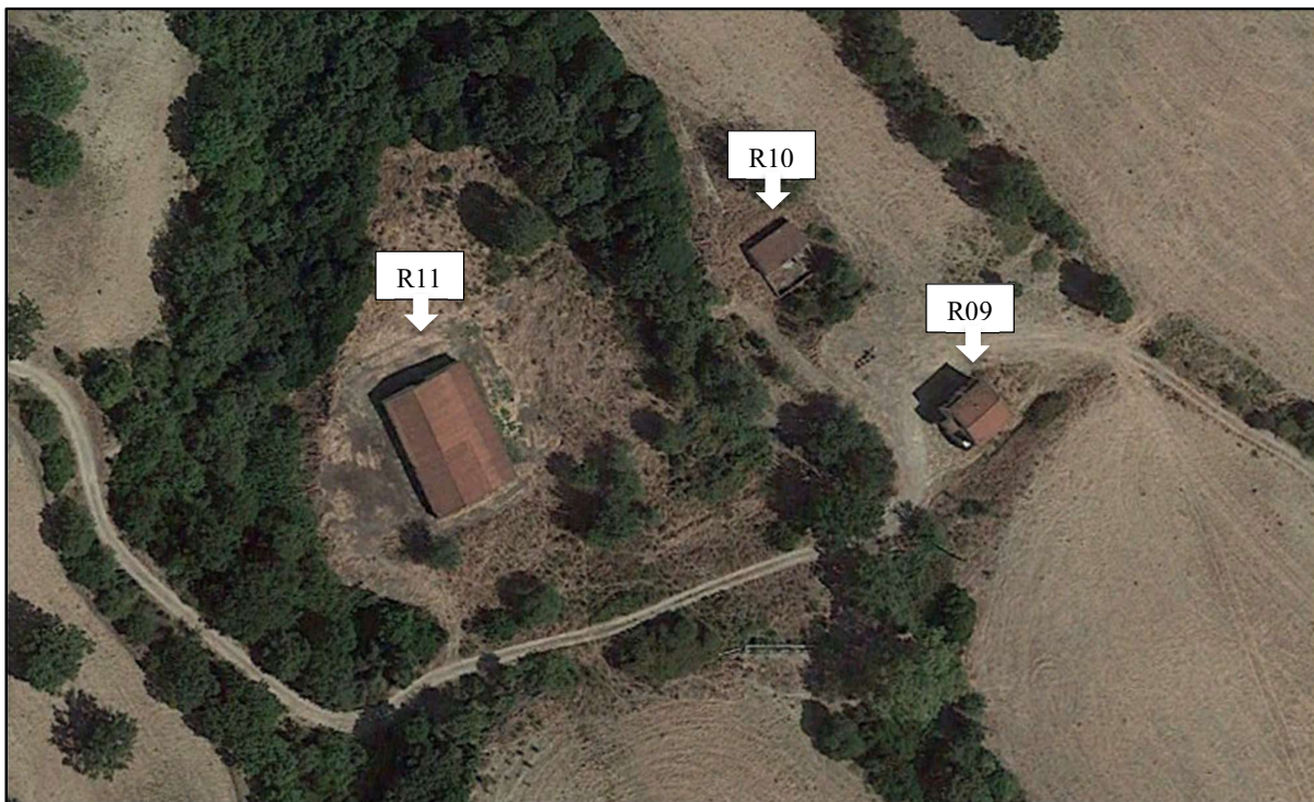
Foto 6a: R09; R10; R11-Durante il sopralluogo non è stato possibile raggiungere tali ricettori perché distanti dalla strada pubblica e non raggiungibili con auto 4x4. Pertanto, è stata inserita una foto da Google Earth e sono stati considerati Non Abitazioni