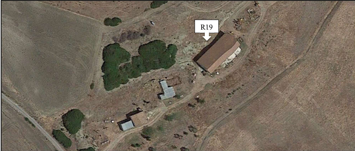
Foto 14a: R19-Durante il sopralluogo non è stato possibile raggiungere tale ricettore perché distante dalla strada pubblica e non raggiungibile con auto 4x4. Pertanto, è stata inserita una foto da Google Earth ed è stato considerato Non Abitazione