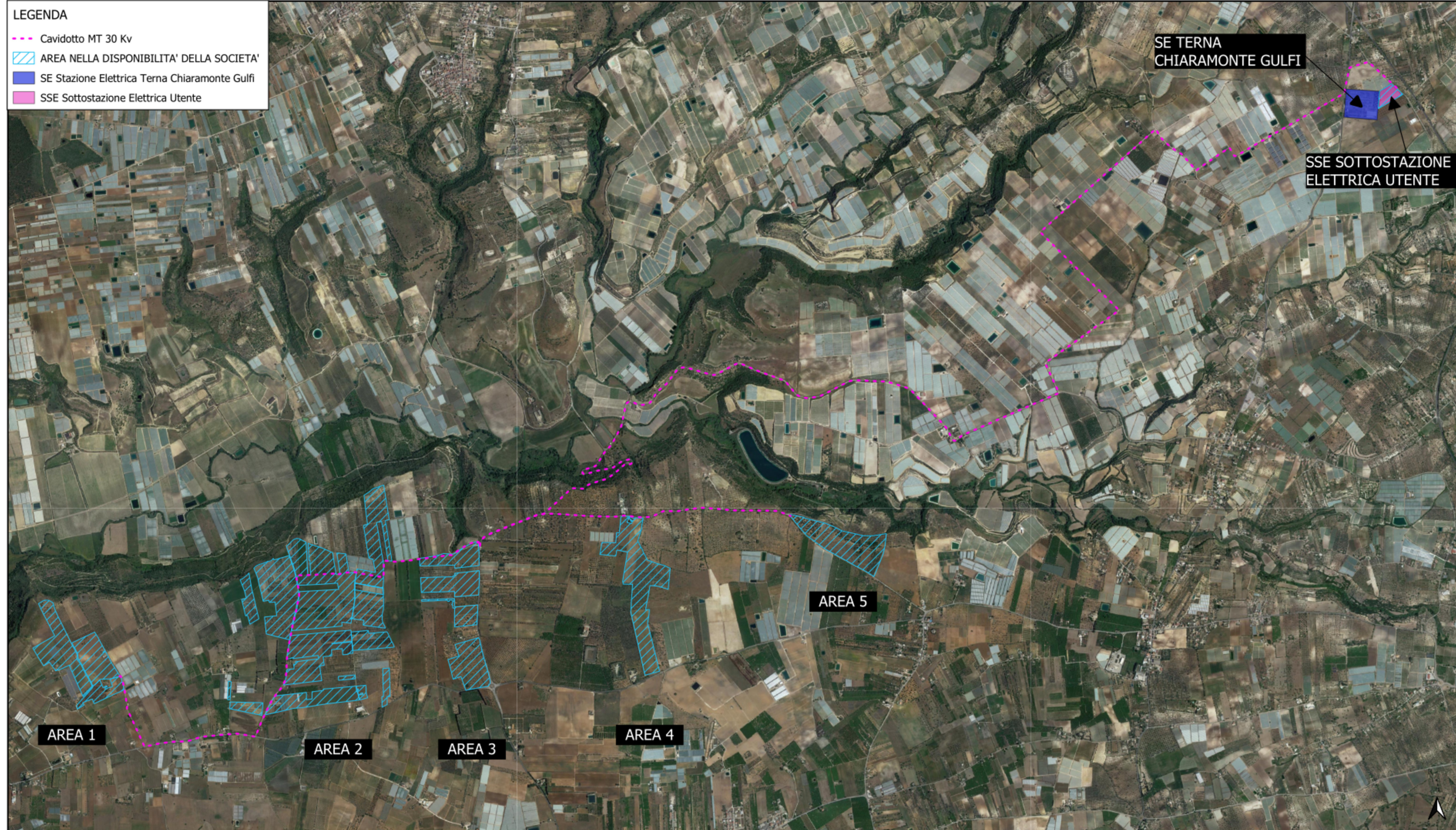
Inquadramento territoriale su vasta area - Scala 1:25.000