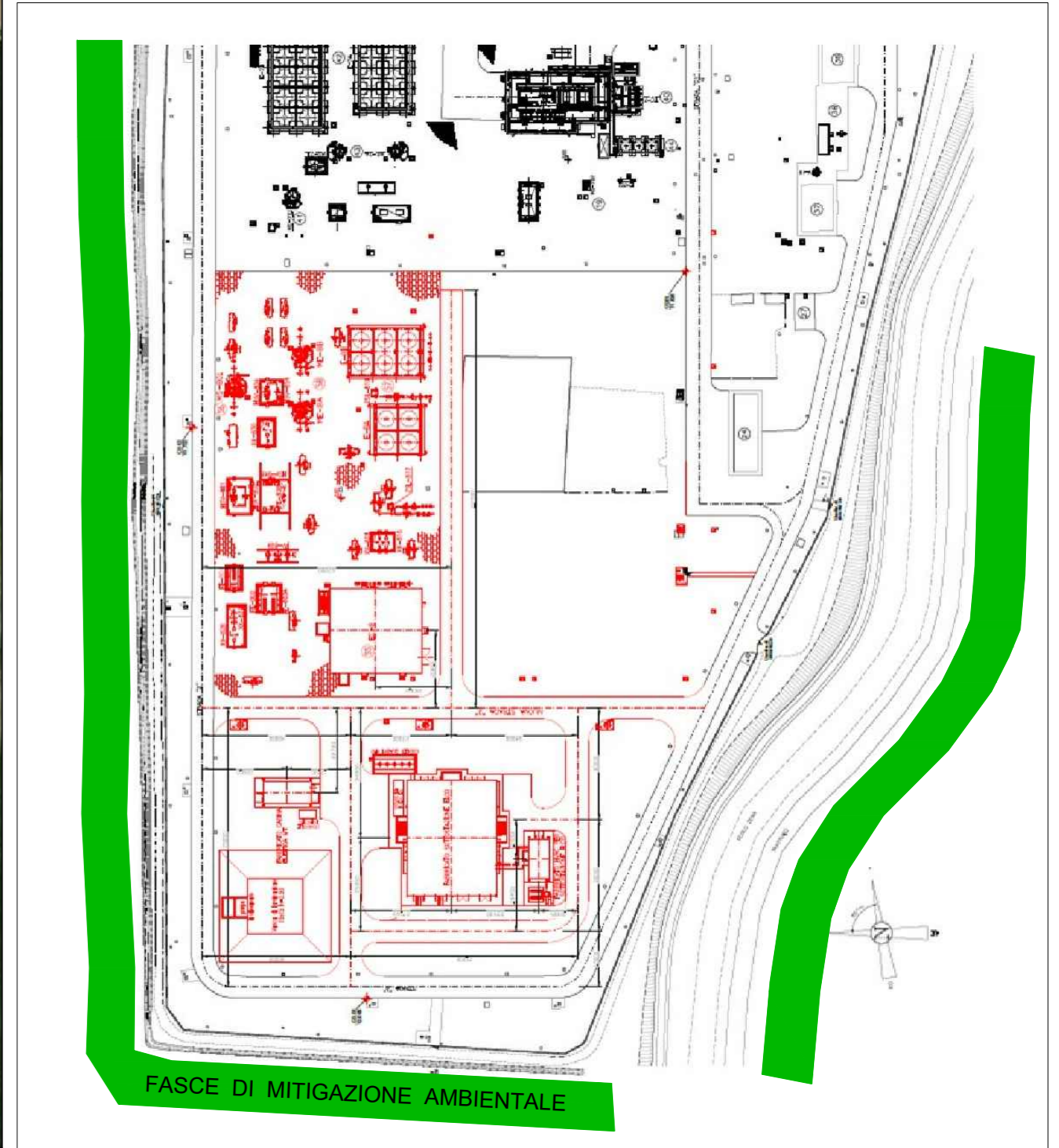
LAYOUT di PROGETTO di CENTRALE

Saipem S.p.A. Sede legale: Via L. Russo, 5 MILANO Sede operativa di Fano Via Tontolo, 1 61032 FANO (PU) P.IVA: 00825790157