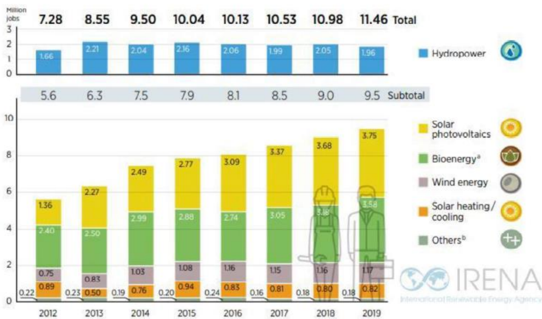
Figura1: Dati occupazionali nel settore rinnovabile negli ultimi anni