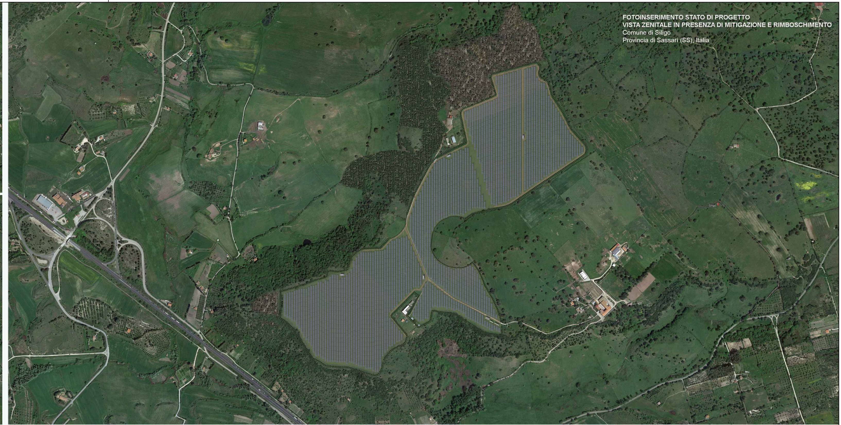
FOTOINSERIMENTO STATO DI PROGETTO VISTA ZENITALE IN PRESENZA DI MITIGAZIONE E RIMBOSCHIMENTO Comune di Siligo Provincia di Sassari (SS), Italia