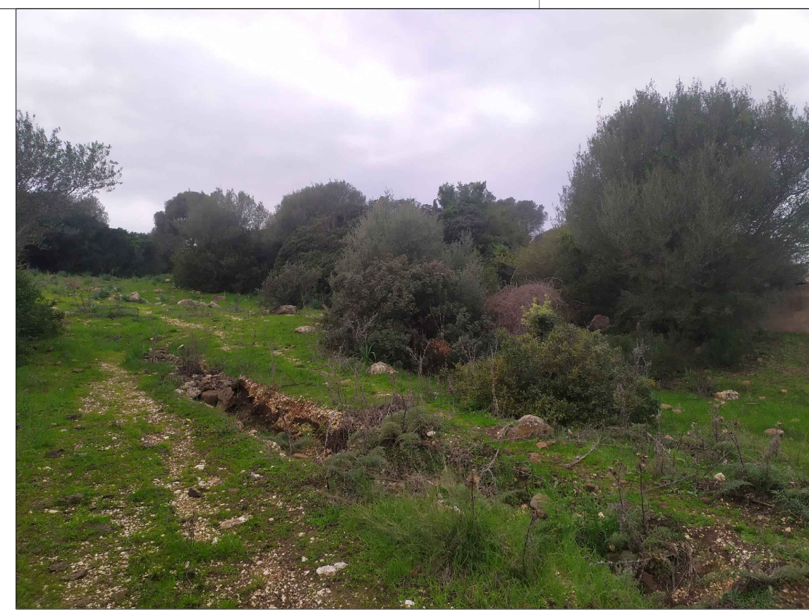
SCATTO P3; ANGOLO DI RIPRESA 330°; COORDINATE 551431 m E; 4468411 m N.