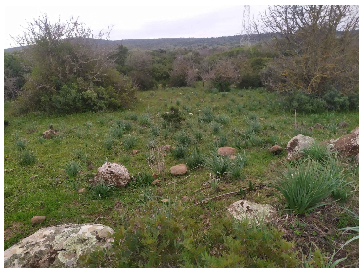
SCATTO P13; ANGOLO DI RIPRESA 180°; COORDINATE 551670 m E; 4469008 m N.