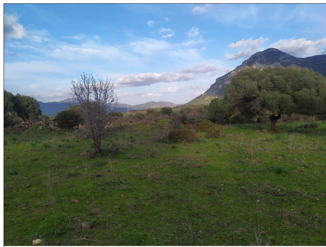
SCATTO P1; ANGOLO DI RIPRESA 60°; COORDINATE 551100 m E; 4468633 m N.