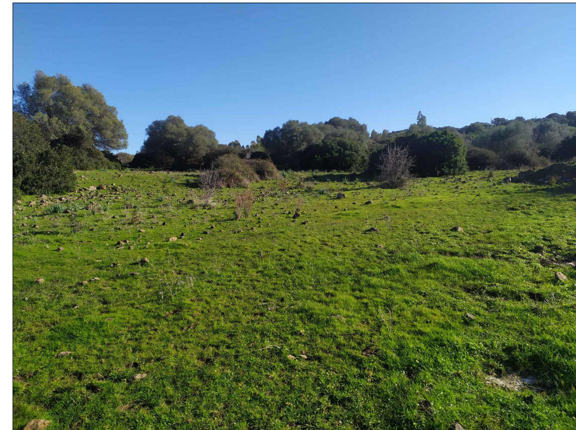
SCATTO P8; ANGOLO DI RIPRESA 120°; COORDINATE 551702 m E; 4468177 m N.