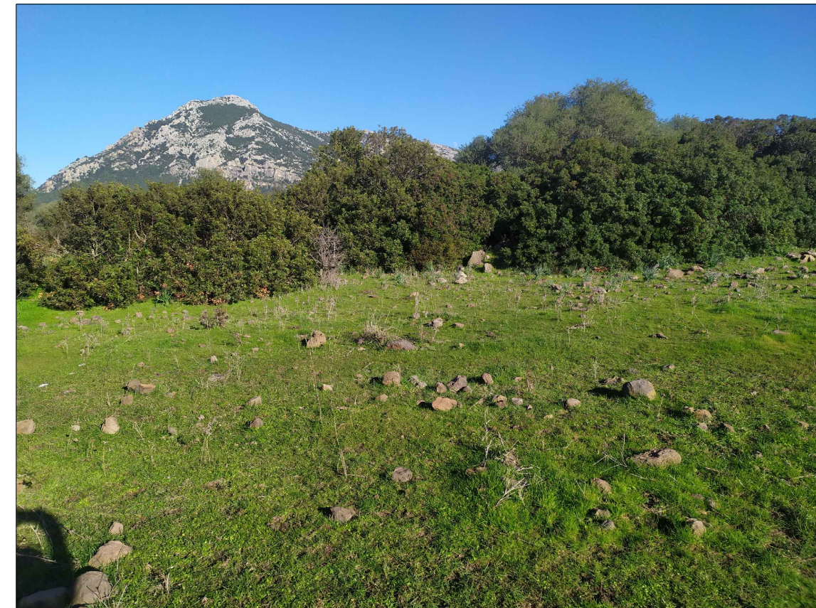
SCATTO P7; ANGOLO DI RIPRESA 45°; COORDINATE 551702 m E; 4468177 m N.