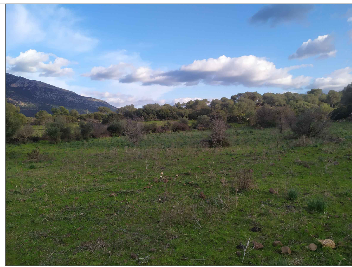
SCATTO P2; ANGOLO DI RIPRESA 100°; COORDINATE 551100 m E; 4468633 m N.