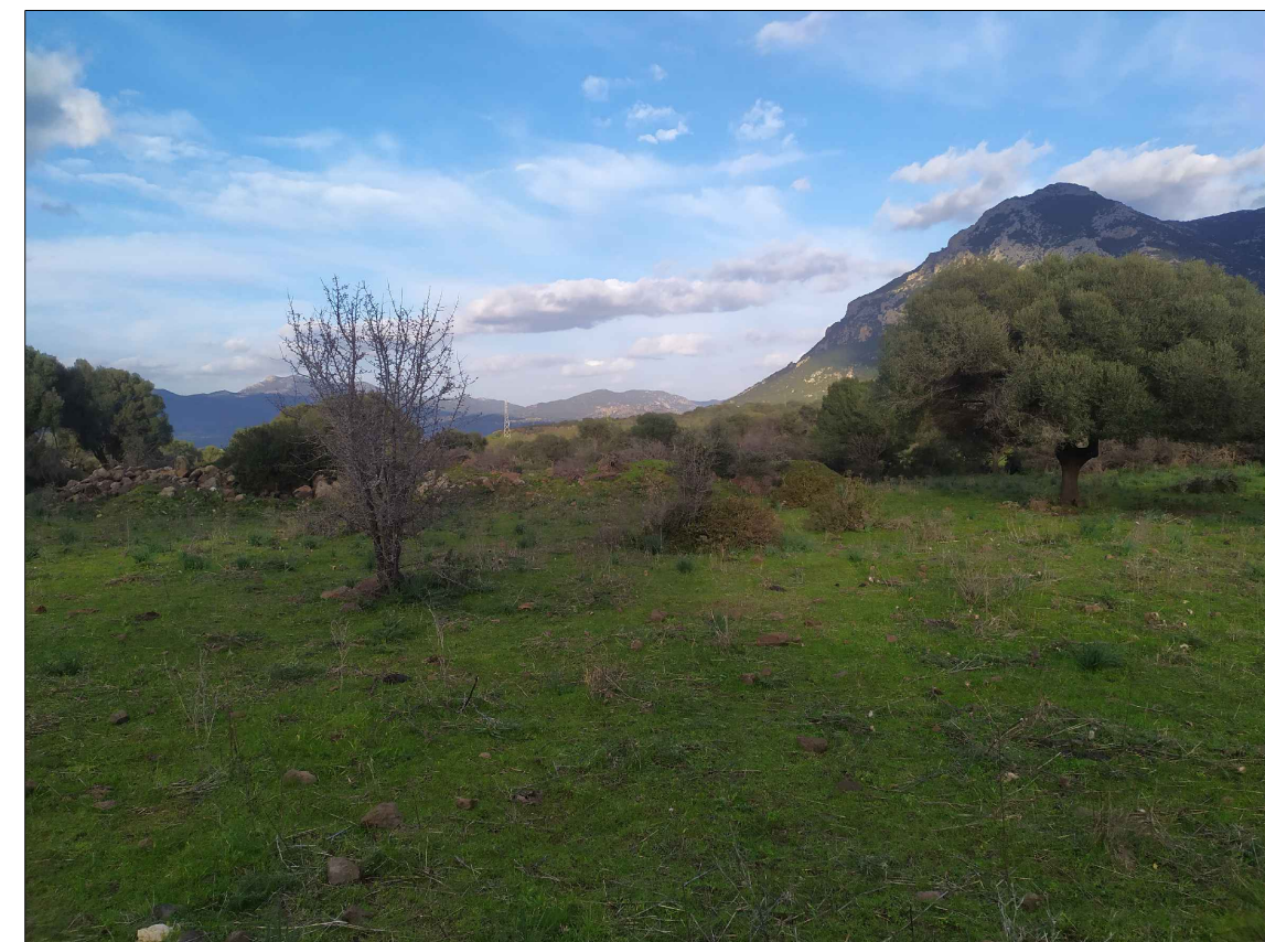
SCATTO P11; ANGOLO DI RIPRESA 10°; COORDINATE 551878 m E; 4468833 m N.