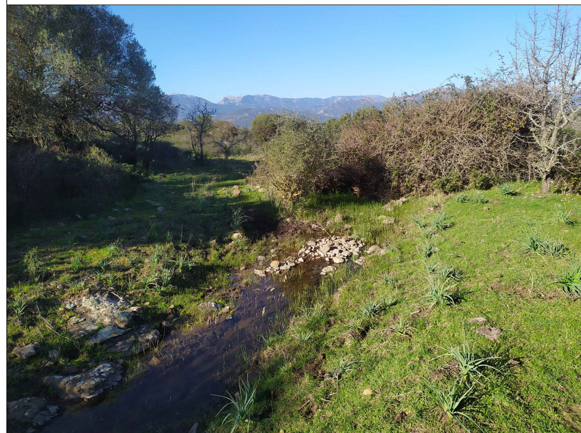
SCATTO P9; ANGOLO DI RIPRESA 360°; COORDINATE 551867 m E; 4468558 m N.