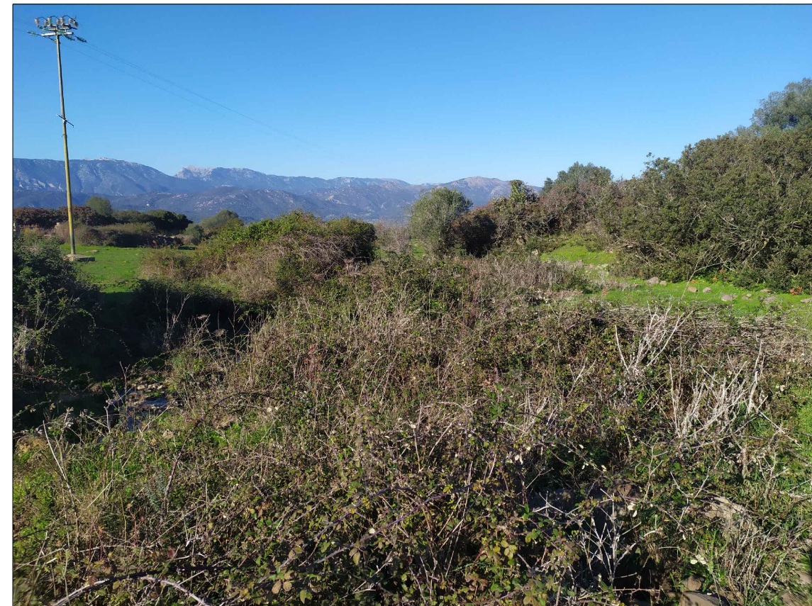
SCATTO P6; ANGOLO DI RIPRESA 350°; COORDINATE 551702 m E; 4468177 m N.