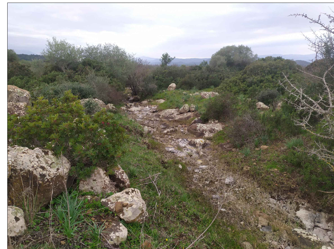
SCATTO P12; ANGOLO DI RIPRESA 360°; COORDINATE 551670 m E; 4469008 m N.