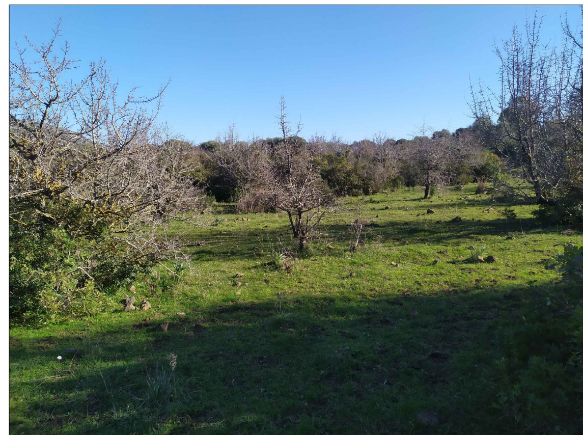
SCATTO P10; ANGOLO DI RIPRESA 120°; COORDINATE 551867 m E; 4468558 m N.