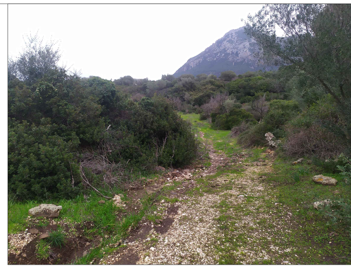
SCATTO P4; ANGOLO DI RIPRESA 45°; COORDINATE 551431 m E; 4468411 m N.