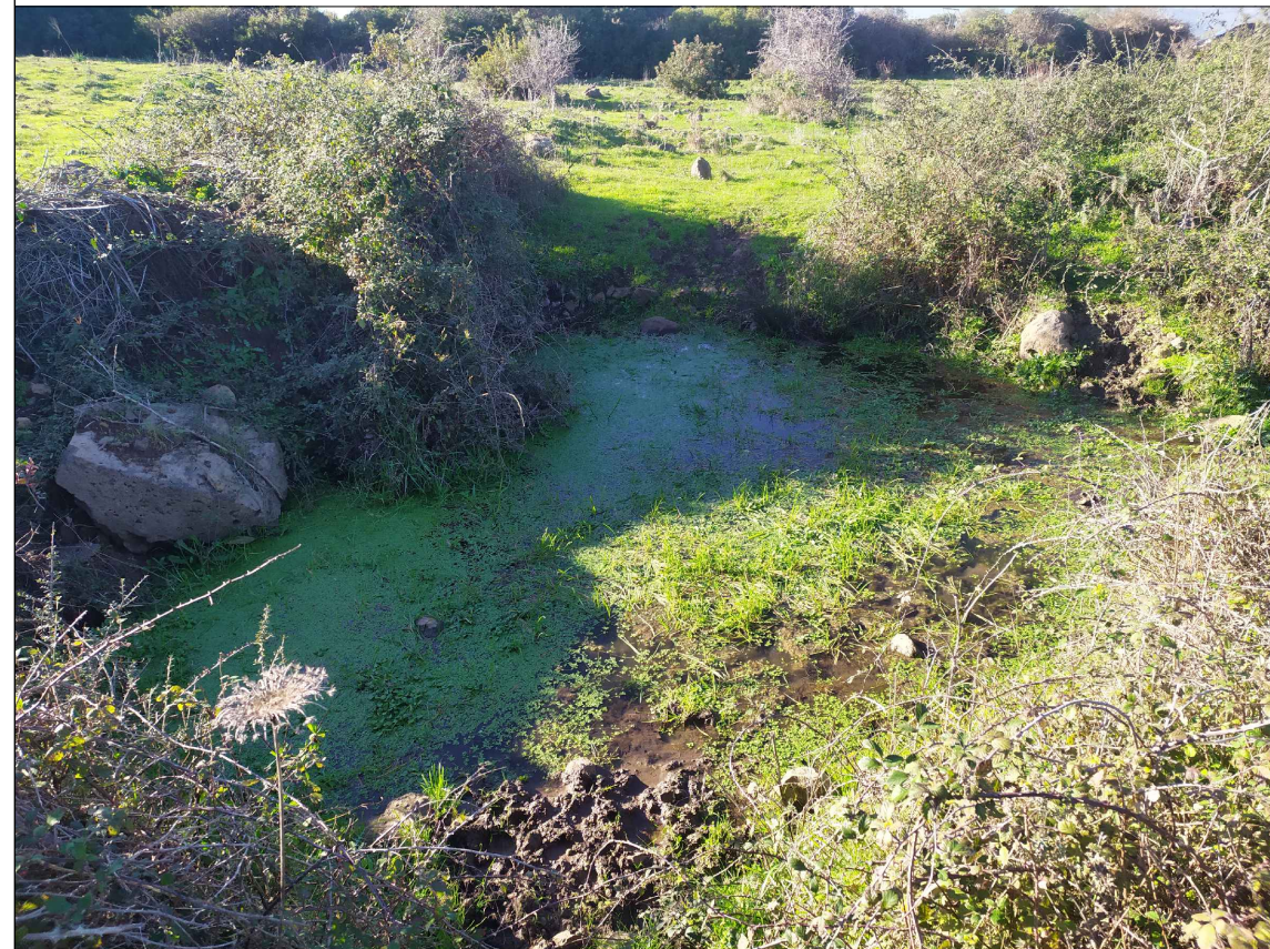
SCATTO P5; ANGOLO DI RIPRESA 10°; COORDINATE 551702 m E; 4468177 m N.