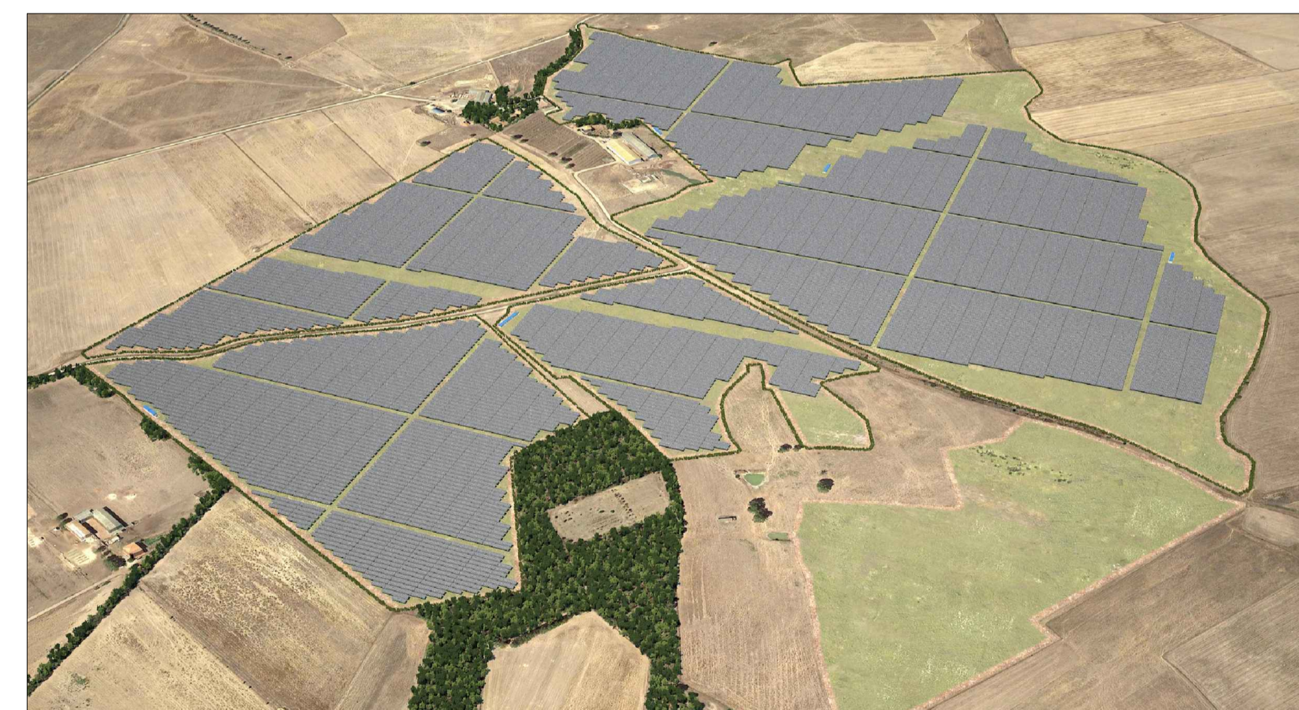
VISTA B - POST OPERAM CON MITIGAZIONE