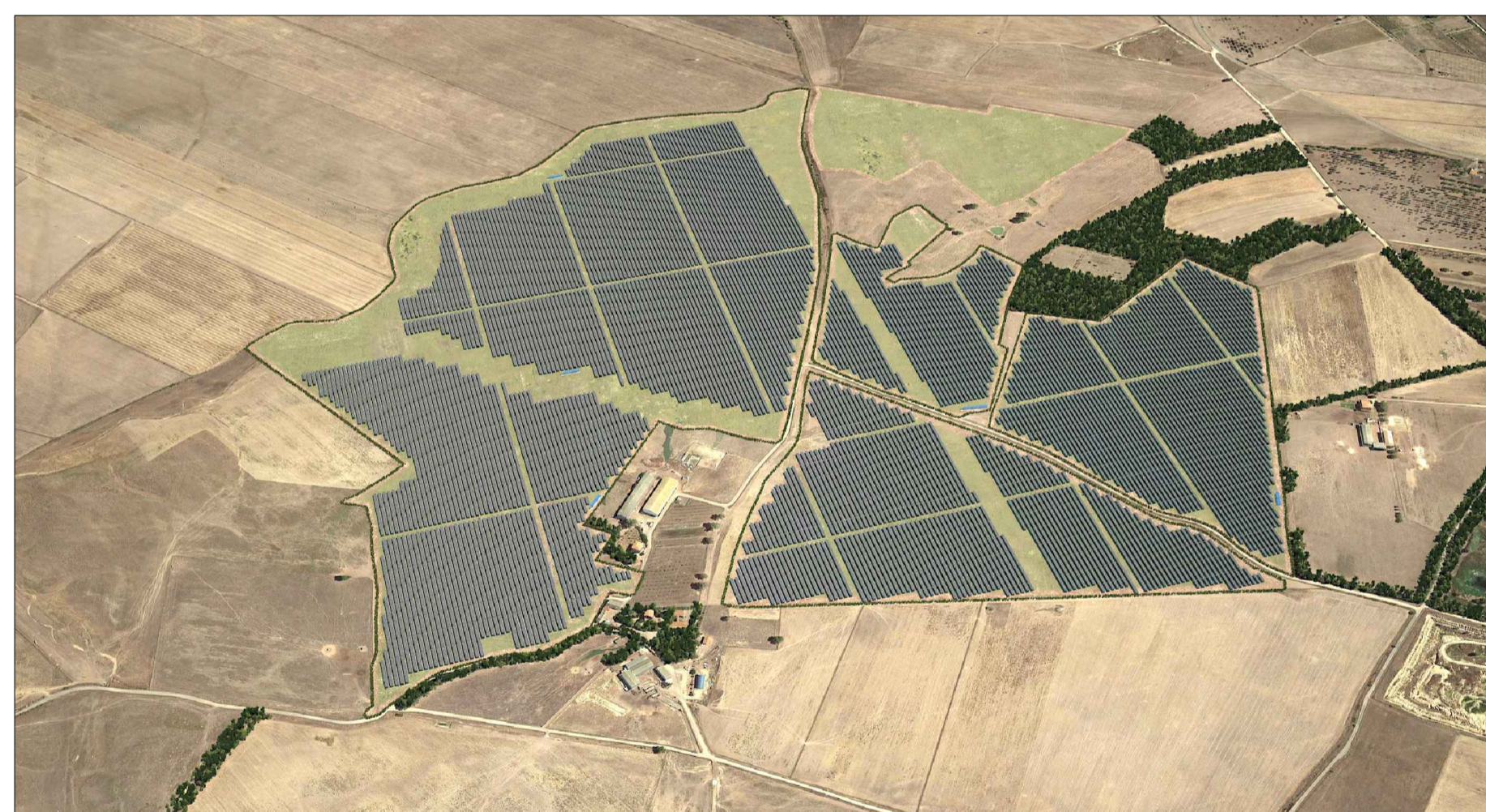
VISTA A - POST OPERAM CON MITIGAZIONE