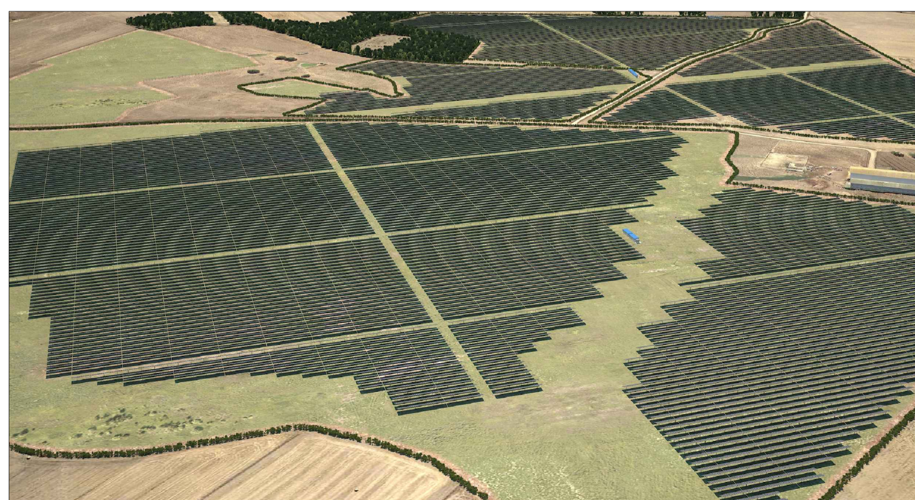
VISTA C - POST OPERAM CON MITIGAZIONE