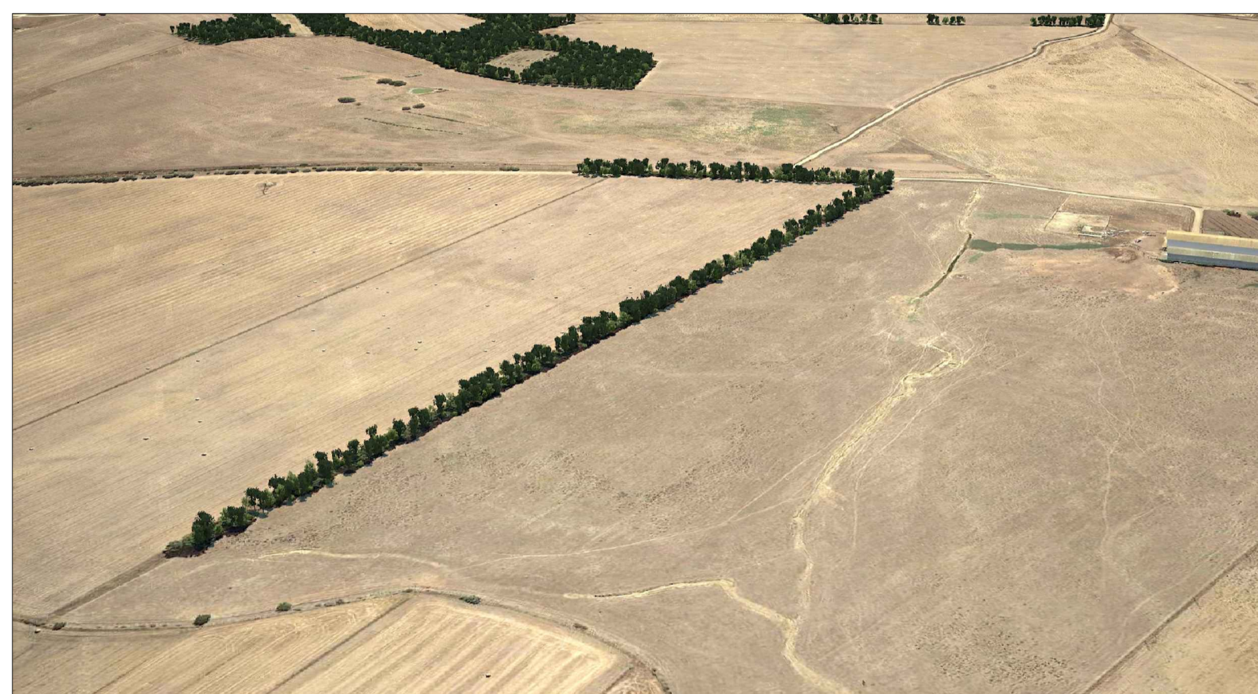
VISTA C - ANTE OPERAM