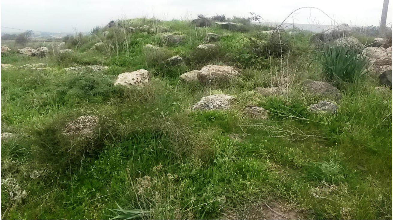
Figura 2: Nuraghe Aurras