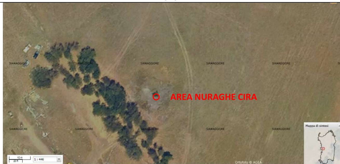
Figura 2: Stralcio ortofoto della zona di intervento con indicazione del punto in cui presumibilmente sorgeva il Nuraghe Cira - Carta del rischio archeologico dei vincoli archeologici.