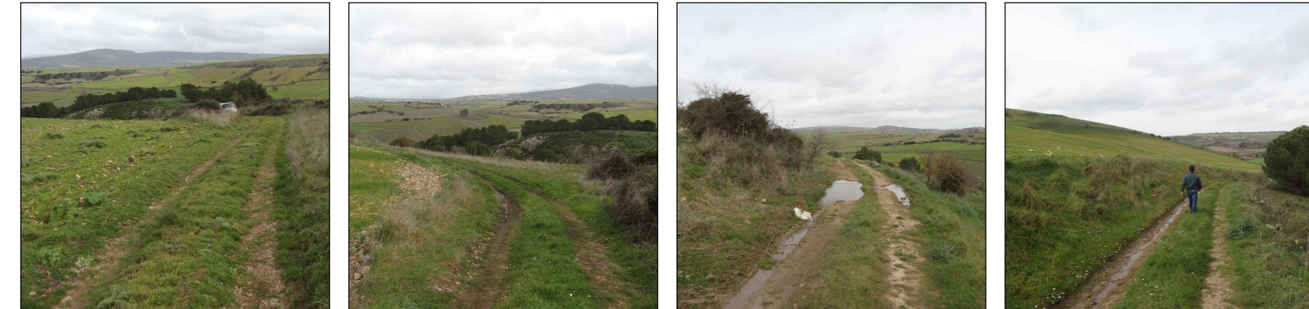
T08A - Foto 04