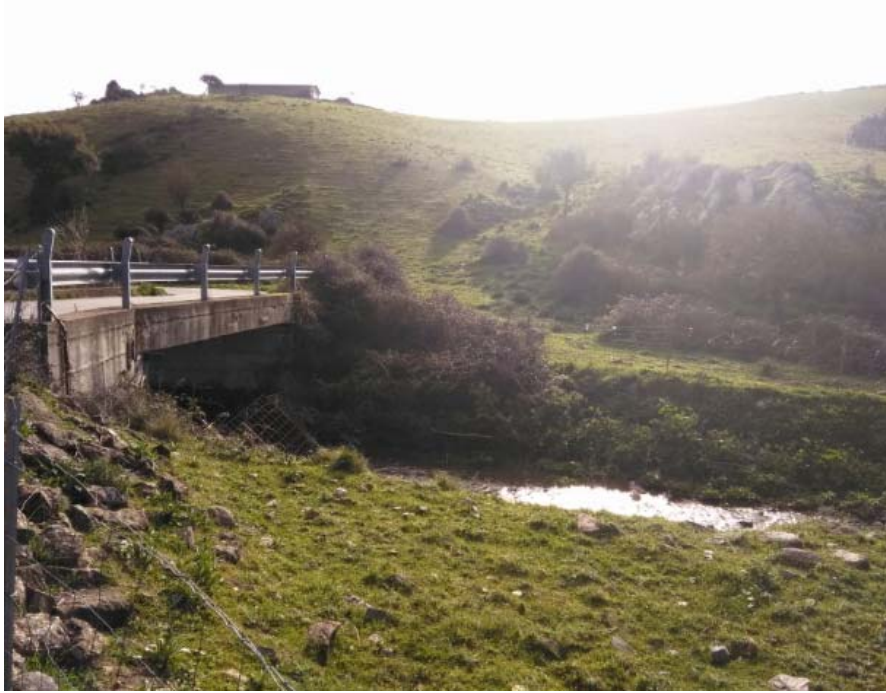
Punto di attraversamento n°1 - Rio Arroglasia

qualsivoglia interferenza tra opera in rete e deflussi superficiali. La dislocazione dell'attraversamento del corso d'acqua è riportato nella tavola NU_PE_T002