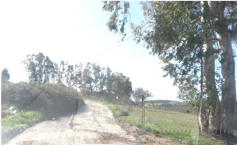
Punto di attraversamento n°4

Gli attraversamenti dei Rio Gravelloni e Rio Arroglasia, che mantengono una portata d'acqua per una buona parte dell'anno, sono previsti tramite perforazione orizzontale teleguidata. Questo tipo di posa permette di installare l'elettrodotto al di sotto dei corsi d'acqua senza impatto sulla superficie.