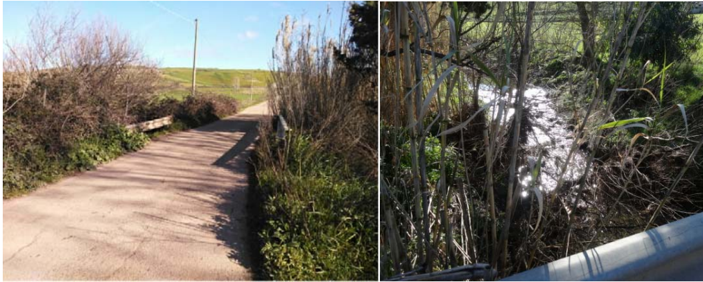
Punto di attraversamento n°3 - Rio Gravelloni