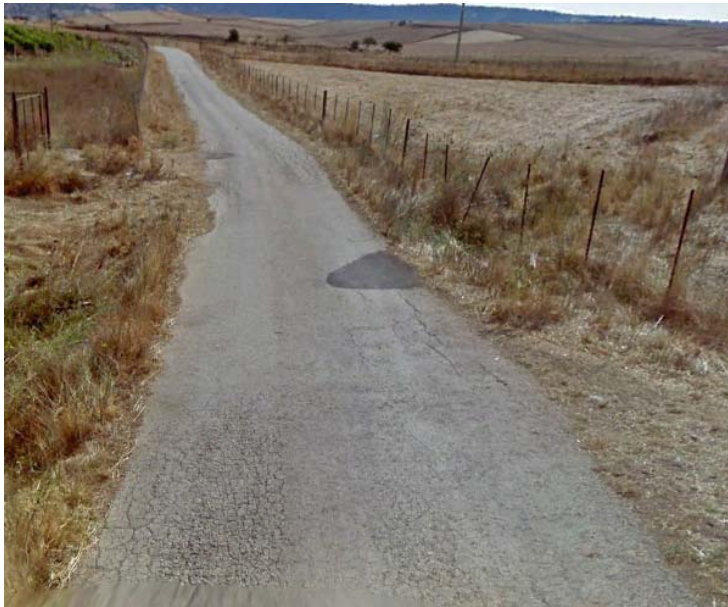
Punto di attraversamento n°2