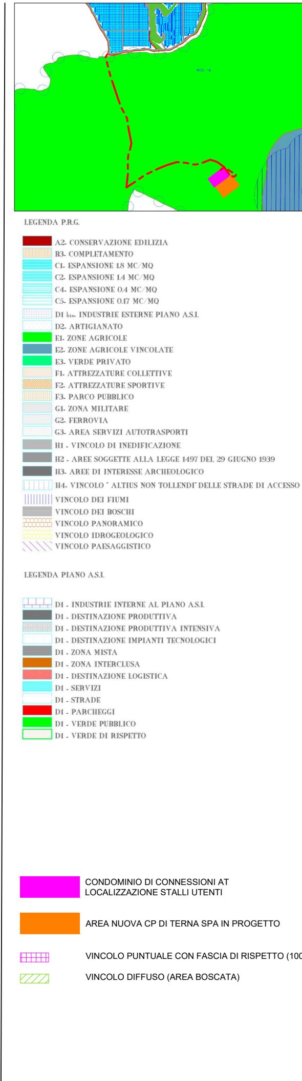
SCALE 1:25.000 PRG ANAGNI