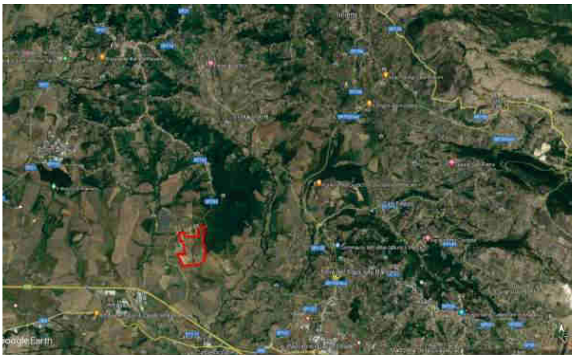
Ortopanoramica del sito di installazione