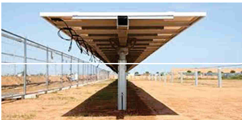
Figura 3 – particolare d'installazione