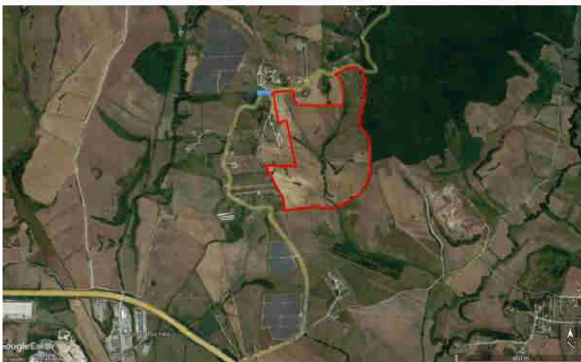
Ortopanoramica e dettaglio del sito di installazione