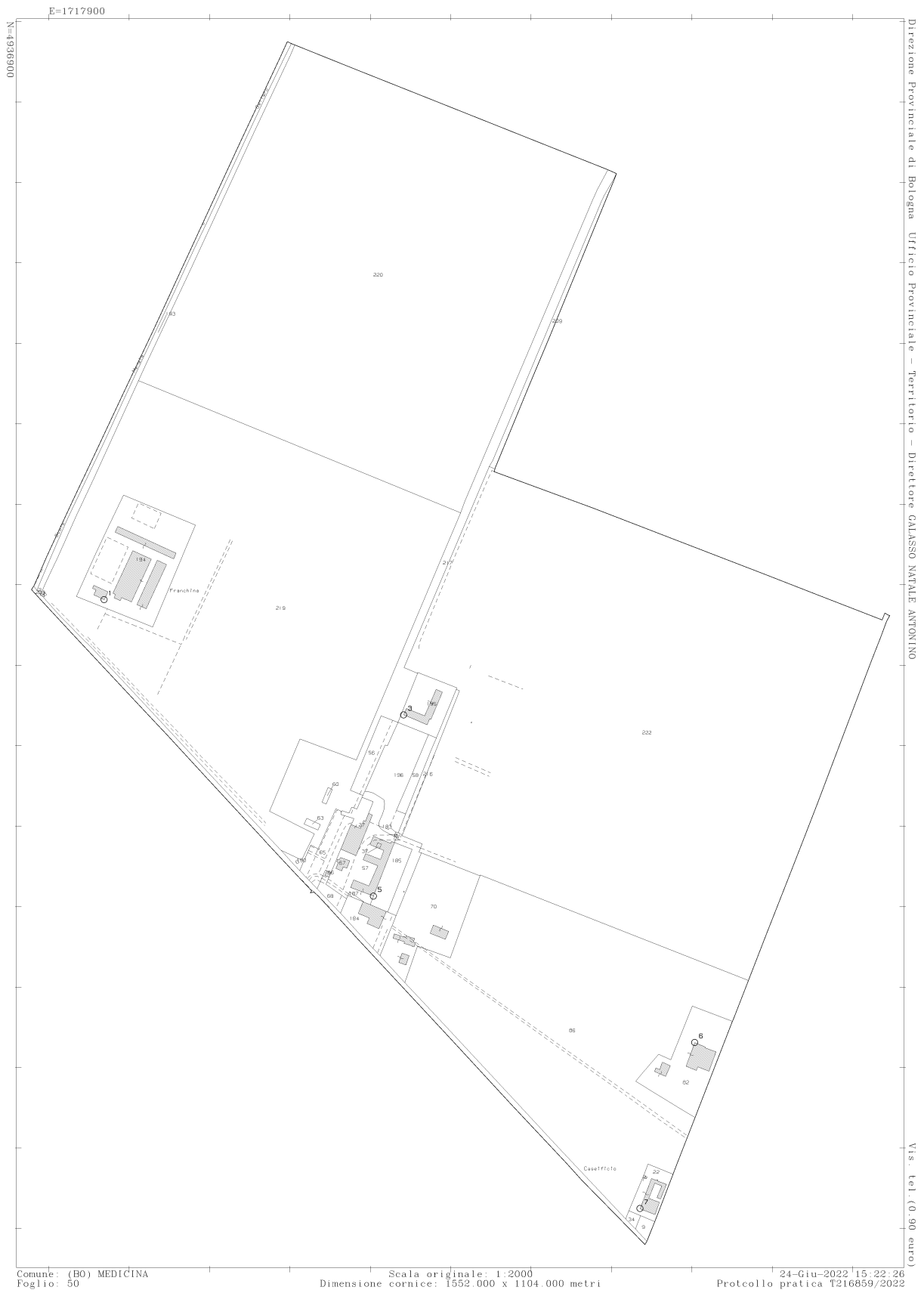
Figura 6 - Foglio 50 del Comune di Medicina (BO)