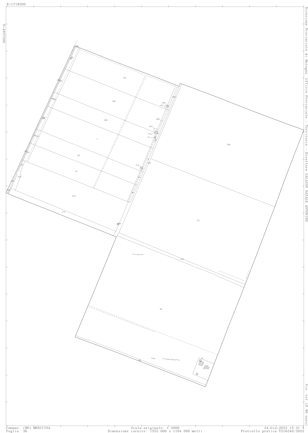
Figura 4 - Foglio 36 del Comune di Medicina (BO)