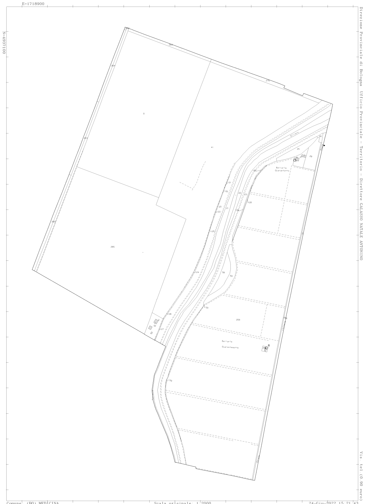
Figura 5 - Foglio 37 del Comune di Medicina (BO)