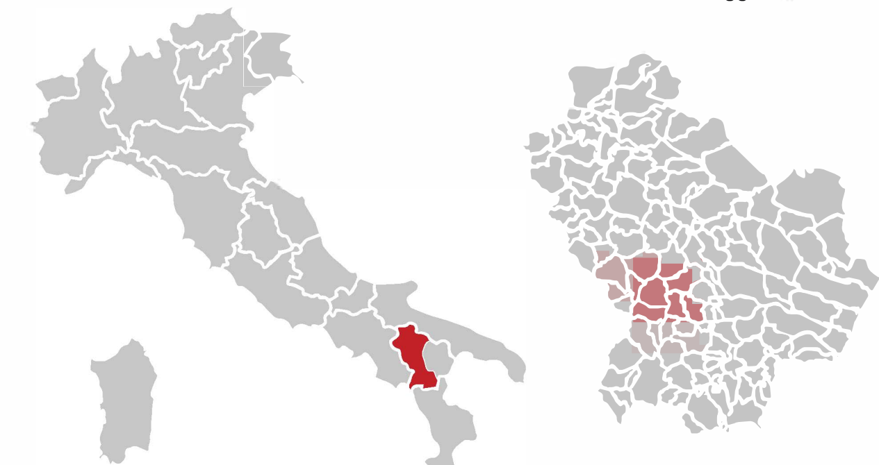
Ubicazione Comuni di Grumento Nova e Viggiano