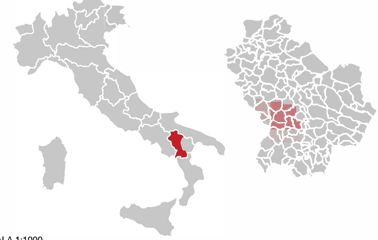
Ubicazione Comuni di Grumento Nova e Viggiano