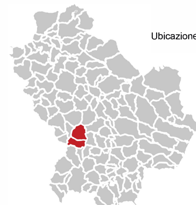
Ubicazione Comuni di Grumento Nova e Viggiano