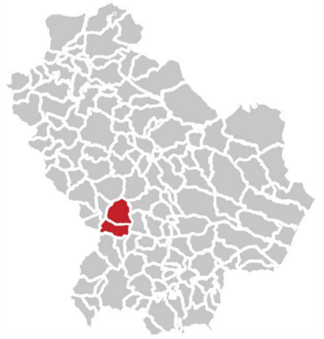
Ubicazione Comuni di Grumento Nova e Viggiano