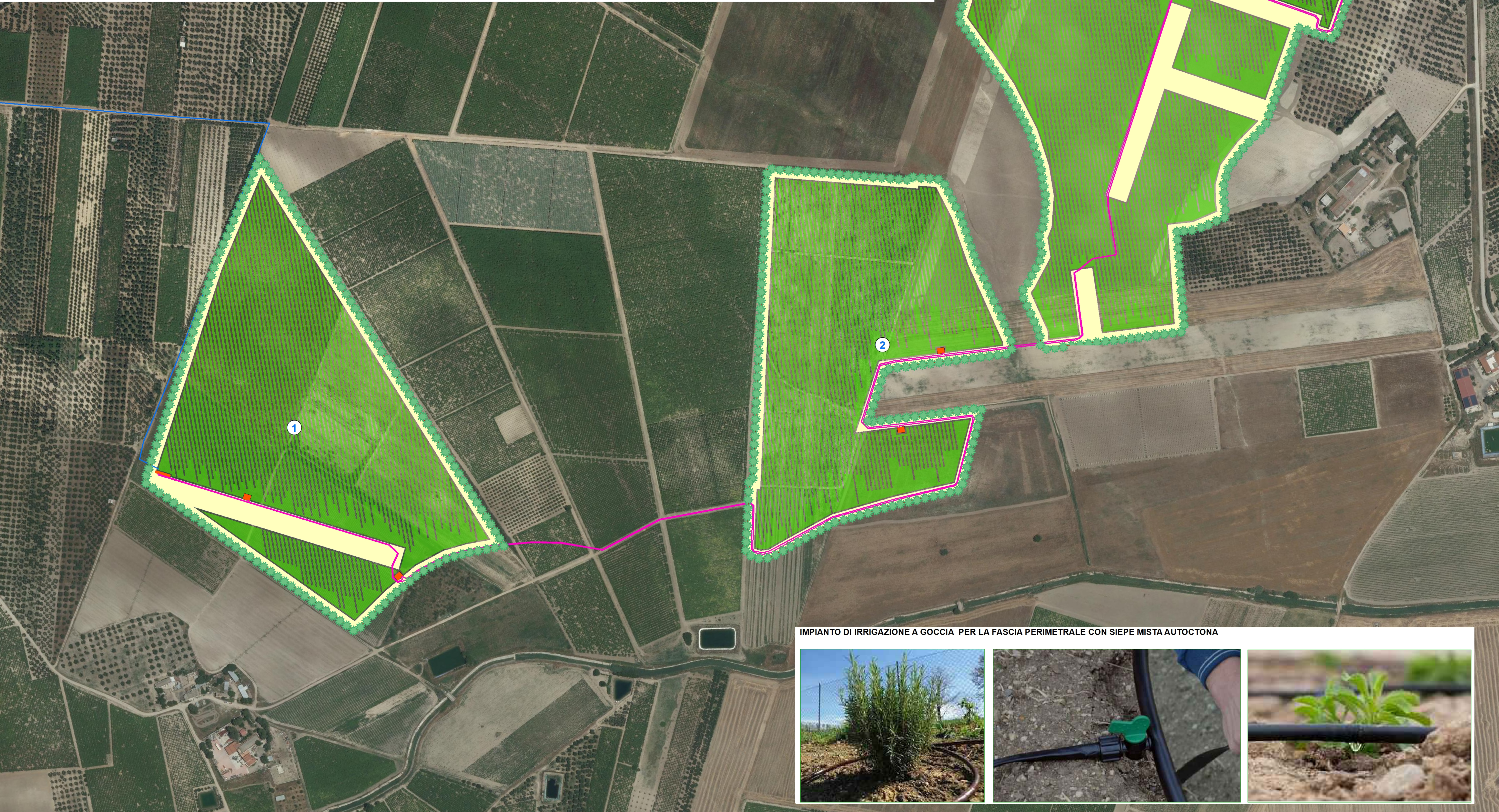
IMPIANTO DI IRRIGAZIONE A GOCCIA PER LA FASCIA PERIMETRALE CON SIEPE MISTA AUTOCTONA