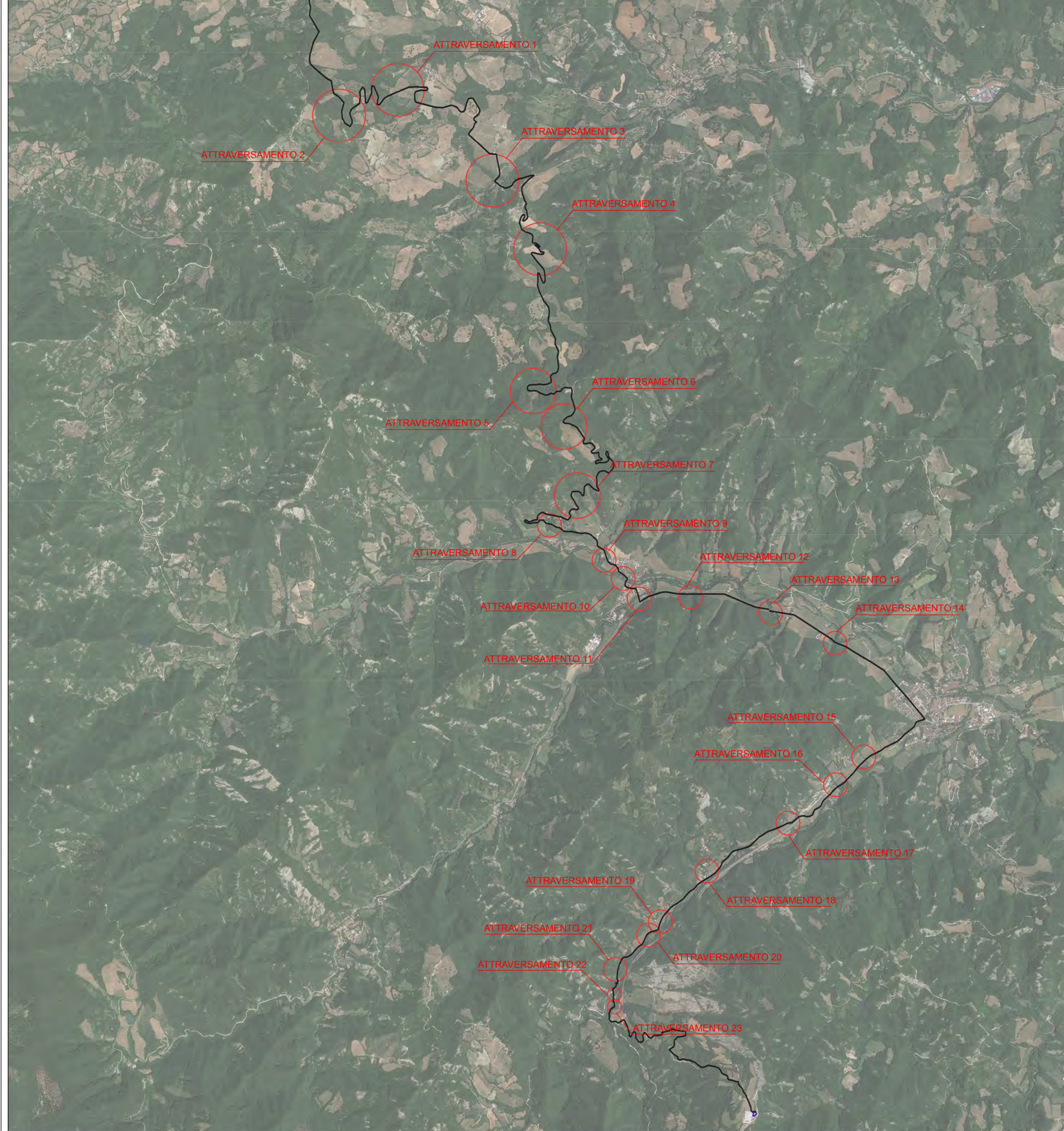
Individuazione delle interferenze su ortofoto 1:25000