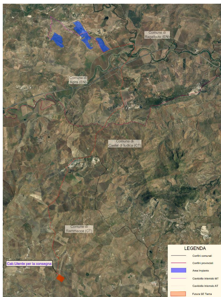
Figura 1: area di progetto su aerofotogrammetria

L'impianto ricade su terreni di proprietà privata che ricadono in zona E Agricola. L'area di studio è raggiungibile dalla A19, uscita Catenanuova verso SS192 direzione Agira (EN).