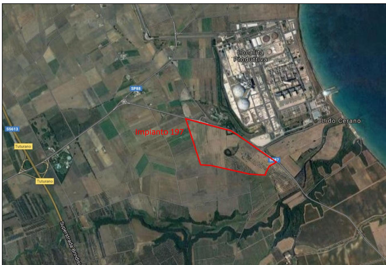
Figura 1 - Localizzazione dell'impianto da realizzare (in rosso)

L'intera area è ubicata in zona E agricola distinta in catasto terreni al Foglio 171 part.lla: 8, 9, 10, 21, 25, 532, 536, 677, 679, 681, 683, 685, 687, 689.