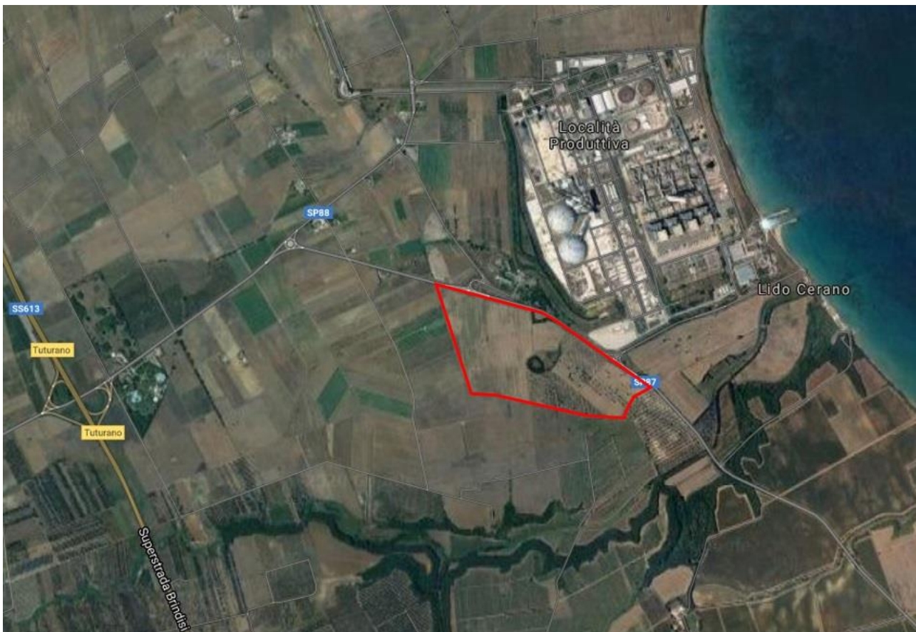
Inquadramento dell'area di intervento su base satellitare.