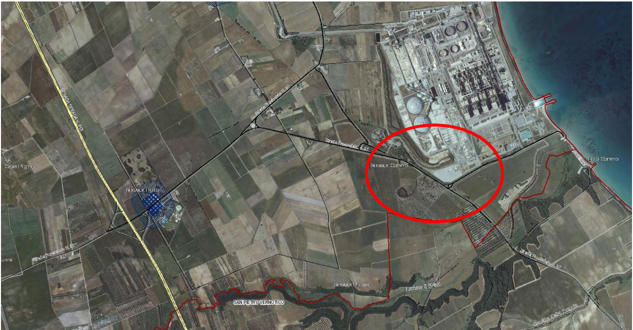
Stralcio dal PPTR. In rosso l' area di intervento. In blu i beni storico culturali (masserie).

Dall'analisi risulta che nell'area d'intervento e nelle sue prossimità non ricadono aree a rischio archeologico.