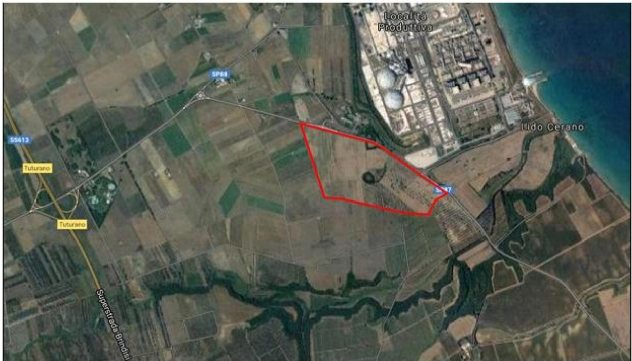
Fig. 1 - Localizzazione dell'impianto da realizzare (in rosso)

L'area oggetto dell'intervento in esame è costituita da un impianto agrovoltaico da realizzarsi in zona E agricola distinta in catasto terreni al Foglio 171 part.lla: 8, 9, 10, 21, 25, 532, 536, 677, 679, 681, 683, 685, 687, 689.