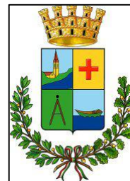
Comune di Musile di Piave