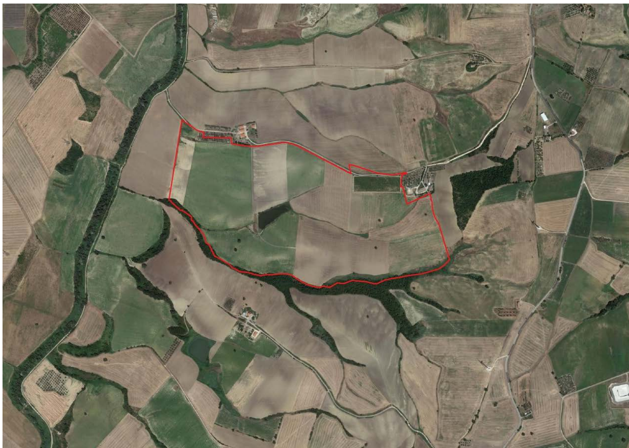
Figura 1: Vista ortofoto dell'area oggetto dell'intervento.

Dalla foto aerea ( Figura 1 ) di seguito riportata si evince l'ubicazione dell'impianto.