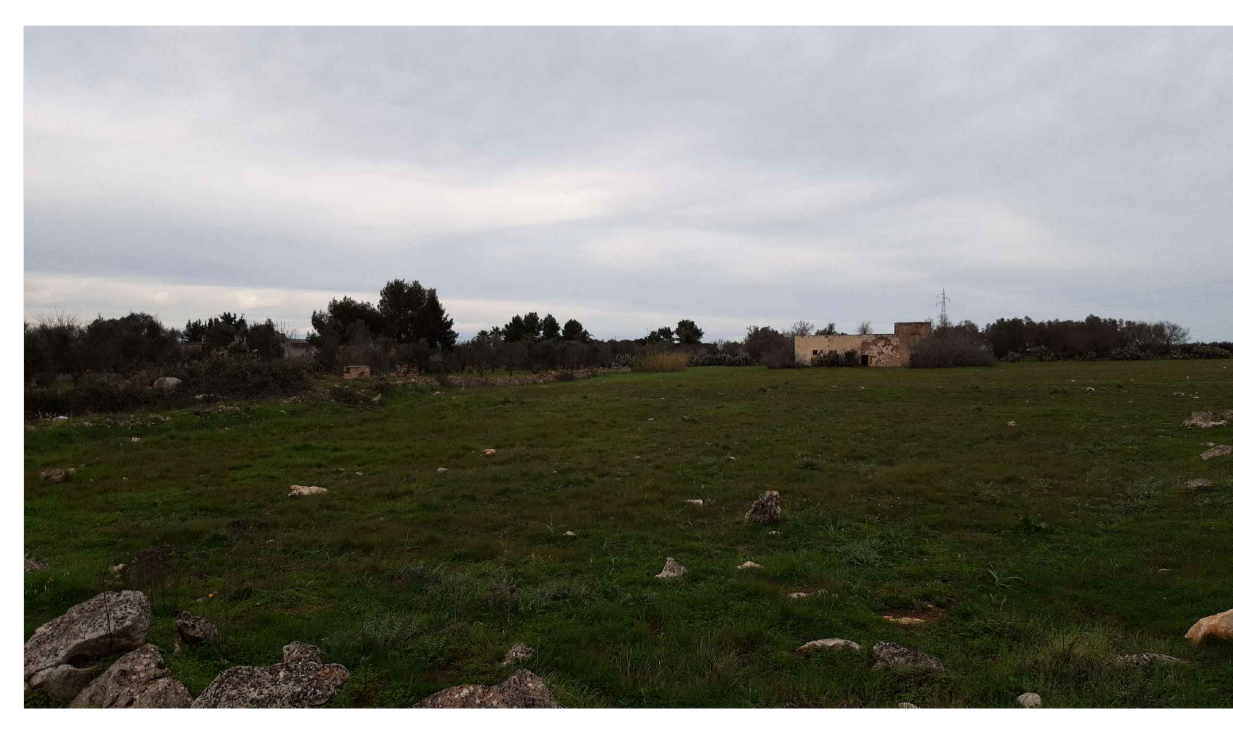
PUNTO DI PRESA FOTOGRAFICA 8