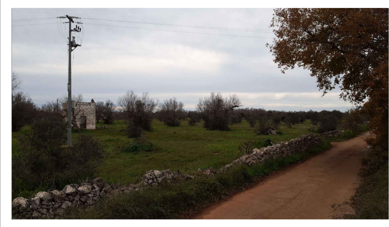
PUNTO DI PRESA FOTOGRAFICA 9